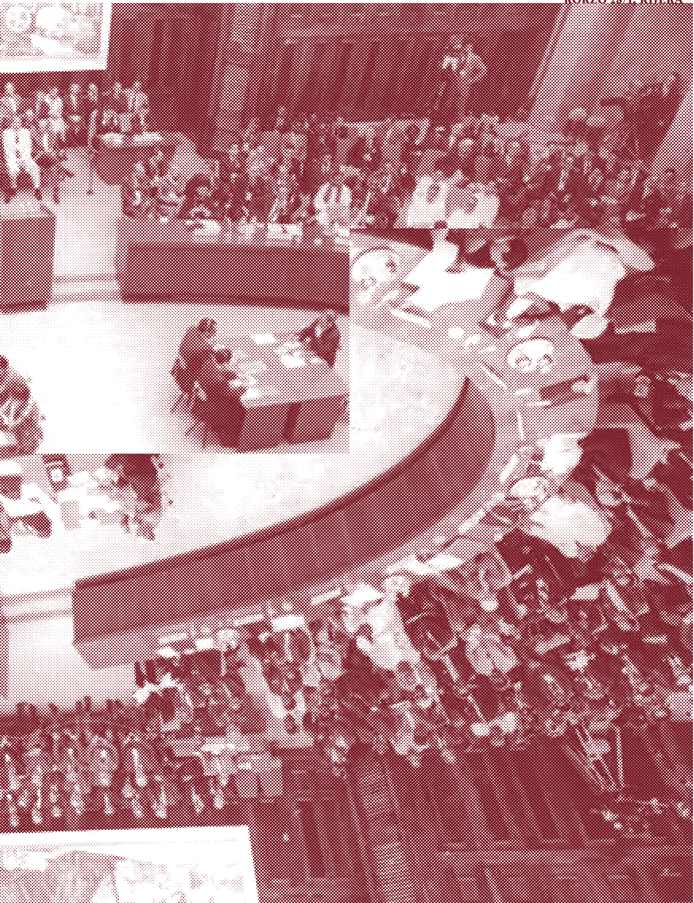
KORZO 28/L RIJEKA