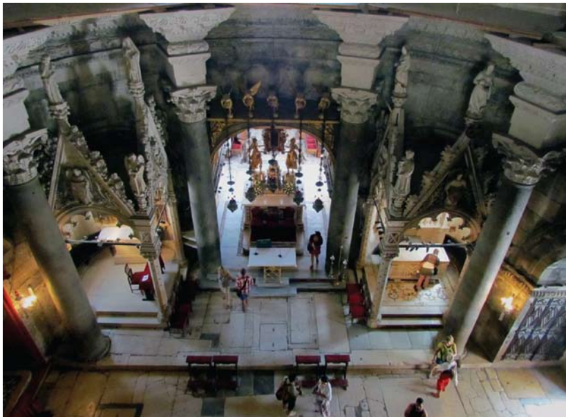
Prezbiterij splitske katedrale – pogled odozgo.