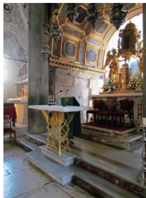
Glavni oltar – današnji izgled.