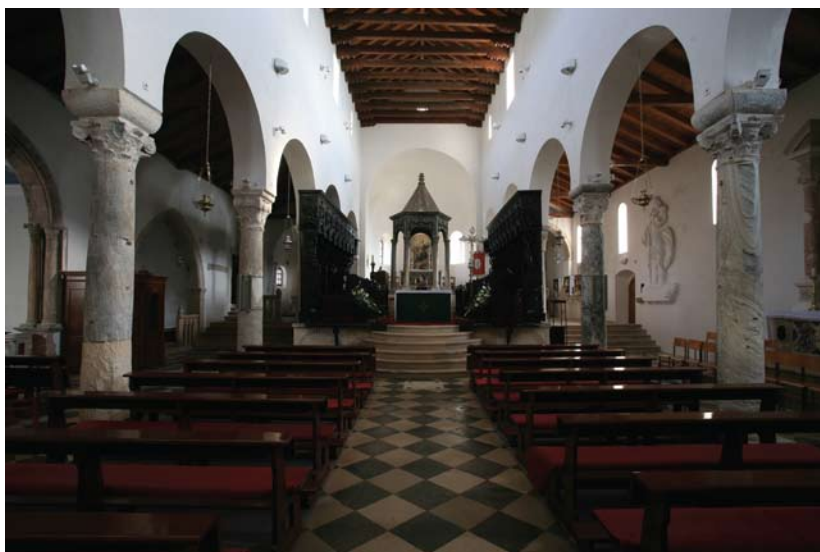
Katedrala u Rabu.

se i korske klupe u Rabu, a one se u nizu elemenata podudaraju s korskim sjedalima u katedrali Sv. Stošije u Zadru, Matejevim dokumentiranim radom. U prilogu će se nastojati pojasniti međusobni odnosi drvorezbara porodice Moronzon, te utvrditi povijesno društvene okolnosti na osnovu kojih se može pretpostaviti da je Matej autor korskih sjedala u Rabu.