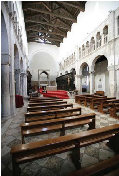
Katedrala u Zadru - pogled prema svetištu:

Svi elementi u strukturi svetišta bazilike svjedoče o liturgijskim mijenama koje su mijenjale i arhitektonske oblike prezbiterija zadarske katedrale.