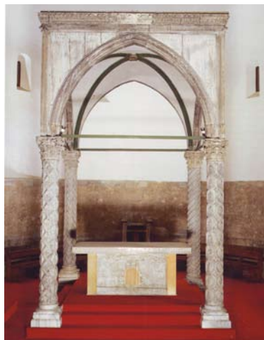
Današnji izgled ciborija, s oltarom koji je podno njega postavljen 1926. godine. Kapiteli prednjeg lijevog i stražnjeg lijevog stupa su izvorni, dok su kapiteli desnih stupova kopije izvedene prema izvornicima 1903. godine.