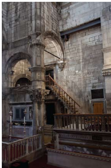
Katedrala Sv. Jakova, pogled na sakristiju.