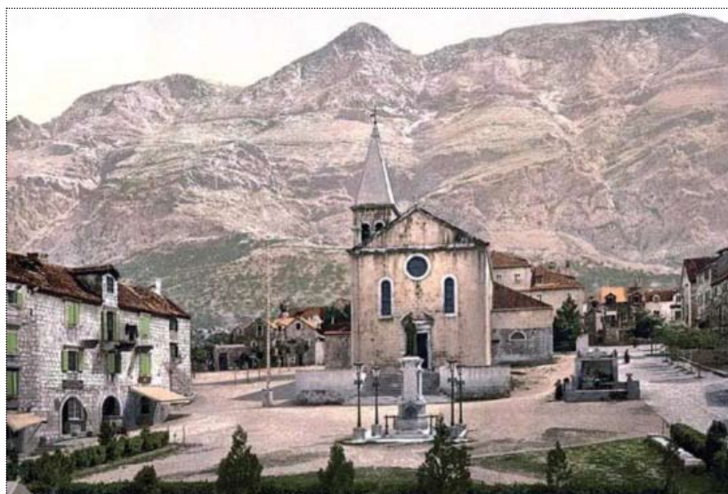
Katedrala sv. Marka u Makarskoj, stara razglednica.