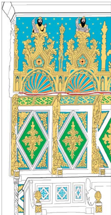
Rekonstrukcija polikromije klupa iz 15. stoljeća. (nacrtala: Ksenija Škarić)