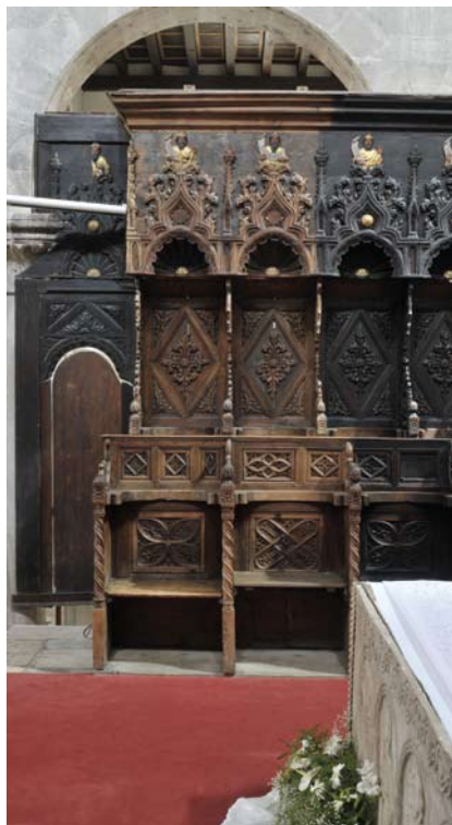
Dijelom uklonjena repolikromija klupa.