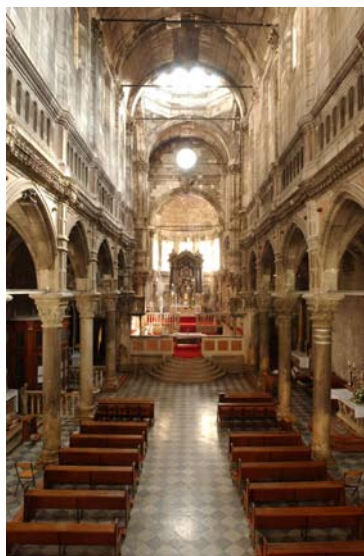
Katedrala Sv. Jakova, interijer.

ga nema dovoljno, odnosno gdje ga nema uopće, kao u slučaju sakristije i riznice nad njom, jednostavno – stvorio. No, ključ prostornog rješenja njegova slikovitog, stepenasto uzdignutog svetišta leži u ideji smještaja krstionice pod južnom kapelom, te s njom povezane sakristije koju je postavio na stupove i prislonio uz istočnu stranu biskupske palače. Krstionica je ne samo uvjetovala podizanje razine poda pod oltarom za dva metra u odnosu na razinu poda u glavnom brodu, već je u povezivanju s okolnim prostorima, uzrokovala je čitav niz što većih što manjih tlocrtno-prostornih prilagodbi i kompromisnih rješenja. To se prije svega odnosi na lom južnog zida transepta kako bi se u dobivenom prostoru smjestilo stubište koje vodi do sakristije. Stoga iako se počesto govori samo o izgledu, stilskim i ikonografskim značajkama novog poligonalnog svetišta, montažnoj tehnici gradnje ili kiparskom uresu crkve sv. Jakova, intervencije koje je Dalmatinac poduzeo, zasigurno ne sam već u dogovoru s biskupom Jurjem Šižgorićem, u prvom su redu bile vezane uz temeljne zahtjeve funkcionalnog ustroja katedrale kao primarno obrednog, kulturnog mjesta.