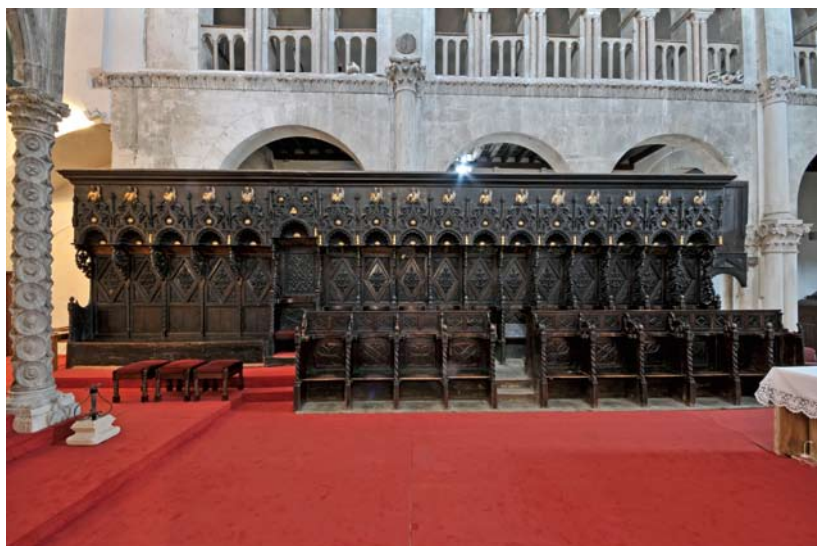
Zadar, katedrala sv. Stošije, korska sjedala.

Konzervatorsko-restauratorski radovi na gotičkim korskim sjedalima započelo je još 1969. godine, ali je 1972. godine financiranje obustavljeno, pa su napola restaurirani dijelovi ostali pohranjeni u depou sve do 2010. godine kada je u Hrvatskom restauratorskom zavodu pokrenut program usmjeren njihovom povratu. U restauriranju 1969.-1971. godine s većine pohranjenih dijelova uklonjeni su slojevi repolikromije da bi se predstavilo golo drvo – izgled kakav sjedala nisu imala niti u svojoj prvotnoj zamisli niti u kasnijim obnovama. Premda je ovakvo proizvoljno restauriranje u međuvremenu napušteno, a kult „izvornika“ doveden u pitanje, rezultati su u svetištu zadarske katedrale itekako vidljivi i mogu poslužiti kao opomena protiv ponavljanja sličnih pogrešaka.