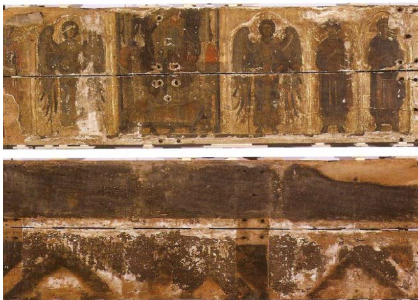
Slika na drvu s centralnim prikazom Bogorodice s arhangelima i svecima iz trogirске katedrale. Total fotografiran u tijeku restauratorskih radova (gore) i stražnja strana umjetnine u tijeku restauratorskih radova (dolje).