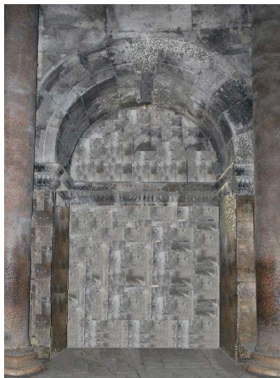
Računalna rekonstrukcija izvornog izgleda istočne kvadratne niše splitske katedrale. (autorica: Žana Matulić Bilač)

donijele su i nove podatke za daljnje objašnjenje naizgled cjelovite barokne koncepcije oltara, a koja se zahvaljujući njima može početi razmatrati unutar šireg vremenskog okvira nego li do sada te kronološki raslojiti kroz razdoblje od 1620-tih do 1689., kada je zaokružen njegov današnji izgled - odnosno dati dokaze o ranijem početku barokizacije oltara. Ovakav prijedlog njegovog povijesnog razvoja je zahvaljujući kronologiji izmjena gabarita niše zamišljen kao potpuno otvoren za nadogradnje i provjere podudarnosti dimenzija sačuvanih elemenata oltarnog namještaja unutar različitih presjeka i prazne prostorne snimke, kao i provjeru iznesenih zaključaka. Istraživanje je provedeno tijekom šestogodišnjeg konzervatorsko-restauratorskog zahvata kojeg je započeo Konzervatorski odjel u Splitu 2006., a dovršio HRZ - Odjel u Splitu 2012. godine.