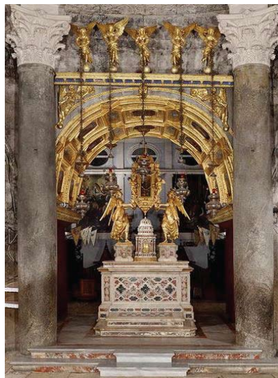
Glavni oltar – izgled nakon konzervatorsko-restauratorskog zahvata 2006.-2012.