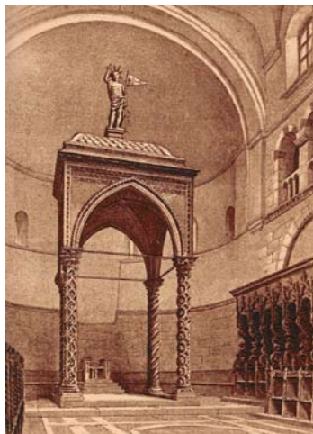
Izgled ciborija oko 1887. godine. Iz: T. G. Jackson, Dalmatia, the Quarnero and Istria : with Cattigne in Montenegro and the Island of Grado , Vol. I., Oxford 1887., Tabla IV.

doprinijela težina plitke kupole dozidane na kruni ciborija krajem 18. stoljeća, u kombinaciji s korozijom željeznih klinova u unutrašnjosti kapitela. Zbog osnovane prijetnje da bi u svakom trenutku mogao pasti, te pritom oštetiti "coro artistico" ali i prouzročiti ozbiljnija oštećenja na kamenim dijelovima ciborija koje je trebalo sačuvati za njegovu buduću rekonstrukciju, G. Smirich i Ć.M. Iveković nalažu hitnu demontažu ciborija. Da bi se izbjegla i bilo kakva "triste conseguenza", Iveković zabranjuje služenje mise i drugih obreda u njegovoj blizini. Već je za demontažu, koja je po svemu sudeći izvršena promptno, angažirana zadarska radionica Cassani e Gasparini , koju su vodili kipari i graditelji oltara Giuseppe Cassani i Domenico Gasparini. Isti će majstori izraditi i dva nova kapitela ciborija, od trogirskog kamena, a po izravnom ugledanju na one nepovratno oštećene. Godinu poslije će prema Ivekovićevim nacrtima izraditi i dva modela nerealiziranog novog završetka ciborija.