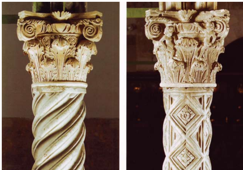
Jedan od dva kapitela ciborija koje su izradili kipari Giuseppe Cassani i Domenico Gasparini 1903. godine (lijevo) i kapitel iz 1324. godine (desno).