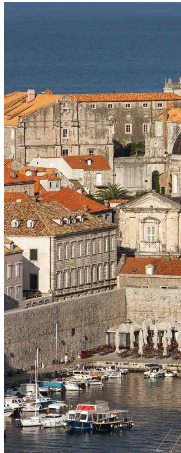
Katedrala s isusovačkim kompleksom u pozadini

Za obnovu katedrale nakon potresa 1979. godine bile su, dakako, relevantne i znanstvene spoznaje o samoj baroknoj građevini, ali te su teme u programu Instituta došle na red znatno kasnije. Tako je arhitektura barokne katedrale uvrštena u znanstveni projekt