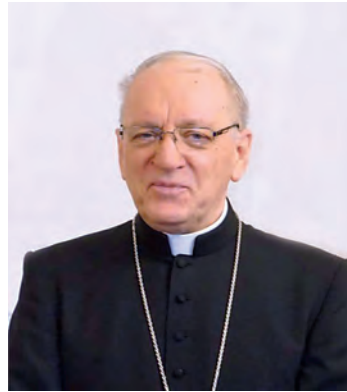
Biskup Antun Škvorčević

Monografija pod naslovom Požeška katedrala važan je crkveno-kulturni pothvat jer je ona prvi cjeloviti stručni prikaz kasnobaroknog zdanja, podignutoga za župnu crkvu sredinom 18. stoljeća. Kvalitetom arhitekture, opreme i svojom veličinom crkva kao da je bila predodređena za svrhu koja nadilazi župne potrebe. Apostolskim pismom Praeclarum evangelizationis opus 5. srpnja 1997., kojim je osnovao biskupiju sa sjedištem u gradu Požegi, papa Ivan Pavao II. odredio je: »Crkvu Bogu podignutu u tom mjestu, a posvećenu u čast svete Terezije, uzdižemo na stupanj i dostojanstvo stolne crkve, podjeljujući joj prava i povlastice koje takvim hramovima pripadaju.« Navedenim činom sveti Papa okončao je i raspravu o pitanju osnutka biskupije na području zapadne i srednje Slavonije sa sjedištem u Požegi. To pitanje ostalo je, naime, otvoreno i nakon sjednice Povjerenstva za razgraničenje biskupija 1781. godine u Beču, koja je imala negativan ishod, uglavnom zahvaljujući stajalištu zagrebačkog kanonika Antuna Mandića, rođenoga Požežanina, kasnijega đakovačkog ili bosanskog i srijemskog biskupa.