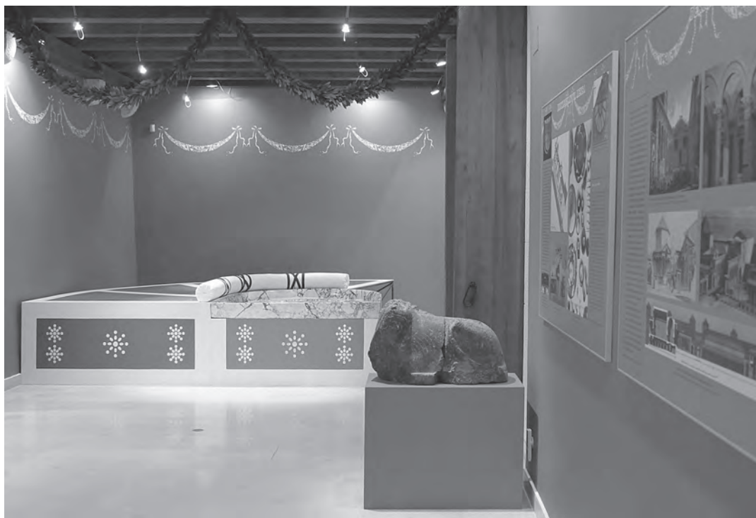
↑→ Presentacija porfirne mense iz IV. stoljeća, pronađene u podrumima Dioklecijanove palače

Dvojezični panoi posjetitelje su upoznali s osobom cara, čiji životopis i spomenike zbog oskudnih tragova nerijetko prate upitnici i oprezno datiranje. Građani i studenti povijesti, povijesti umjetnosti i arheologije, ali i konzerviranja-restauriranja, na ovoj su izložbi imali prigode (a to imaju još uvijek zahvaljujući popratnoj publikaciji) naučiti najvažnije podatke iz careva života i njegova pamćenja nakon smrti. O oskudnosti vrela o životu cara-progonitelja svjedoči činjenica da se pored portreta iz Kopenhagena, Worcestera i Rima stalno pojavljuje sumnja u autentičnost prikazane osobe. Pridajući važnost kasnorimskim portretima vladara strogih, ekspresivnih očiju kao vjerojatnog izraza težnje prema besmrtnosti, u prvoj je dvorani doneseno nekoliko spomenutih odljeva i reljefa koji su pomogli uvođenju u priču o povijesnome Dioklecijanu i njegovim