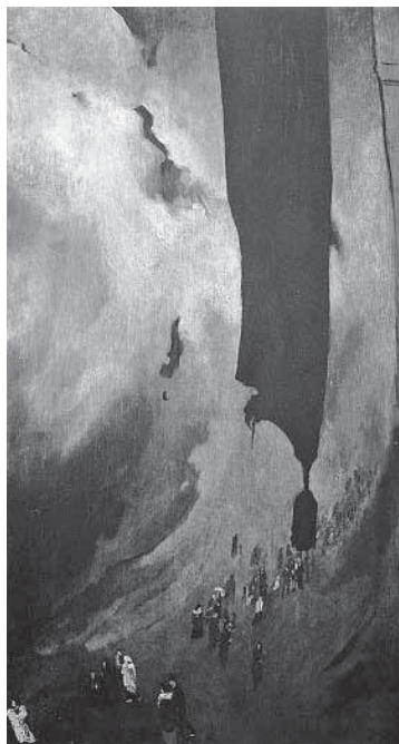
← Ljubo Babić, Crna zastava , 1916.

Asketsko, minimalno, tiho, suzdržano, ozbiljno, kontemplacija oskudnosti, nedostatka, gubitka, praznine – tako su zavladaali i opusom i kolekcijom Josipa Vanište. Egzistencijalna tjeskoba, povlaštena i neiscrpna Vaniština tema, zrači i iz lica sabranih u kolekciju (portreta i autoportreta), kao i iz provincijskih pejzaža te tijela, predmeta i veduta ovijenih sjenama. Osim toga, djela su na izložbi bila kontekstualizirana nostalgičnim Vaništinim dnevničkim zapisima, svjedočanstvima njegove opsesivne borbe s vremenom, odnosno pomne i uporne rekonstrukcije izgubljenog i nestalog: trenutaka, osjećaja, ljudi... Uz crteže i slike na izložbi su se našli i primjerci umjetničkih i književnih časopisa ( Sturm , Juriš , Vijavica ), zbirke pjesama (Šimić, Ujević), spisi (Kandinski, Klein), fotografije i privatna korespondencija. Korespondencija je ostavljala pomalo neugodan dojam, kao