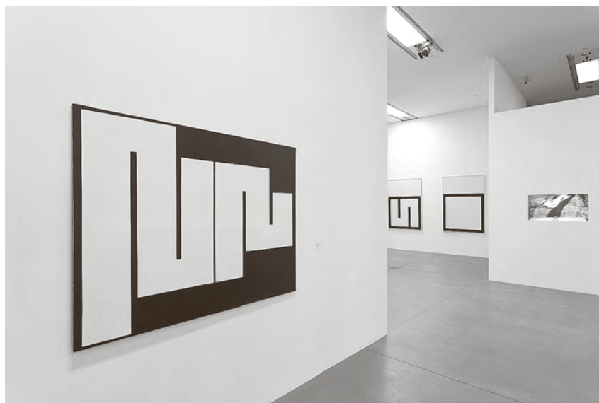
○ S postava izložbe Julije Knifer, Bez kompromisa. Retrospektiva

nelinearan, anti-povijesni, temeljno hermetičan pristup. Unaprijed odustajući od ikakve historizacije izuzev početnog trenutka Kniferova stvaralaštva u kojem je pronašao svoju umjetničku sudbinu u kontekstu djelovanja grupe Gorgona, izložba se posvetila predstavljanju djela u njegovoj vlastitoj samo-izolaciji, dopunivši ga tek citatima umjetnika u vidu popratnog tekstualnog sadržaja na izložbi te s nešto dokumentarnog materijala koji tangencijalno svjedoči o postojanju djela u povijesnom kontekstu. Tek okvirno slijedeći kronologiju nastanka odnosno logiku koju nameće cjelovitost pojedinih ciklusa, struktura izložbe u osnovi dopušta, pa i sugerira ne-linearno sagledavanje. Ističući Kniferovu izjavu kako u njegovom radu redoslijed ne predstavlja nikakav čimbenik, izložbeni niz podržava koncept slobodnog kretanja na osnovi jednom ustanovljenog uzorka. U Kniferovom slikarstvu mijene, dakako, postoje, ali one nisu u užem smislu razvojno svrhovite; ne samo da ne odaju ništa ili gotovo ništa o pripadnosti djela izvanjskom, povijesnom svijetu umjetnosti, nego se i međusobno ne uvjetuju; nakon jedne slike nužno ne slijedi druga, ni