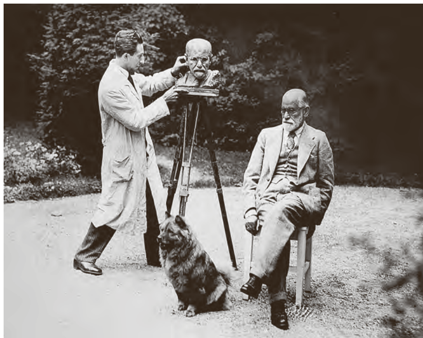
← Oscar Nemon portretira Sigmunda Freuda, Pötzleindorf, 1931. © Estate of Oscar Nemon

ili baš zbog njega, mladi Nemon u bečkoj je sredini bio otvoren za sva progresivna zbivanja u umjetnosti. Iz prvih poglavlja memoara tako doznajemo o definiranom stavu prema ekspresionizmu i kubizmu, kao i o posjetu Parizu gdje ga oduševljava sovjetski, Melnikovljev paviljon na Svjetskoj izložbi 1925. Premda se u vlastitom radu neće otvoreno priklanjati kojemu god umjetničkom pravcu, Nemon će apstrakciju odmah razumjeti i pozdraviti kao radikalni prekid s tradicionalnim umjetničkim uzusima, ali i kao izraz nove, revolucionarne ideologije. (Samo desetak godina poslije takav će idealizam biti nezamisliv; opisujući par stranica kasnije i parišku izložbu 1937. Nemon će pred novim sovjetskim, kao i njemačkim paviljonom samo moći s tugom konstatirati poraz umjetnički slobodnog subjekta pred totalitarnim režimom.) Nakon godine dana bečko okruženje Nemon će zamijeniti briselskim; u Bruxellesu će se napokon domoći i akademije koju će završiti ubrzano i bez ushićenja. I opet: dok će se s jedne strane kretati