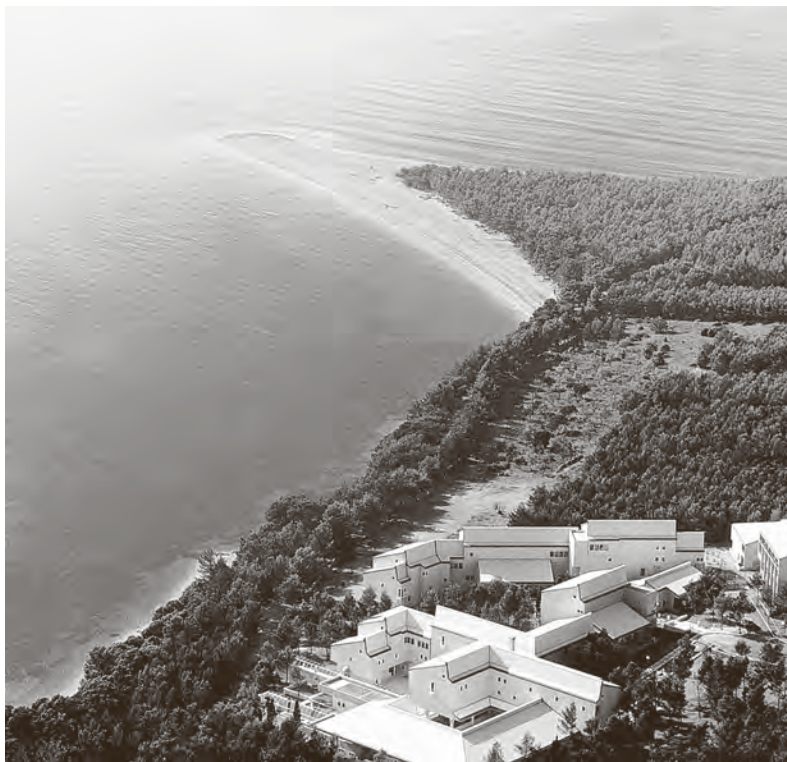
← Hotel Bretanide, Bol na Braču