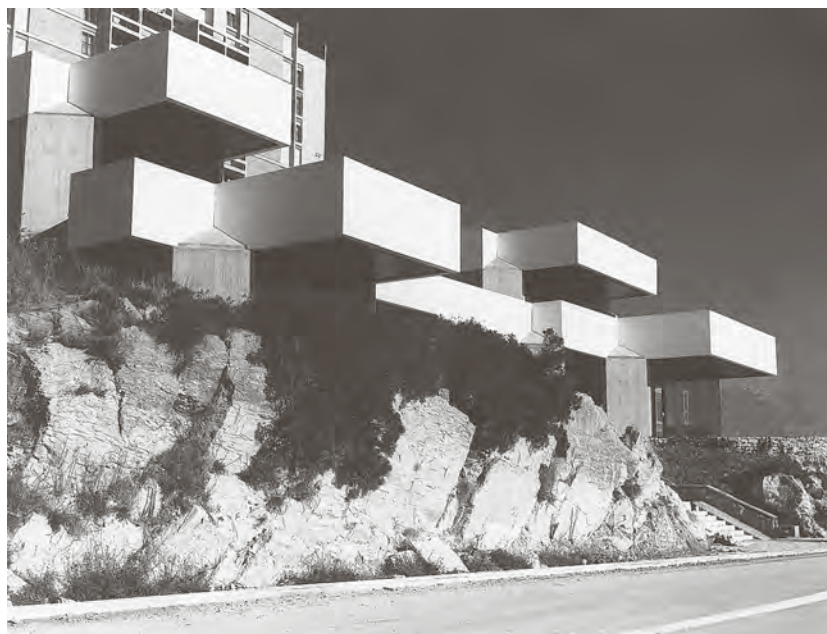
← Opkrbni centar Dalma, Split 3, arhiva arhitekta