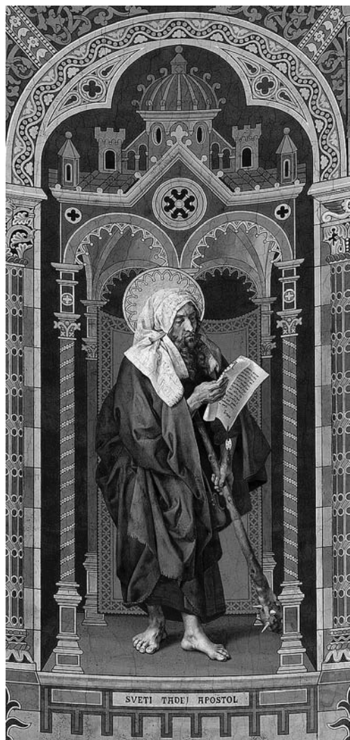
↑ Ludovico Seitz, Sveti Tadej apostol, 1878.–1879.

realizirano je još sedam pobočnih oltara prema Schmidtovim projektima te, u slučaju oltara sv. Križa, Schmidta i Bolléa; radove su vodili Vatroslav Donegani i Adolf Baumgarten. U knjizi su također prvi put objavljeni projekti za orgulje koje su izgorjele 1882. godine, među kojima je nekoliko Schmidtovih, ali i Bolléov projekt romaničko-gotičkog stila. Od ostale crkvene opreme, u knjizi su predstavljene i propovjedaonica, podno popločenje, stolarski radovi, klupe, ispovjedaonice, vratnice katedrale, prozori i vitraji, ali i predmeti umjetničkog zlatarstva, kao i biskupski štapovi među kojima se ističe Strossmayerov bjelokosni štap nastao prema crtežu Ise Kršnjavoga, a u izvedbi bečkog drvorezbara Hermanna Ratzerdorfera.