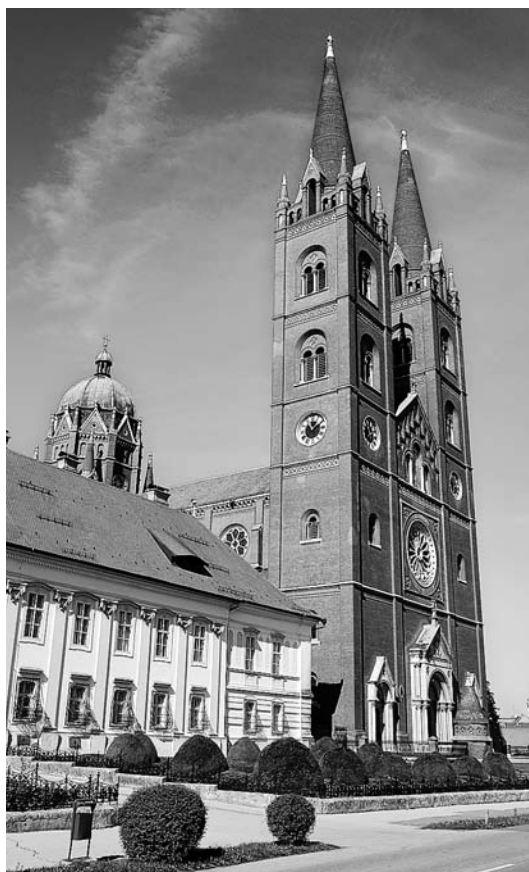
↑ Đakovačka katedrala i biskupski dvor, Foto D. Damjanović

Nakon Rösnerove smrti 1869. godine Strossmayer je angažirao poznata austrijskog arhitekta Friedricha von Schmidta, koji je predložio i realizirao projekte za cijelu unutrašnjost katedrale, ali i intervenirao u nedovršene dijelove arhitekture građevine. Uz Schmidta, naglašena je i važnost angažiranja arhitekta Hermana Bolléa kao