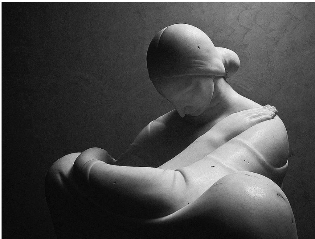
↑ Kontemplacija, Zagreb, 1924., Galerija Meštrović, Split, inv. br. GMS-5, FGM 3141

mecene Karla Wittgensteina, Leopoldine). Nakon izložbe u Muzeju Victorije i Alberta 1915. godine “posjedovati njegov portret ili kakvo djelo predstavljalo je svojevrsan prestiž”, pa Meštrović portretira mnoge ugledne članove britanskog društva (lady Maud Cunard, sir Thomasa Beechama, Eugeniju Errázuriz). Nesumnjivo, portreti su svjedočanstvo ugleda koji je imao u elitnim krugovima bečkog, britanskog, kasnije i američkog društva, što ova knjiga primjereno približava čitatelju.