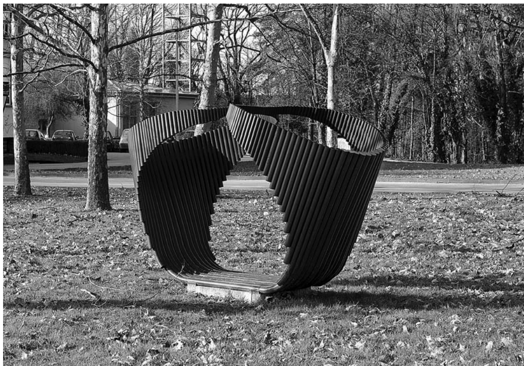
↑ Vera Fischer, Simetrija , 1973., Park skulptura Željezare Sisak

parku danas je sačuvano trideset i osam skulptura koje su nastale u okviru kolonije, premda je njihov broj nekada bio znatno veći. S obzirom na to da je za potrebe očuvanja tih skulptura organiziran niz od pet radionica koje su ostvarene u suradnji četiriju institucija – Konzervatorskog odjela u Sisku, Gradskog muzeja Sisak, Gradske galerije Striegl i Odsjeka za konzervaciju-restauraciju Umjetničke akademije u Splitu, u članku je opisan hodogram djelatnosti provedenih u sklopu radionica. U zaključku teksta autorica je iznijela ključne probleme i pitanja u svezi sa zaštitom i očuvanjem parkovnih skulptura u Sisku napominjući pritom da je dosadašnji rad na toj problematici tek temelj za buduće aktivnosti na tome i srodnim projektima.