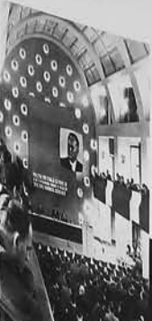
Oslo... Oslo... Oslo...