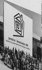
Oslo... Oslo... Oslo...