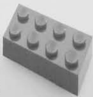
LEGO patentira LEGO kockice. / LEGO patents the LEGO brick.