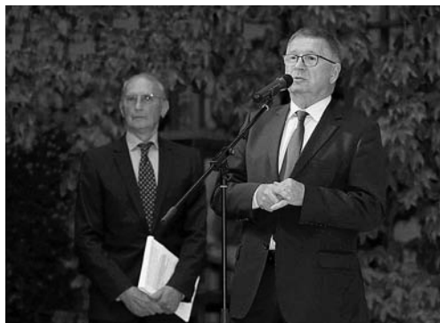
© S otvorenja i postava izložbe