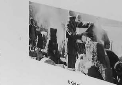
U Kini započinje kampanja industrijalizacije nazvana "Veliki korak naprijed" / China launches the Great Leap Forward industrialization campaign