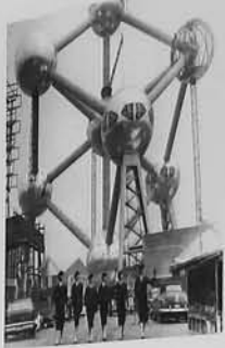
EXPO 58 u Bruxellesu / EXPO 58 in Brussels.