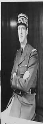
Charles de Gaulle... Charles de Gaulle... Charles de Gaulle...