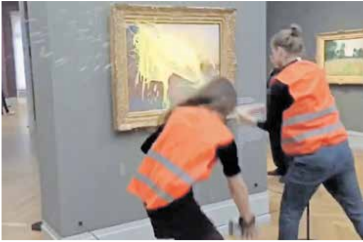
UDRUGA LETZTE GENERATION Dvoje aktivista u njemačkom muzeju bacilo je u nedjelju pire-krumpir na sliku Claudea Moneta

bu protiv klimatskih promjena u njemačkom muzeju bacilo pire od krumpira na sliku Claudea Moneta. Ubrzo ih je privela policija. "Stogove sijena" nisu uspjeli oštetiti jer je i Monetova slika zaštićena staklom. U udruzi kojoj aktivisti pripadaju ne vide ništa sporno u njihovu činu. Dapače, u videozapisu su objavili: "Mi od Moneta činimo pozornicu, a od javnosti publiku. Ako je potrebno sliku prekriti pire-krumpirom ili juhom od rajčice kako bismo podsjetili na to da nas fosilna goriva ubijaju, onda ćemo vam dati pire-krumpir na slici".