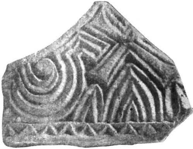
Zavala, ulomak zabata Zavala, part of the gable