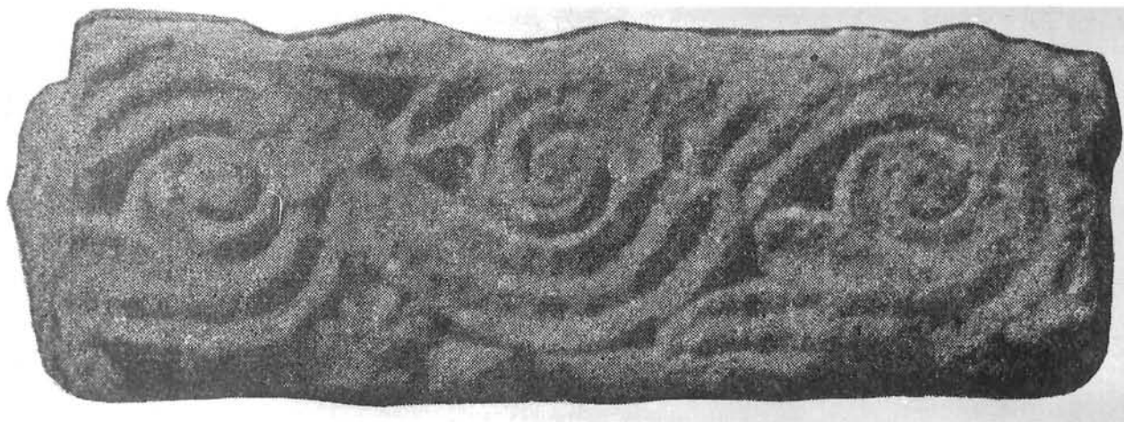
Zavala, greda s viticom Zavala, a beam overgrown with vine

na ranokršćansko podrijetlo. Međutim neke indicije mogle bi ukazivati na vrijeme nastanka. Naime motiv lozice, veoma često korišten u ranom kršćanstvu, u ovakvoj izvedbi ne bi, bez sumnje, dozvolio umetanje rozeta u slobodne prostore. Taj moment će prije ukazivati na karakteristike predromaničke, pa time i okvirno datirati ploču.