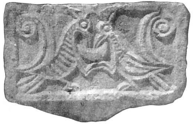
Zavala, ploča s prikazom euharistije Zavala, the Eucharist

11. i 12. stoljeća, u kojima već narativnost kao oblik izražavanja dolazi do svog punog afirmiranja. 20 Što se tiče poblize datacije zavalskog materijala, jedan je dio ulomaka datiran u drugu polovicu 10. stoljeća, a preostali se svojom prosječnom izvedbom uklapaju u zrelu pleternu skulpturu. Ako se, nadalje, usporedi plutej s prepletenim krugovima, prikaze euharistije i plutej s orlom s izborom motiva na zadarskom sarkofagu, koji ih kao motive sve donosi s čak identičnim izvedbama nekih detalja, 21 moguće je i figuralne prikaze pleterne skulpture iz Zavale smjestiti u isto vrijeme s ostalim pleternim fragmentima. Time taj materijal ulazi konačno u krug suvremene produkcije obalnog područja, ne izdvajajući se nikako kao zakašnjela i rustificirana pleterna skulptura.