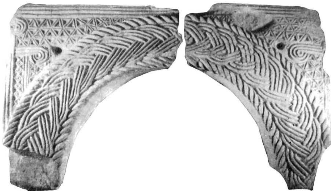
Rogačići, dijelovi ciborija Rogačići, part of ciborium

Sarajevo, 1928, str. 168, T VIII/3; D. SERGEJEVSKI, Novi nalazi na Glamočkom polju , GZMS 45, Sarajevo, 1933, str. 11, sl. 11; N. MILETIĆ, Reflets de l'influence byzantine , str. 289; ista, u: Kulturna istorija BiH .