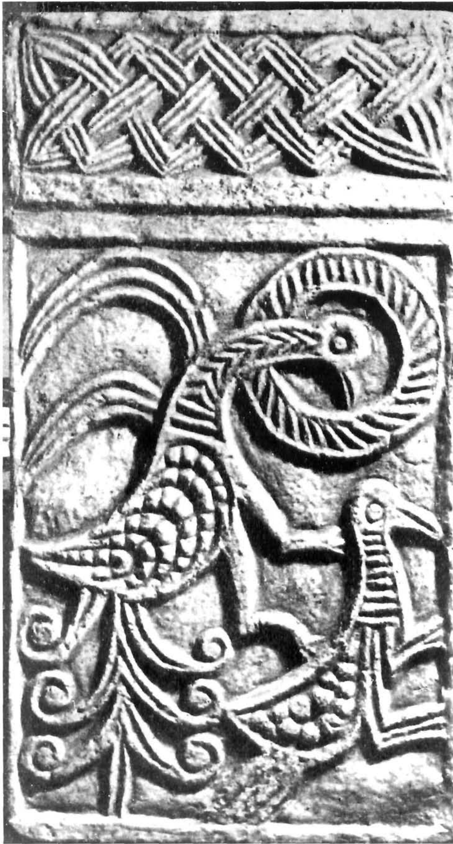
Zavala, plutej Zavala, plutens