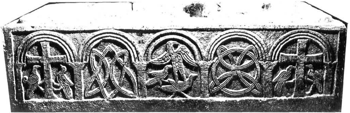
Zadar, sarkofag Zadar, a sarcophagus

rozeta od izdubljenih trokutića, bršljanov list shematiziran rebrima i centralnim trokutićem. 28 Zbog toga će i datacija ovog spomenika morati biti spuštena iz 12. u niža stoljeća predromanike. 29 Ako bi možda izvedba hipotetičnog križa i prostorno izbacivanje luka ukazivali na kraj predromanike, zajedno možda s motivom užeta i profilacijom obruba te ponešto rustificirano modeliranim pletrom, pojava motiva koji nesumnjivo potječu s ranokršćanskih spomenika, a izvedbom su posve predromanički, ukazuje na njihovo postanje.