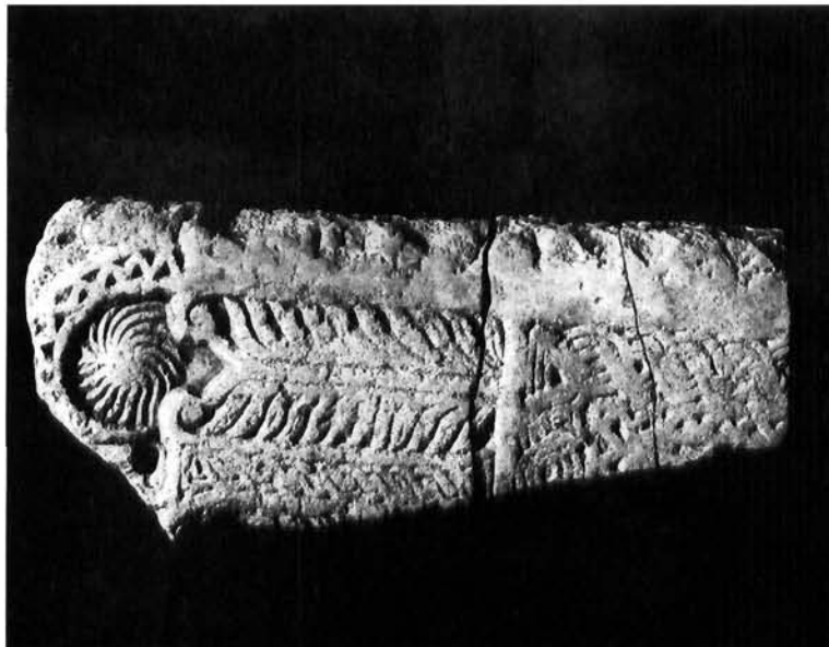
Ulomak arhitrava pronađen u podnici središnjega nadsvođenog prostora Fragment of architrave found in the floor of the central vaulted space