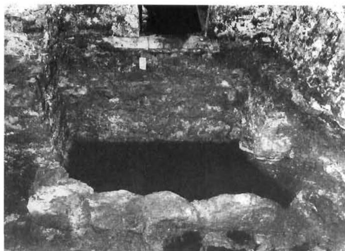
Grobnica br. 3 Grave no. 3

Uz zapadni zid prostora u zoni između temeljnih stopa pilastara pronađena je devastirana grobnica br. 1 smjera sjever–jug. Tipološki grobnica pripada grupi pozzetto grobnica, a vremenski kasnoantičkom periodu s mogućnošću dugog konti-