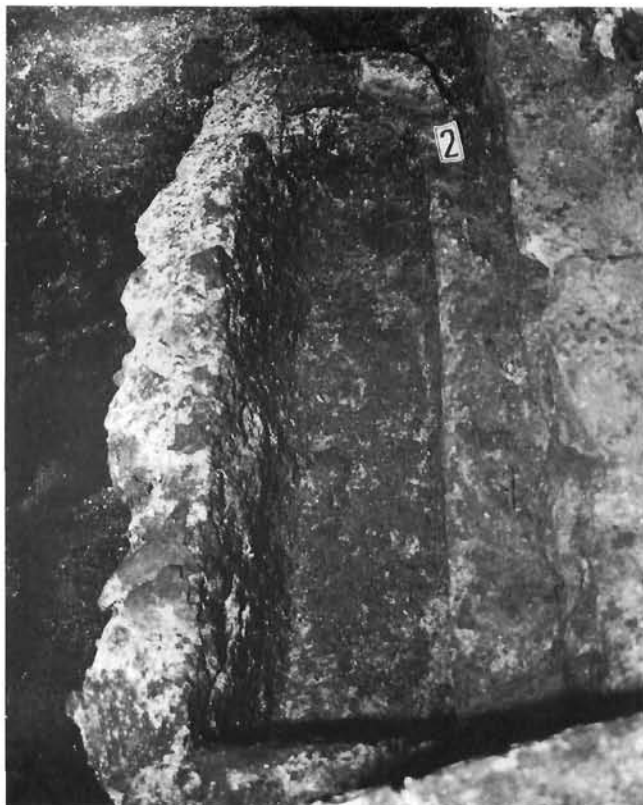
Grobnica br. 2 Grave no. 2