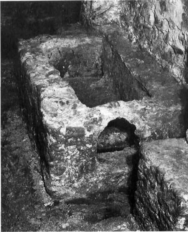
Pronađena struktura u zapadnom dijelu prizemlja Doma Marina Držića Revealed structure in the western part of the ground floor, Home of Marin Držić

nog zida objekta napravljena je od velikih kamenih amorfnih blokova ispod kojih se javlja šut. Zbog statičke ugroženosti objekta istraživanja su rađena uz stalnu suradnju s projektantom statike objekta. Pronađena lučna struktura i zid smjera sjever-jug nagovještavali su da je riječ o još jednom nadsvodenom prostoru, koji je kasnijim građevinskim zahvatima poništen. Ovu pretpostavku još potkrepljuje nalaz središnje lučne strukture, koja vjerojatno predstavlja ostatak središnjeg nadsvodenog prostora, ostatke kojega u istraženom prostoru pokazuje pronađeni zid smjera sjever-jug. Taj zid predstavlja ostatak organske veze dvaju pronađenih nadsvodenih prostora odakle se računaju njihovi lukovi.