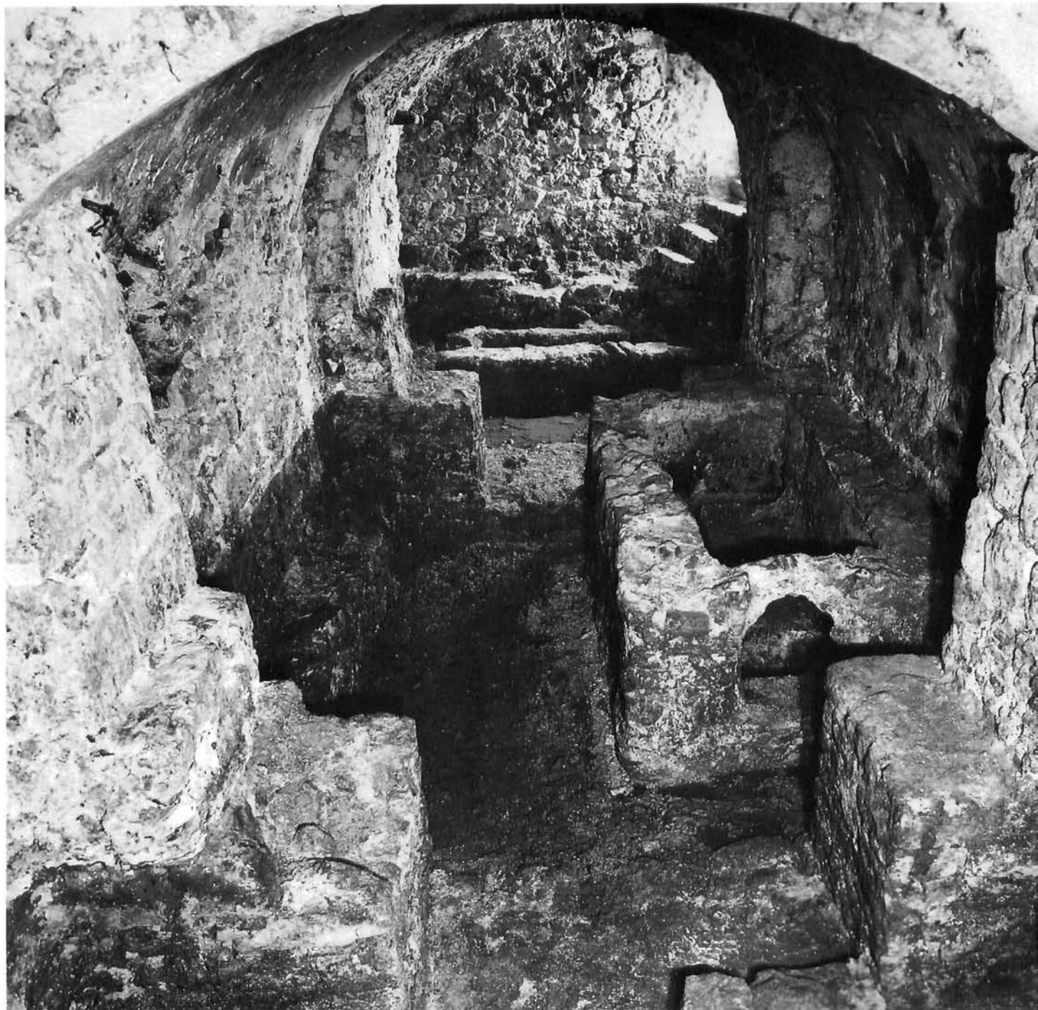
Istočni nadsvođeni prostor Doma Marina Držića, total istraženog dijela Eastern vaulted space of the Home of Marin Držić, total of investigated area