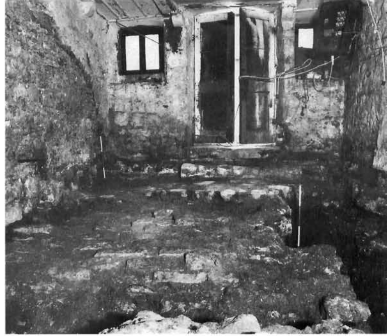
Grobnica br. 1 Grave no. 1

Dakle, zbog pretpostavke temeljene na materijalnim dokazima dogovoreno je da se prvo pronađe istočna temeljna stopa zapadnoga nadsvodenog prostora te da se tek onda definira dubina novog temeljenja, kako bi se izbjegla greška koja bi imala negativne posljedice na cjelovitu prezentaciju nadsvodenih prostora, koji kontinuiraju ispod barokne crkve Domino, a izvan su dogovorene zone zaštitnih arheoloških istraživanja. Istraživanja su obuhvatila i područje sjevernog prilaza. Na koti 2,5 metra pronađena je istočna temeljna stopa zapadnoga nadsvodenog prostora, koja kontinuirava do kote 1 metra, dok je na koti 0,90 metra pronađen gust sloj pijeska. Na navedenoj koti ugroženi sjeverni zid objekta poduhvaćen je betonskim zidom, koji je izvođen u dvije etape zbog statičke ugroženosti objekta. Na istim je kotama pronađena temeljna stopa zapadnog zida nadsvodenog prostora. Tijekom ovih radova utvrđeno je da se istočni i zapadni zid zapadnoga nadsvodenog prostora protežu do južnog temeljnog zida barokne palače Giorgi-Mayneri, koji ih prekida. Potrebno je naglasiti vrlo teške uvjete rada, koje je otežavala voda što se pojavila na visini od 2 metra od nivelete prizemlja.