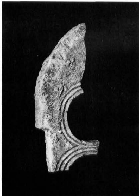
Ulomak tranzene pronađen u istočnome nadsvođenom prostoru Fragment of the transom found in the eastern vaulted space