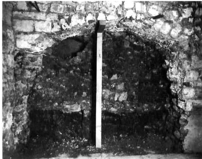
Središnji nadsvodeni prostor Central vaulted space