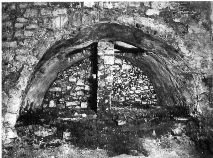
Zapadni nadsvodeni prostor Northern vaulted space