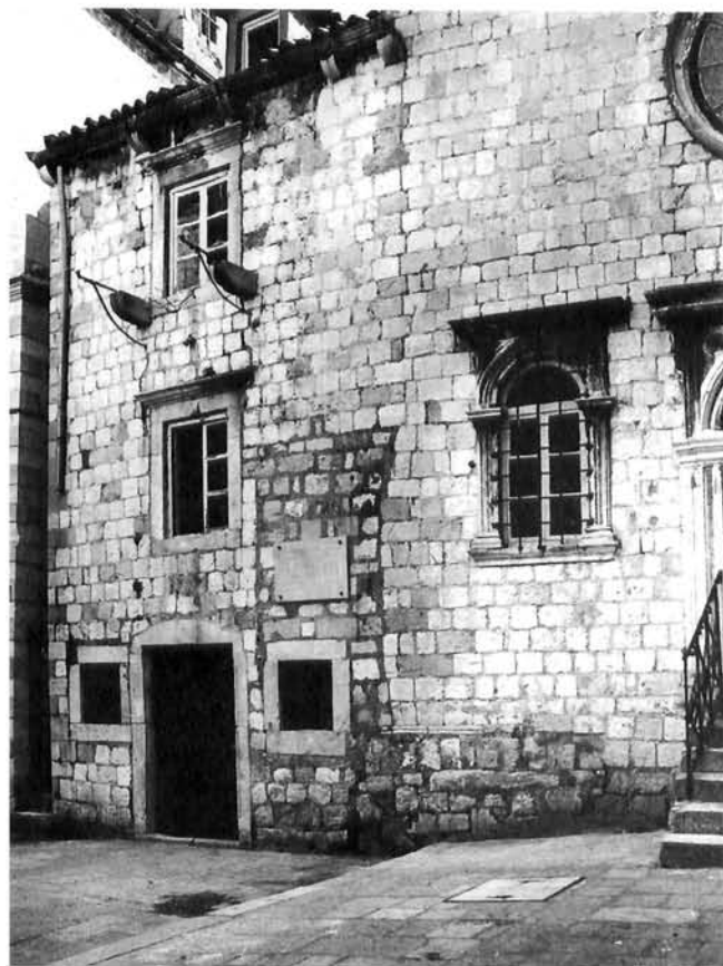
Dom Marina Držića, zapadno pročelje The Home of Marin Držić, western facade

Uklanjanjem žbuke s južnog zida prizemlja pronađene su dvije lučne strukture zidane u tupini. Zapadni fasadni zid objekta položen je na pronađenu zapadnu lučnu strukturu