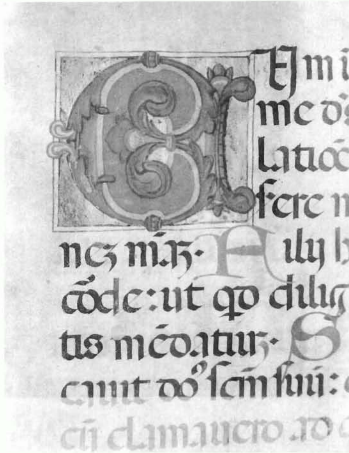
Psalterij, XV. stoljeće, f 66r, inicijal »C«-um invocarem... Psalter, 15th century, f 66r, initial »C«-um invocarem...

pjeva više osoba. Kodeks je manjkav i na početku i na kraju, tako da ne znamo koliko je izvorno imao listova.