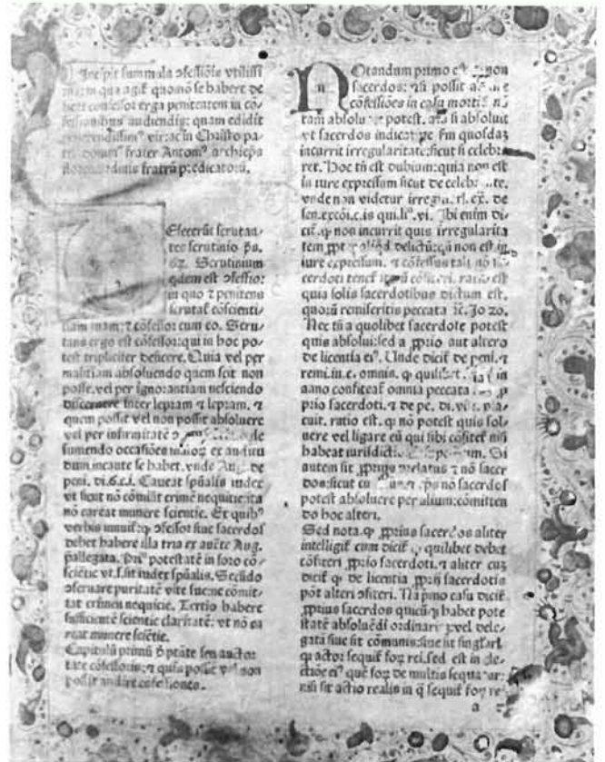
Inkunabula, Summa confessorum »Defecerunt«, naslovna stranica Inkunabulum, Summa confessorum »Defecerunt«, front page

Iako umjetnička vrijednost ovog kodeksa nije osobito visoka, ovdje ga donosimo zbog dva razloga. U prvom redu jer je to primjer rukopisnih koralnih knjiga daleko nakon pronalaska tiska, a i zato jer je to jedan od rijetkih potpisanih i datiranih kodeksa. Kako stoji na dnu naslovne stranice, napisao ga je i Bogu posvetio fra Antun Seghet (ili iz Segeta) 1736. (»F. Antonius Seghet scrip. et Deo O. M. dedicavit«, »MDCCXXXVI«) (sl. 5).