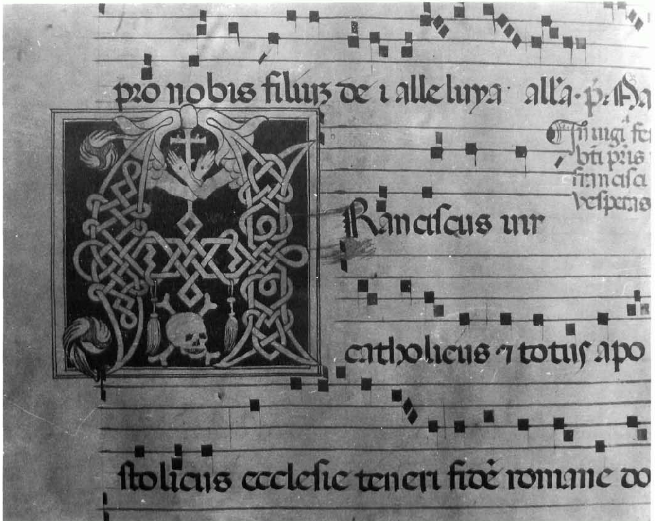
Isto, f 51v, inicijal »F«-ranciscus... The same, f 51v, initial »F«-ranciscus...

Veličina stranice je 380 x 535 mm, a veličina ispisano dijela stranice 250 x 380 mm. Dakle, visina ispisano dijela stranice jednaka je širini stranice, a odnos stranice i teksta je 2:1, što je uobičajen kanon za koralne knjige.