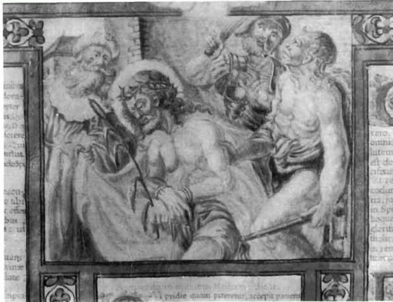
Vrboska, kanonske tablice, XVIII. stoljeće, detalj Vrboska, canon tables, 18th century, detail

I l u m i n a c i j e se sastoje od inicijala (Littera ferialis), od kojih su jedni (kojima počinju pojedini blagdani) dvobojni, crvena i plava boja sa zubčastom granicom, sa crveno-plavom grafijskom ornamentikom unutar i oko slova. Druga vrsta inicijala (kojima počinju pojedini reci) jednostavna su crvena i plava slova, naizmjenice, sa sitnim grafijskim ornamentom.