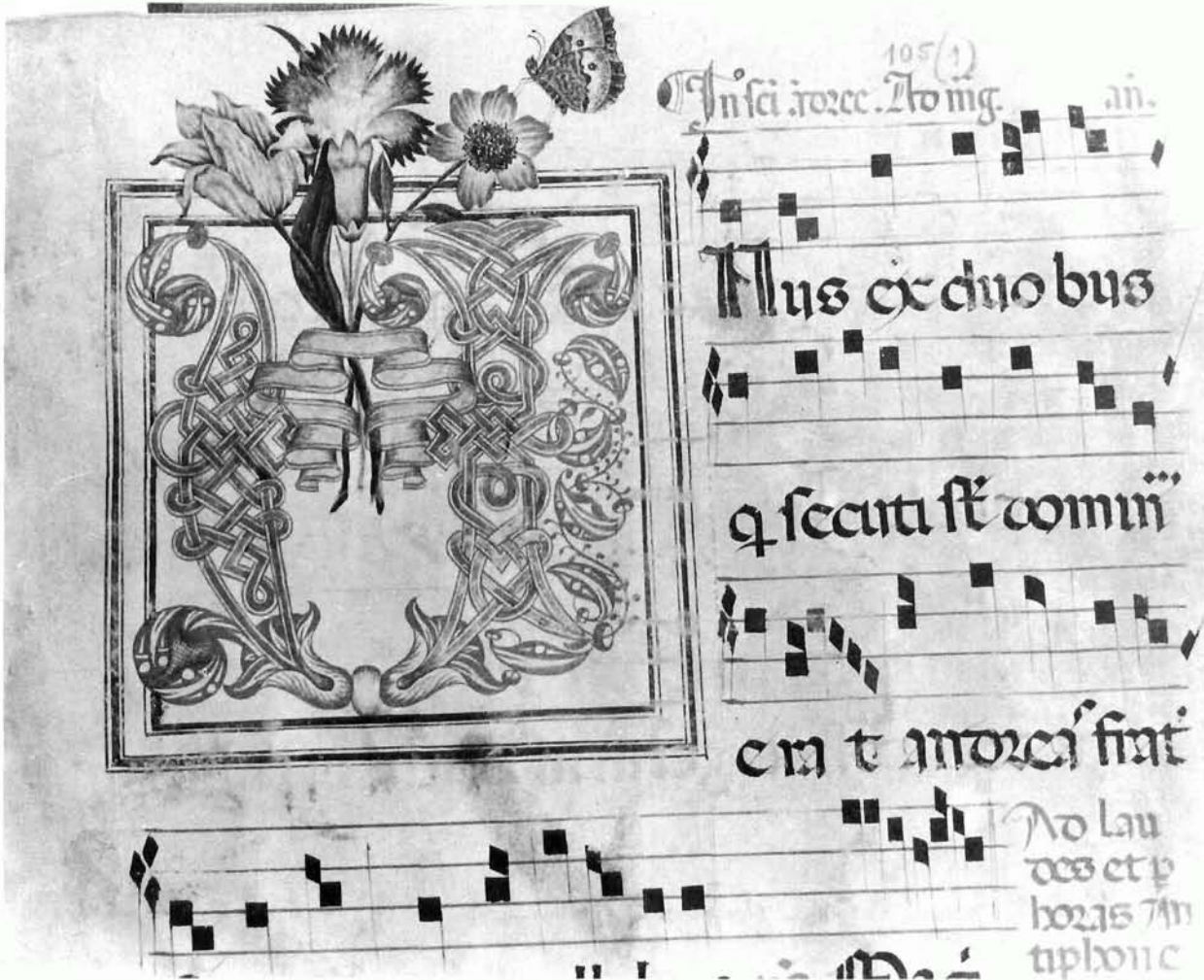
Gradual, Kirial, Antifonal, XV. + XVII. stoljeće, f 1r, inicijal »U«-nus ex duobus... Gradual, Kyrial, Antiphonal, 15 + 17 century, f 1r, initial »U«-nus ex duobus...

Iluminacija ovog kodeksa možemo prema veličini i kvaliteti podijeliti u tri vrste.