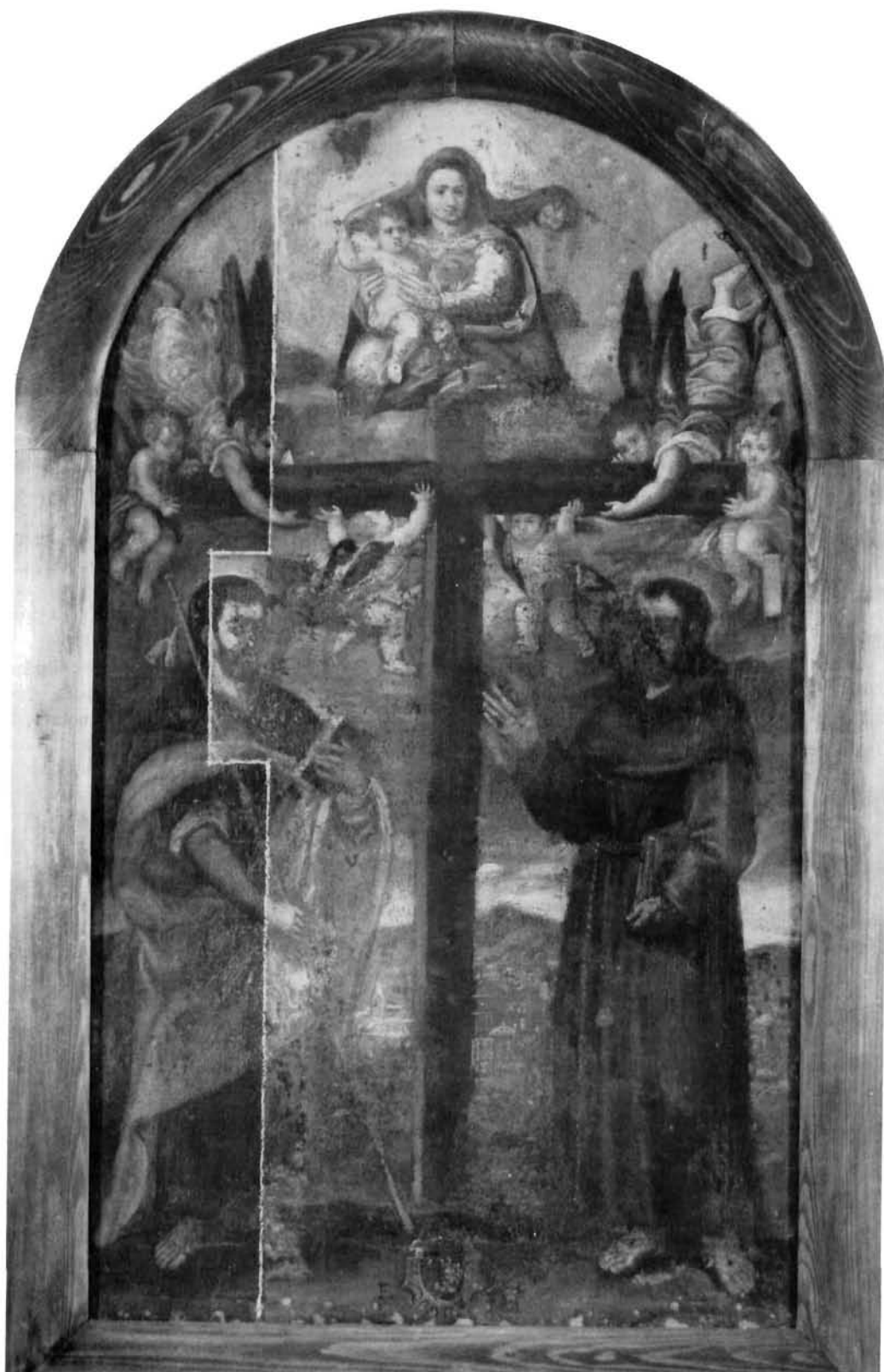
Moreschi, Bogorodica i sveci, Vodnjan. Zbirka crkvene umjetnosti Moreschi, Virgin and Saints, the Church Art Collection, Vodnjan