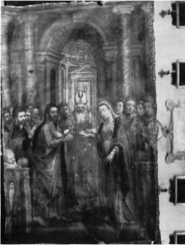
Moreschi, Bogorodičine zaruke, Labin, crkva Uznesenja Marijina Moreschi, Betrothal of the Virgin, the church of the Assumption of Mary, Labin