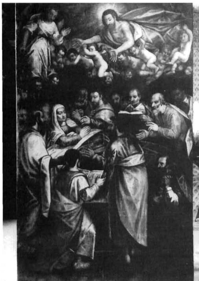
Moreschi, Bogorodičina smrt, Labin, crkva Uznesenja Marijina Moreschi, Death of the Virgin, the church of the Assumption of Mary, Labin