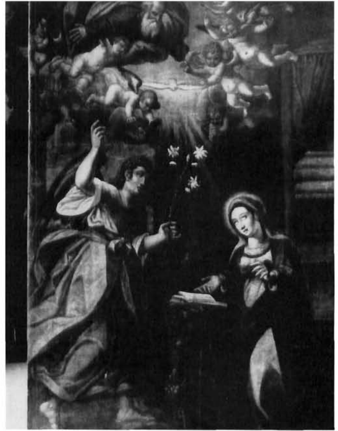
Moreschi, Navještenje, Labin, crkva Uznesenja Marijina Moreschi, Annunciation, the church of the Assumption of Mary, Labin

vito slikarstvo, dobiva posebnu ulogu u toj borbi – baš zato što ona koja je čini pobjednicom nad herezom protestantizma, 16 a što je u našem slučaju, s obzirom na blizinu Slovenije i sjeverne Istre u kojima taj pokret bijaše uzeo maha, vrlo značajno.