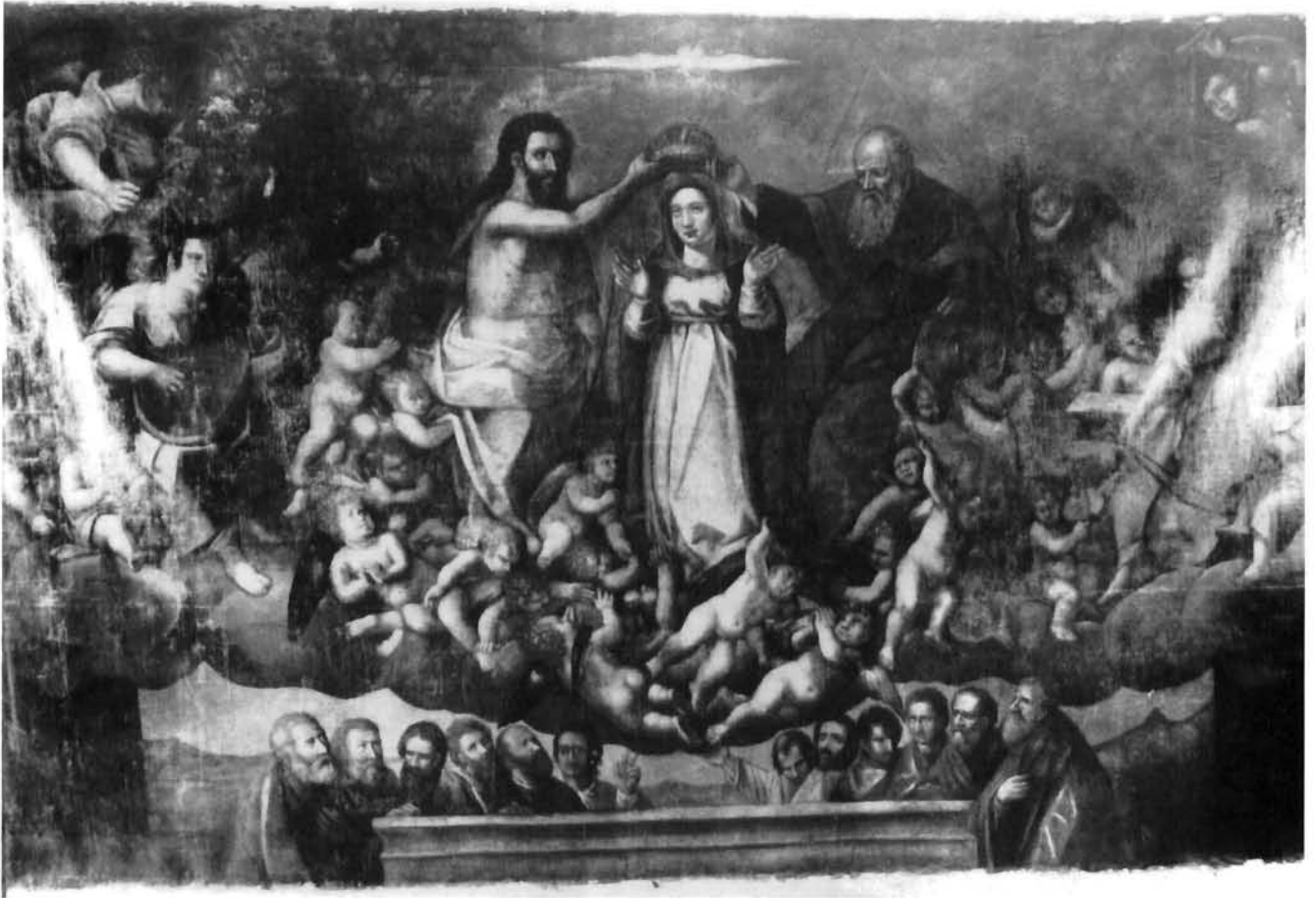
Moreschi, Uznesenje i krunjenje Bogorodice, Labin, crkva Uznesenja Marijina Moreschi, Assumption and the Coronation , the church of the Assumption of Mary, Labin