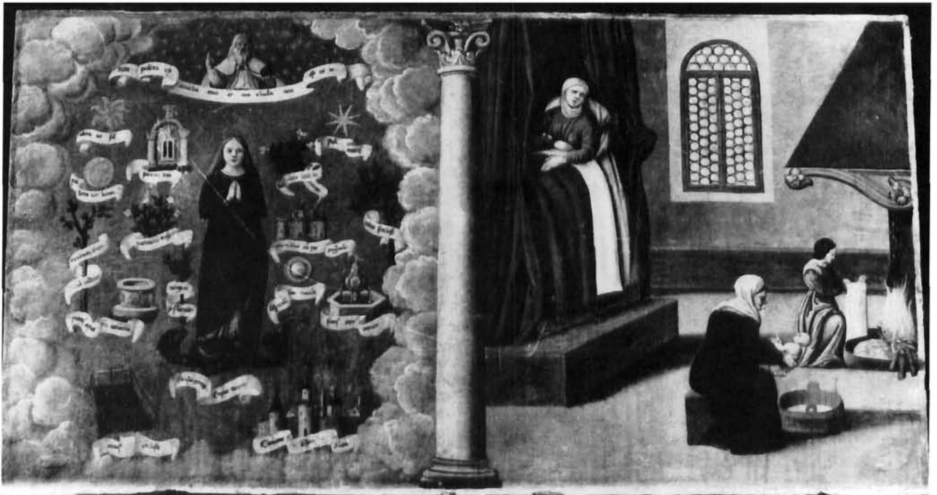
Girolamo da Santacroce, Bezgrešno Začeće i Rođenje Bogorodičino, Košljun, franjevačka crkva, predela na poliptihu Girolamo da Santacroce, Immaculate Conception and Birth of the Virgin, predella on the polyptych, the Franciscan church, Košljun