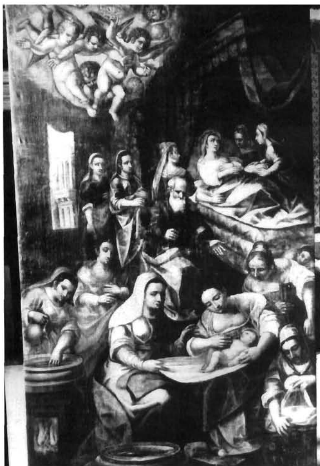
Moreschi, Rodenje Bogorodičino, Labin, crkva Uznesenja Marijina Moreschi, Birth of the Virgin, the church of the Assumption of Mary, Labin