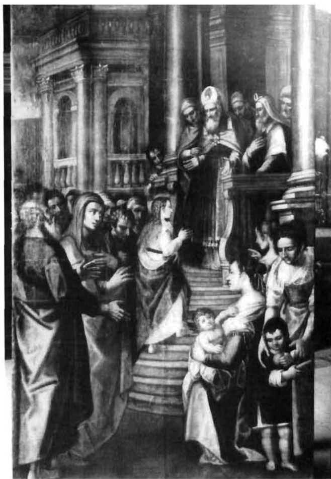
Moreschi, Prikazanje Bogorodice u Hramu, Labin, Crkva Uznesenja Marijina Moreschi, Presentation of the Virgin at the Temple, the church of the Assumption of Mary, Labin

Paradiso , na kojem je bilo prikazano Bogorodičino krunjenje okruženo nebeskom svitom i flankirano likovima Gabrijela i Bogorodičina navještenja. Budući da se nalazila odmah iza duždeva sudišta, zidna je slika imala očigledno političko značenje. Zaključak je bio jasan: PARADISO, U KOJEM JE BOGORODIČINO KRUNJENJE BILO JUKSTAPONIRANO NAVJEŠTENJU, PREDSTAVLJAO JE VIZUALNU METAFORU ZA UTEMELJENJE, TRIJUMF I PROSLAVU VENECIJE... Niti jedan Venecijanac... nije mogao previdjeti bogate asocijacije, ni političke ni duhovne, Bogorodice u Veneciji, isto kao niti poistovjećivanje jedne s drugom. 12