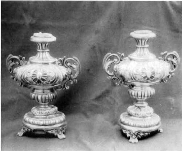
Smokvica (otok Korčula), vaze, druga polovica 19. stoljeća Smokvica (Korčula), vases, second half of the XIX C.