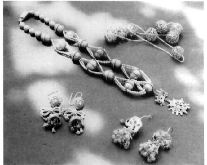
Smokvica (otok Korčula), »Gospino zlato« – ogrlice, naušnice Smokvica (Korčula), »Our Lady's gold« – necklaces, earrings

cvijeta. Oblik, ukrasi i izvedba kaleža su kasnogotički. Moguće ga je pripisati boljoj domaćoj radionici 15-16. stoljeća.