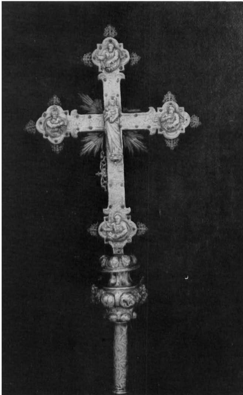
Smokvica (otok Korčula), ophodno raspelo II, Mleci, početak 18. stoljeća Smokvica (Korčula), processional crucifix II, Venice, early XVIII C.