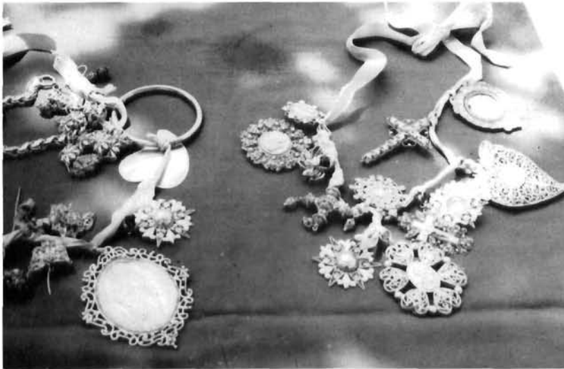
Smokvica (otok Korčula), »Gospino zlato« – privjesci Smokvica (Korčula), »Our Lady's gold« – pendants

Opis: zaobljeno podnožje krasi naizmjenični glatki i lisnati pojasevi, a završava okomito postavljenim žljebastim dijelom. U držak je utaknuta ploča moćnika, a strana su na njoj dvije C-volute ukrašene lišćem, a središnji ostakljeni otvor okružuje niz polukuglica. Nad svime je reljefni školjkasti list i križ okružen kosim vijencem. Ovo zlatarsko djelo 19. stoljeća, vješto i bogato izvedeno u neobaroknom slogu, vjerojatno je također uvezeno iz većeg središta.