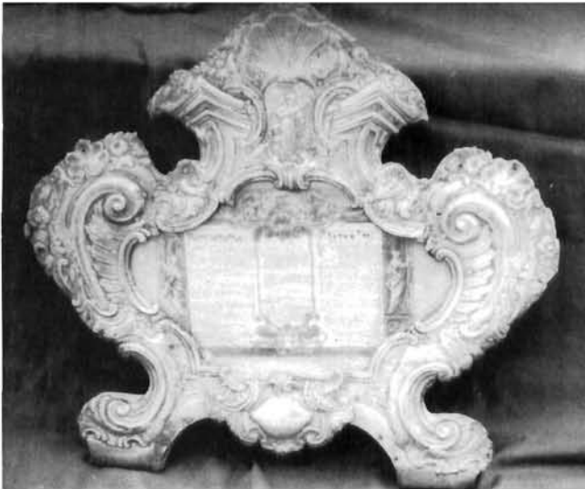
Smokvica (otok Korčula), kanonska ploča I, Mleci, 18. stoljeće Smokvica (Korčula), canon-plate I, Venice, XVIII C.

Velika, središnja ploča, visina 40 cm, širina 29 cm. Okvir je pravokutan, blago s valovitim stranama. Ispunjava ga reljefni, lisnato-cvjetni vijenac, odnosno grana. U sredini gore i dolje te u uglovima po jedan je veliki cvijet poput tulipana i male posebno rađene i pričvršćene andeoske glave.