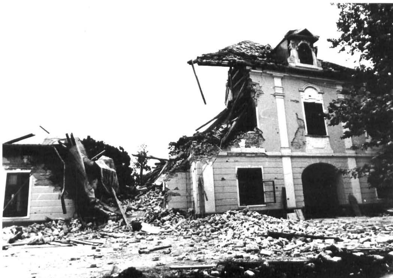
Vukovar, dvorac Eltz, ulaz u dvorac i dvorišno krilo nakon razaranja Vukovar, the Eltz Castle, entrance and the courtyard wing after the destruction