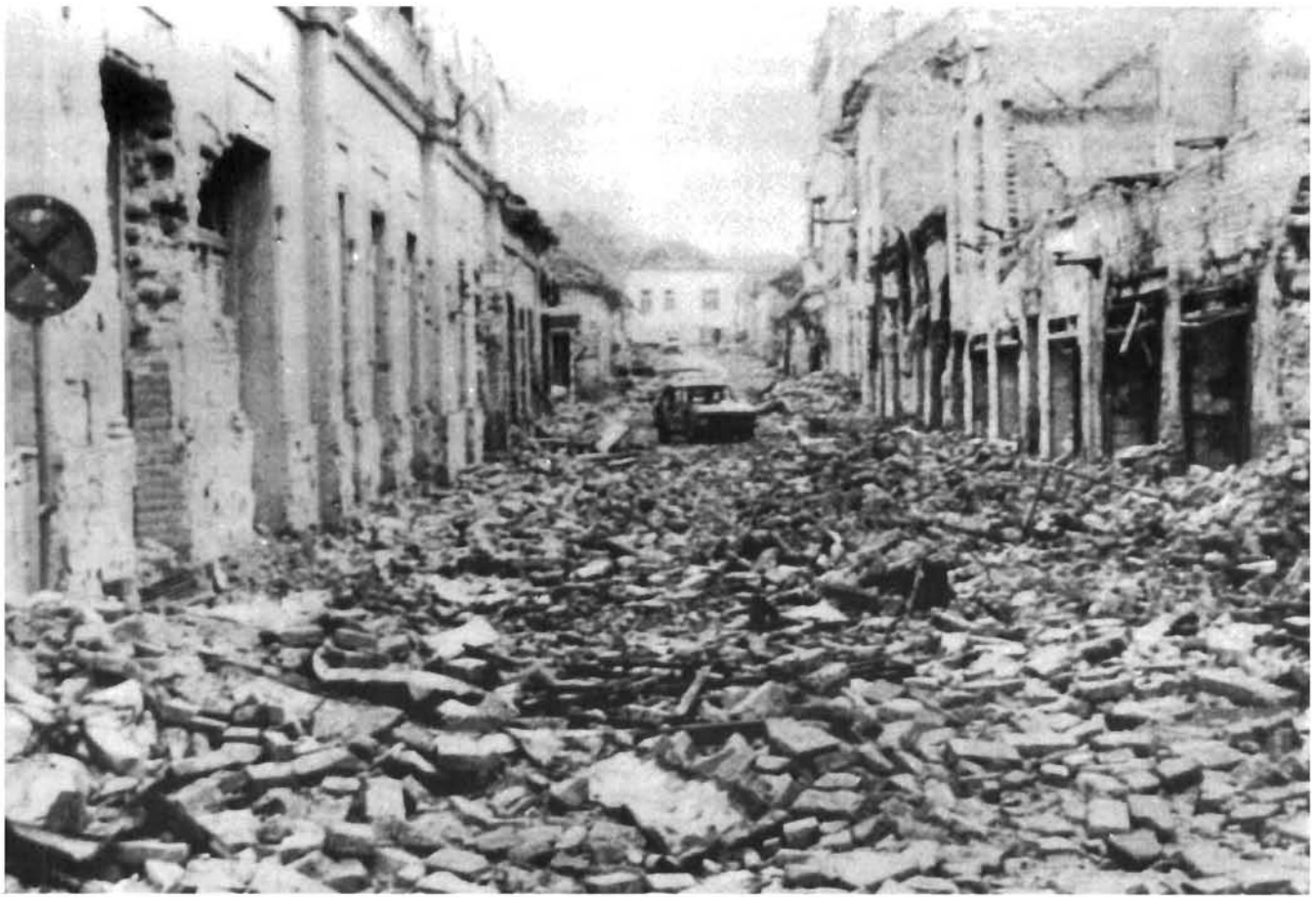
Vukovar, središte grada u jesen 1991. Vukovar, center of the town, autumn 1991

Slučaj Voćina, malog, danas potpuno razrušenog naselja u zapadnom dijelu Slavonije, u tom je smislu još indikativniji. Svoju nesretnu povijest u ovom stoljeću Voćin duguje istim razlozima koji su doveli do njegova konačnog, gotovo potpunog uništenja. Nakon tri rata mjesto je ostalo bez svojih povijesnih spomenika koji su mu davali izraziti identitet i izdvajali ga među susjednim naseljima. Nakon prvoga svjetskog rata 1918. u lokalnoj "mini revoluciji" u znak tadašnjeg ujedinjenja u novu državu srušen je klasicistički dvorac obitelji Janković koji je, zajedno sa svojim velikim parkom, davao osobiti pečat mjestu u romantičnom krajoliku, s planinskim potokom koji teče njegovim središtem. U drugom svjetskom ratu spaljena je kasnogotička crkva sv. Marije, najvažniji povijesni spomenik Voćina, gotovo su posve nestale ruševine srednjovjekovnog kaštela koje su stajale visoko na vrhu brijega iznad naselja, a sada je nestala i sva stambena i ostala starija arhitektura samog naselja.