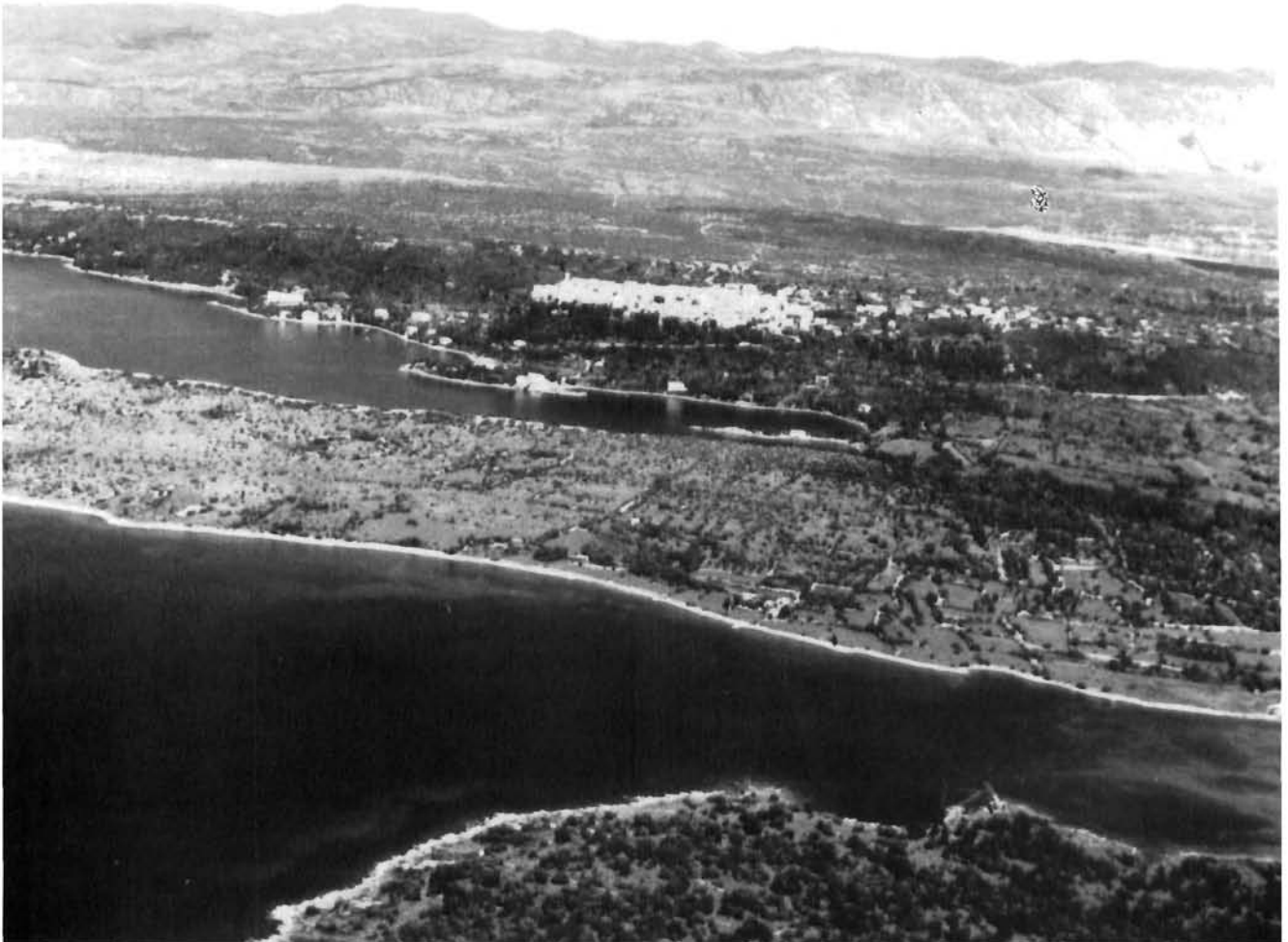
Grad Omišalj. U prednjem planu lokalitet »Okladi« na kojem se nalazio antički Fulfinum. Fotografija iz vremena prije izgradnje petrokemijskog postrojenja

The town of Omišalj, aerial view from the SW. The position of the Roman town Fulfinum, i.e. the site »Okladi«, can be seen at the bottom of the picture. The photo was taken before the construction of a nearby petrochemical complex