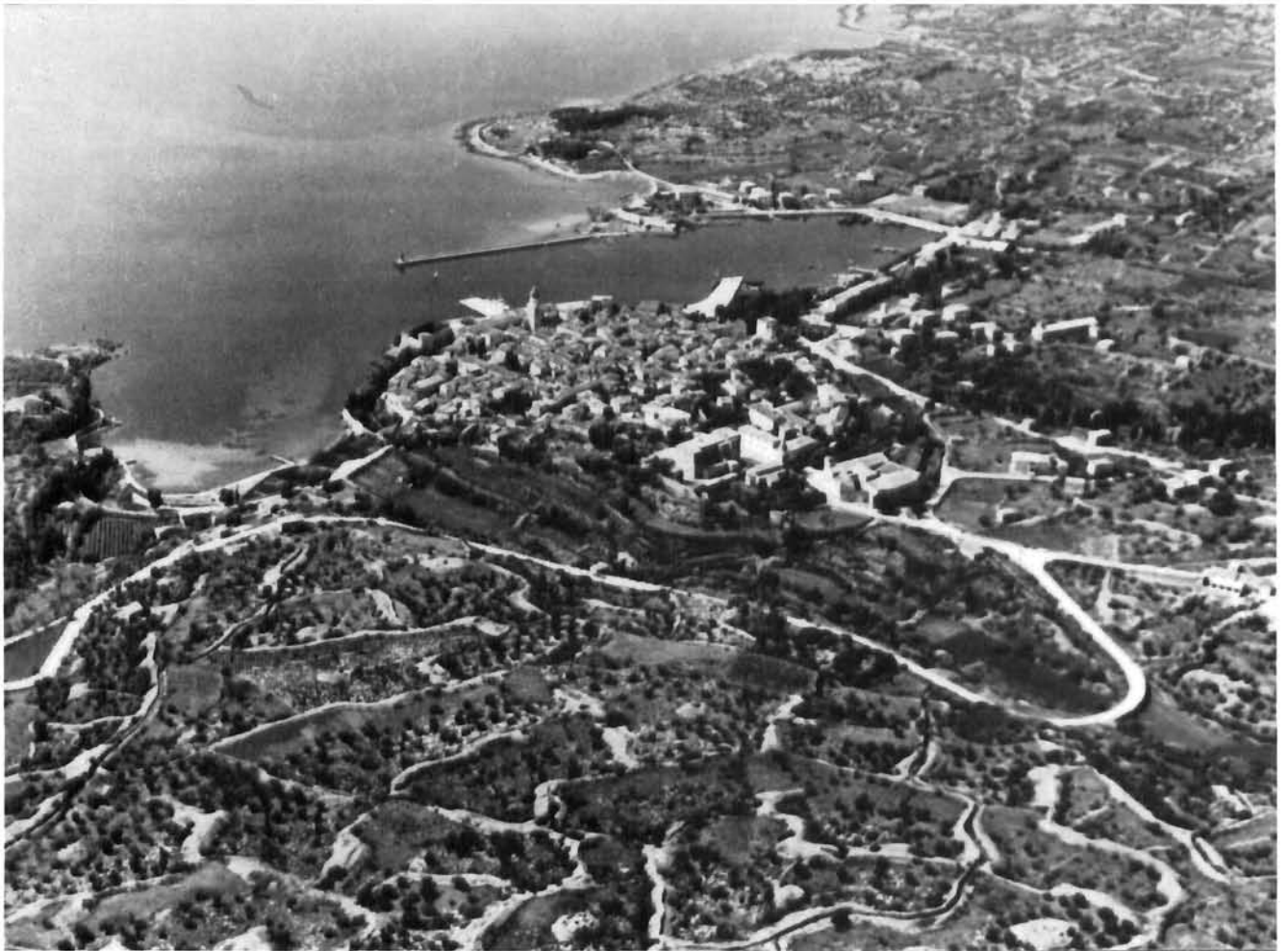
Grad Krk, pogled iz zraka sa sjeveroistoka. Fotografija je snimljena sredinom 20. st., prije početka intenzivne urbanizacije na prostorima izvan povijesne jezgre The town of Krk, aerial view from the NE. The photo, dating from the mid-20th century, was taken before the intensive urban development of the areas surrounding the historic town-site