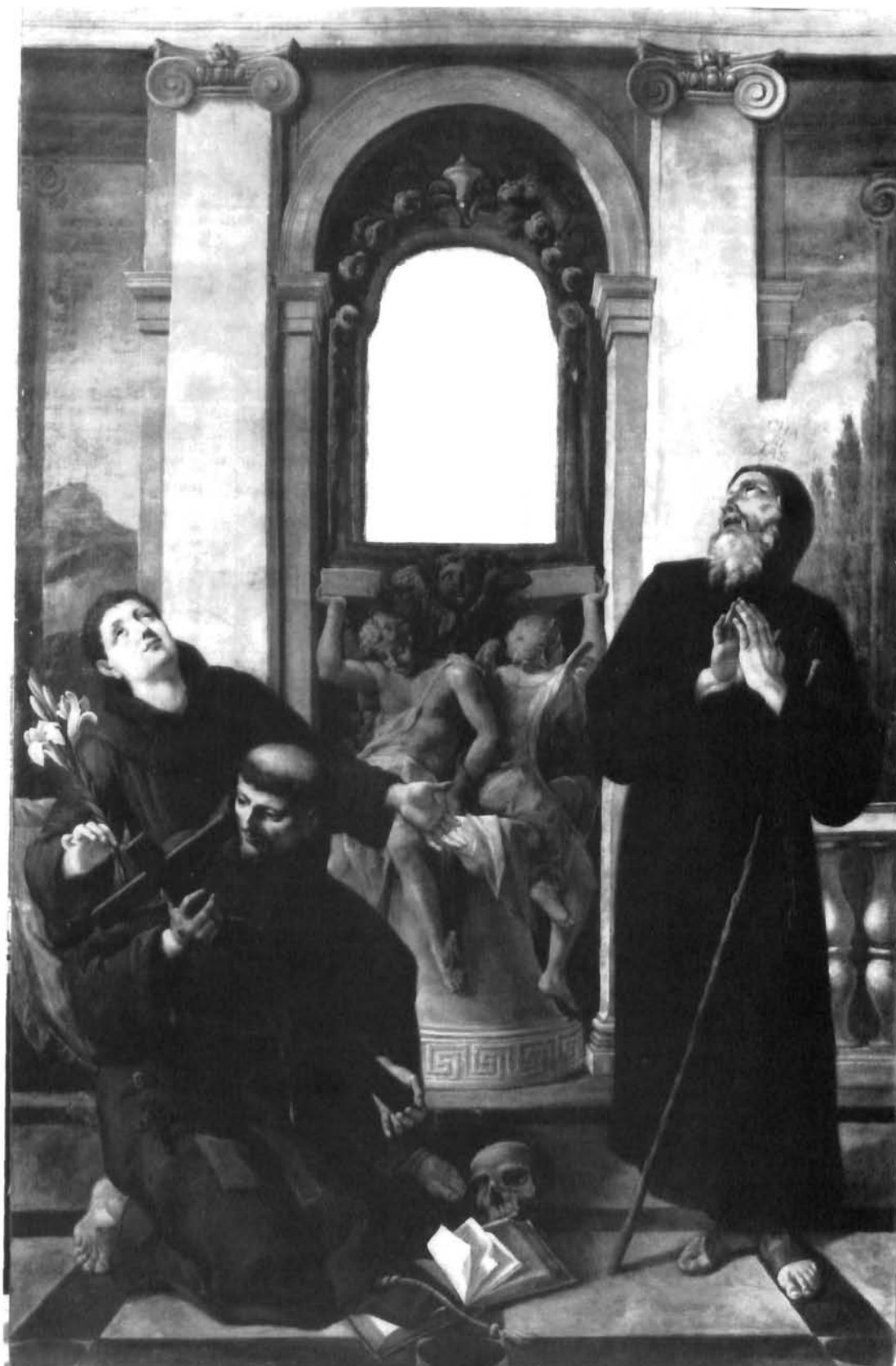
G.B.A. Pitteri, Oltarna pala obitelji Garanjin u katedrali u Trogiru G.B.A. Pitteri, altar pala of the Garanjin family in the Trogir cathedral