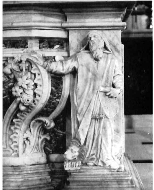
Murter, sv. Ćiril, glavni oltar Murter, main altar, St. Cyril

prodati staru srebrninu bratstva da bi se podmirila dugovanja za isplatu oltara. 15