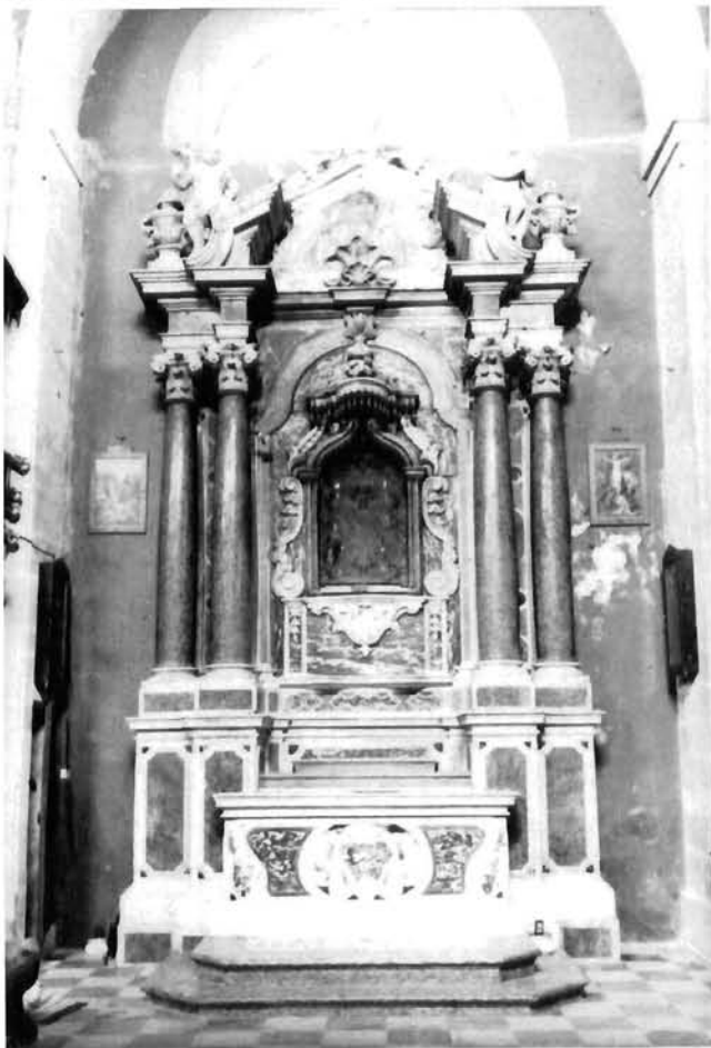
Vicko i Pio Dall'Acqua, Skradin, katedrala, bočni oltar Vicko and Pio Dall'Acqua, Skradin, cathedral, side altar

vijenci voća. Na atiku su ukomponirani Golubica Duha Svetoga i dvije andeoske glavice na oblacima, u vrhu dva anđela nose kalež, a iz baldahina se spušta zavjesa optočena resama na obje strane slike Nikole Vladanova s prikazom Bogorodice s Djetetom. U gornjem dijelu zavjesa je usukana u čvorove uz koje lebde obnaženi anđeli, a druga dva anđela rukama pridržavaju sliku Bogorodice. Konvencionalan tip oltara s kraja 18. stoljeća Dall'Acqua su znalački ukrasili u svim zonama: na stipesu, retablu iatici uspješno uspostavivši ravnotežu. Naglasak na gotičku sliku, za koju je oltar i podignut, uspostavljen je upotrebom raznobojnog mramora. Središnja je niša od bijelog mramora omeđena crvenim stupovima, a slika je zaokružena zavjesom i podupirana anđelima.