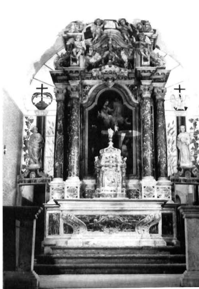
Vicko i Pio Dall'Acqua, Betina, glavni oltar Vicko and Pio Dall'Acqua, Betina, main altar

Istovjetno je riješen i oltar Gospe Sinjske, koji su franjevci iste provincije u svome glavnom prošteništu dali podići i posvetiti 1795. godine. Na njemu je čudotvorna slika Gospe Sinjske. Njezin se kult naglo proširio u 18. stoljeću, najprije u Sinjskoj krajini a potom i u cijeloj srednjoj Dalmaciji. Po tradicijskom vjerovanju to je ona slika s kojom su pred Turcima bježali franjevci i kršćani iz Rame u Sinj. Svojim je božanskim zagovorom i moći pomogla oslobođenje Sinja od Turaka 1715. godine, postavši zaštitnicom grada i krajine. S vremenom se štovanje Gospe Sinjske proširilo u Dalmaciji, pa je to postalo jednim od središnjih hodočasničkih ciljeva puka dalmatinske Hrvatske u postturskom razdoblju.