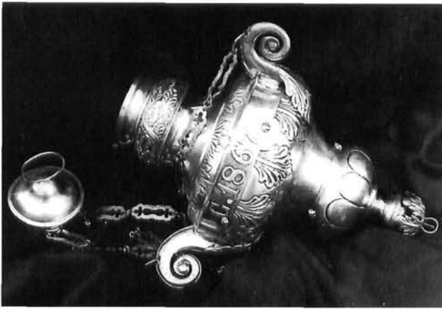
Viseća svjetiljka iz župne crkve Sv. Marije Mandaljene u Mandaljeni

Hanging Lamp from the parish church of Saint Blaise in Ston