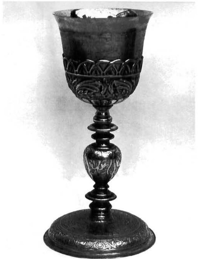
Ladica za tamjan i kalež iz župne crkve Sv. Vlaha u Stonu Boat-Shaped Incense Burner and Chalice from the church of Saint Blaise in Ston