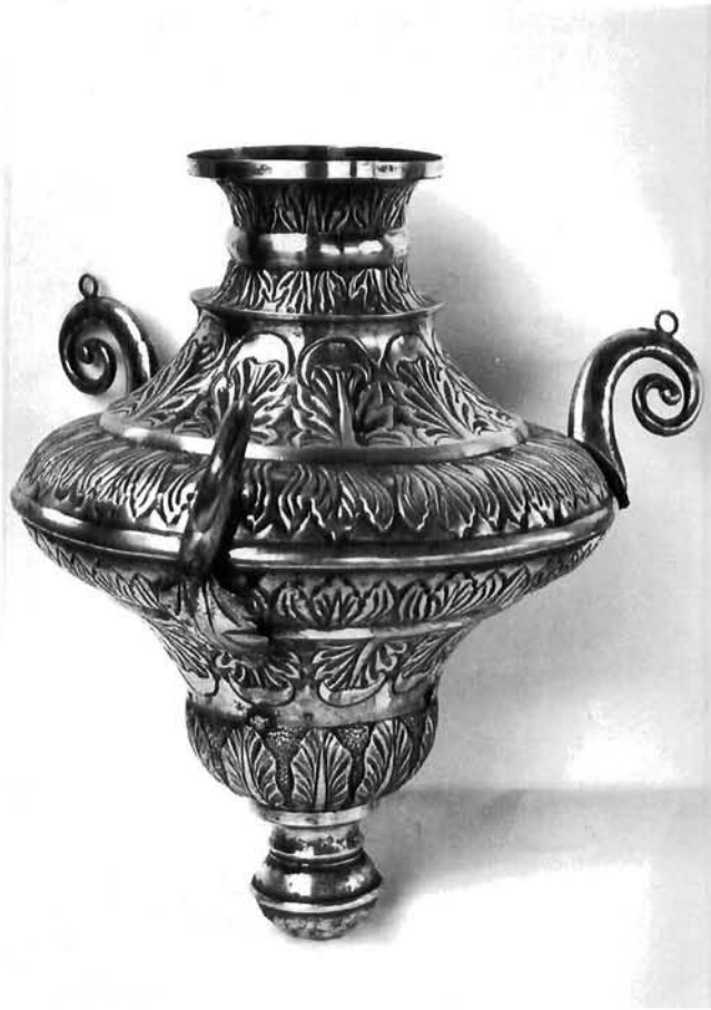
Viseća svjetiljka iz crkve Sv. Antuna Opata u Malom Stonu Hanging Lamp from the church of Saint Anthony Abbot in Mali Ston