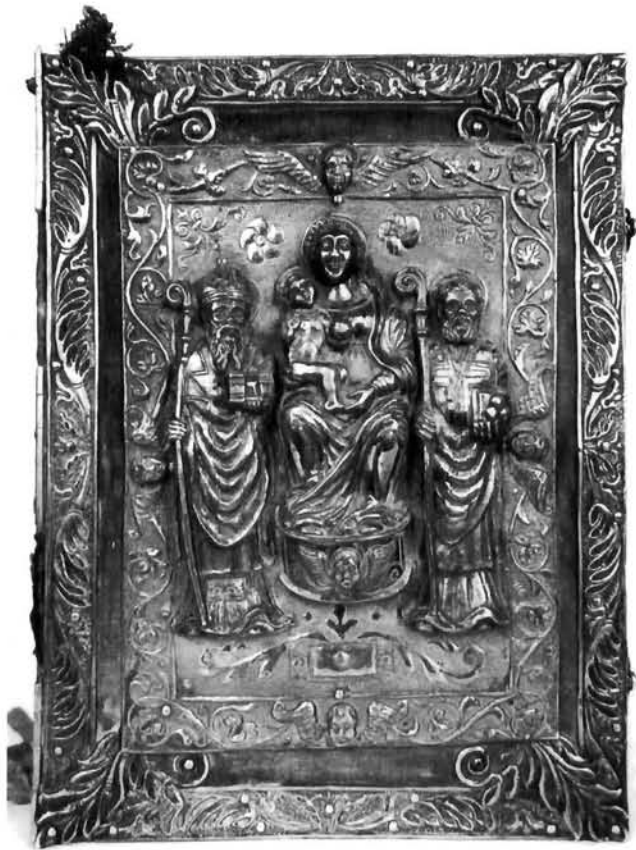
Korice katedralnog misala (rub) iz župne crkve Sv. Vlaha u Stonu

Covers of Cathedral Missal (the borders) from the church of Saint Blaise in Ston