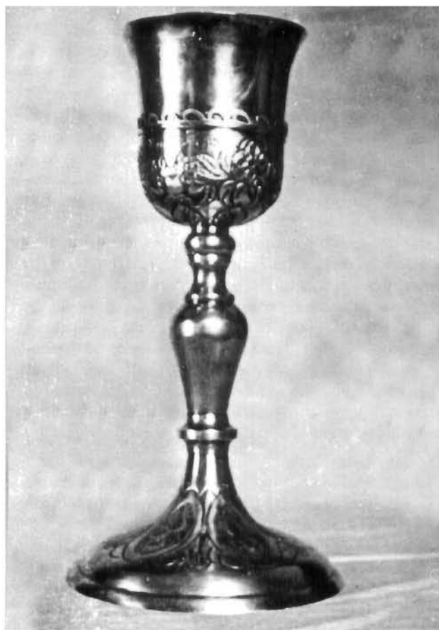
Kalež – župna crkva u Orebiću Chalice. Parish church, Orebić