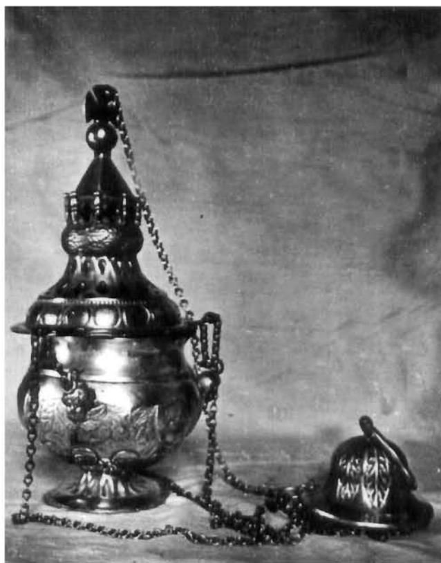
Kadionica – župna crkva u Orebiću Incense Burner. Parish church, Orebić

U crkvenoj riznici čuva se i drugi, nešto skromniji kalež (sl. 1) providen majstorovim žigom na bazi, klasicističkog oblika s dodacima neobaroka, izrađen od lijevanog, iskucanog i djelomično pozlaćenog srebra: visok je 24,5 cm, širina baze