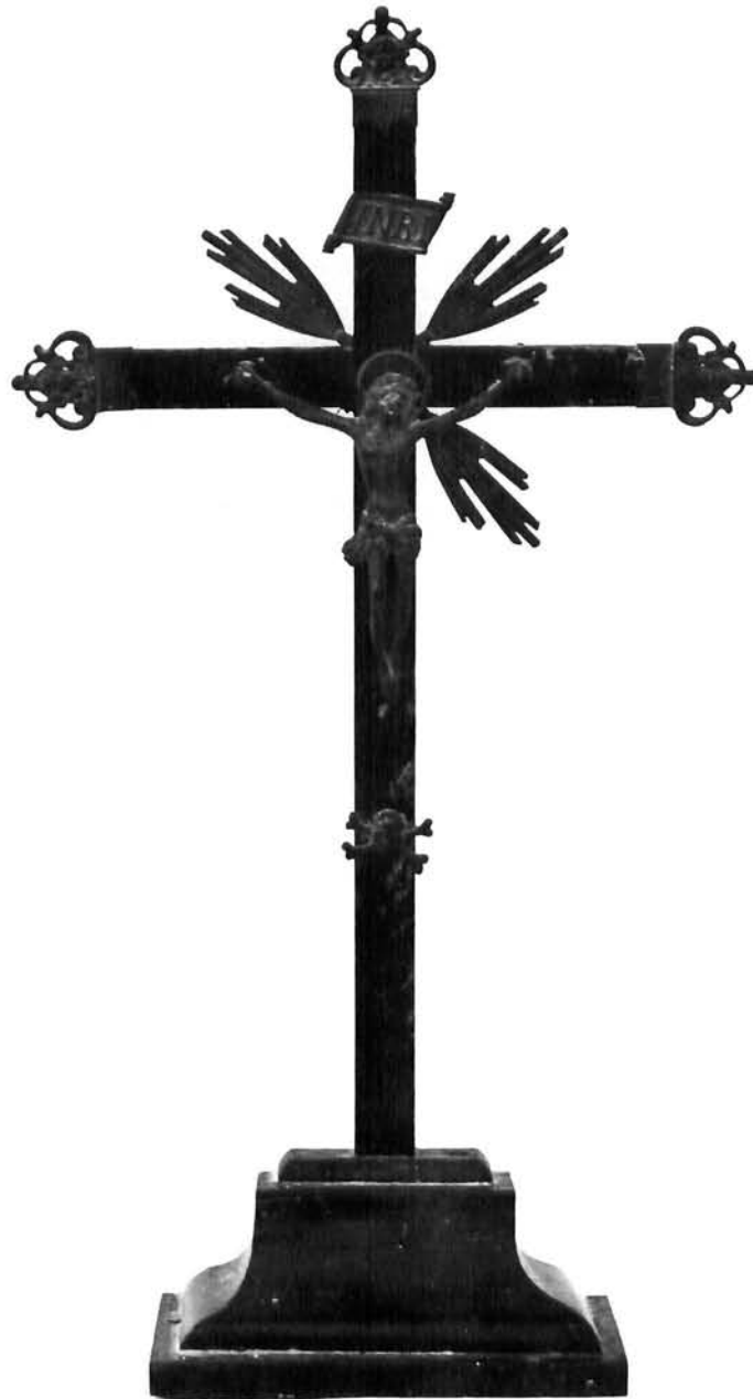
Pacifikal iz Stona Pacificale of Ston