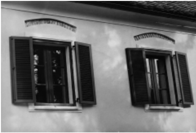
9. Remete, zapadno pročelje gotičkog krila samostana (prezentacija rasteretnih nadvoja baroknih prozora prvoga kata)

9. Remete, west facade of the Gothic monastery wing (presentation of elements on the Baroque windows on the first floor)