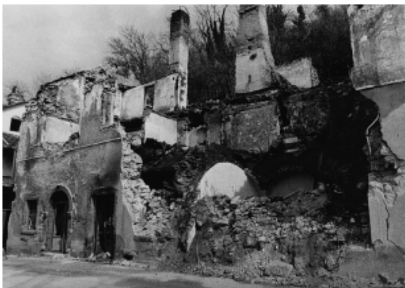
7. Kostajnica, kuća u Ulici D. Trstenjaka 20, snimljena krajem ožujka 1996. 7. Kostajnica, house in 20 D. Trstenjaka Street, photographed at the end of March 1996