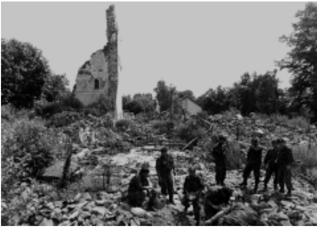
1. Voćin, župna crkva Naša Gospa voćinska, pogled sa zapada na ruševine crkve u lipnju 1995.

1. Voćin, parish church of Our Lady, west view of the ruins, June 1995