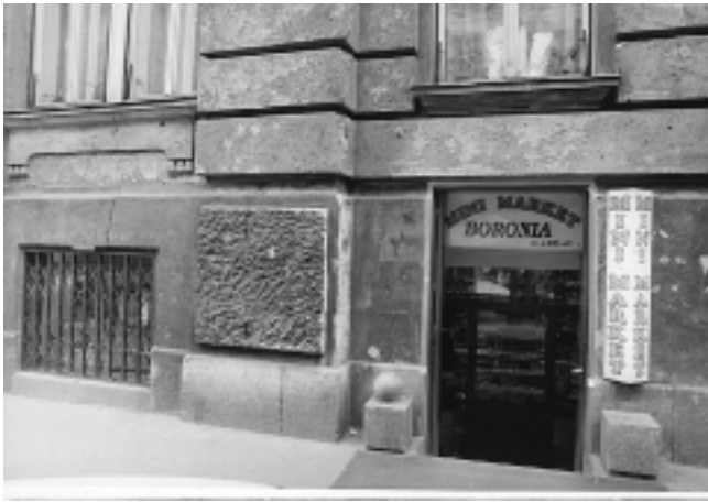
13. Zagreb, Gundulićeva 22, probijena vrata na mjestu podrumskog prozora

13. Zagreb, 22 Gundulićeva Street, a door pierced in place of a cellar window