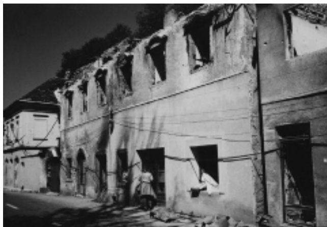
6. Kostajnica, kuća u Ulici D. Trstenjaka 20, snimljena u veljači 1996.