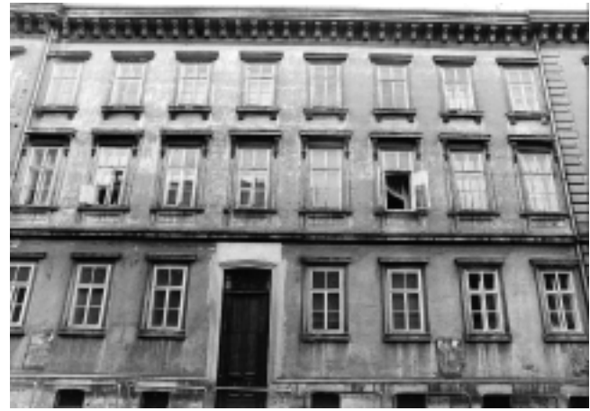
14. Zagreb, Hebrangova 4, probijena vrata na mjestu prozora prizemlja

13. Zagreb, 22 Gundulićeva Street, a door pierced in place of a cellar window