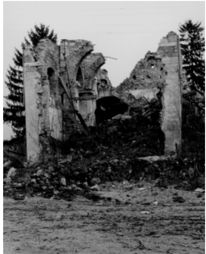
3. Gora, župna crkva B. Dj. Marije, pogled sa zapada na ruševine crkve. Stanje u ožujku 1996.

Sve do početka lipnja 1995. godine, dakle pune tri i pol godine, ništa se nije poduzimalo, 9 a onda su iznenada, »preko noći«, petero ljudi iz tri Zavoda i jedan vanjski suradnik dobili putni nalog za Voćin. Kada se ta po svemu heterogena grupa sastala na terenu 10 i prvo se upoznala međusobno, a onda sa zadatkom, te s onim što se pred njima događalo, mogli su samo utvrditi da su inženjerci Hrvatske vojske veliki dio posla uz svetište crkve već obavili: raščistili su bez pomoći pijuka i lopate veći dio urušenog зида svetišta. Oko 300 ka-