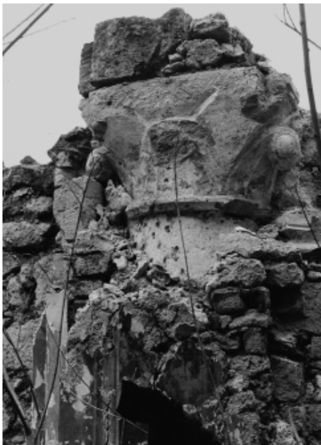
5. Gora, župna crkva B. D. Marije, unutrašnjost svetišta, kapitel ispod baroknog polustupa

5. Gora, parish church of the Blessed Virgin Mary, interior of sanctuary, capital under a Baroque half-column