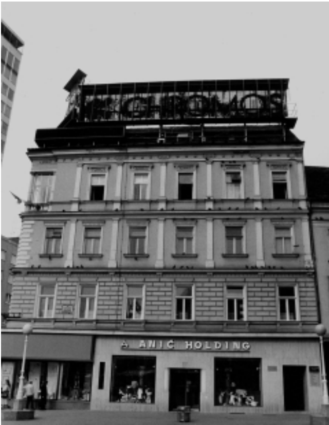
11. Zagreb, »Anić holding«, pogled na pročelje nakon rekonstrukcije prizemlja

11. Zagreb, "Anić Holding", view of facade after reconstruction of ground floor