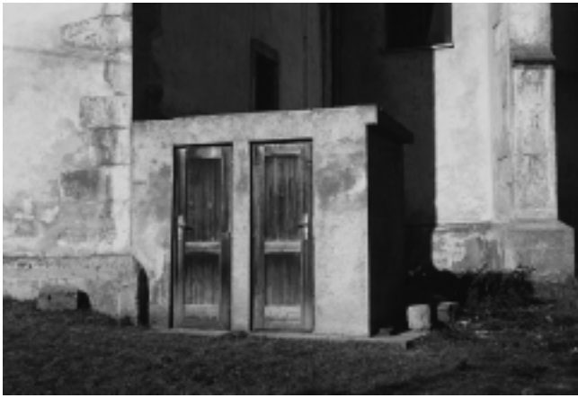
16. Kalnik, župna crkva sv. Brcka, dozidani zahodi na istočno pročelje gotičkog zvonika

16. Kalnik, parish church of St Brcko, toilets added to the eastern facade of the Gothic steeple