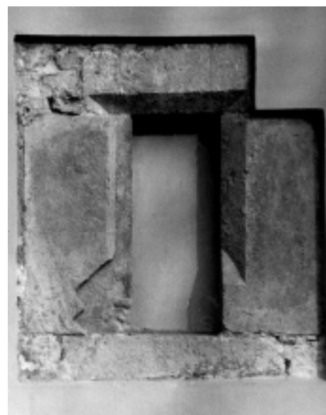
8. Remete, zapadno pročelje gotičkog krila samostana (način prezentacije otkrivenog gotičkoga prozora prizemlja) 8. Remete, west facade of the Gothic monastery wing (presentation of uncovered Gothic window on the ground floor)

da nema čak ni pozitivnih reakcija na izuzetno uspješno obnovljeno naše najbogatije barokno oslikano pročelje, ono nekadašnjeg Samostana klarisa u Opatičkoj ulici, 23 kojim je dodatno oplemenjen prostor Gornjega grada. Takovo ponašanje govori nam o općoj ravnodušnosti prema onome što se događa u najvrednijim gradskim prostorima, što otvara mogućnosti za nove neželjene zahvate na spomenicima kulture.