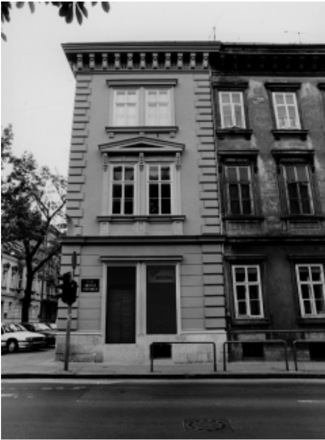
15. Zagreb, Hebrangova 2, prozori prizemlja preoblikovani u izlog 15. Zagreb, 2 Hebrangova Street, ground floor windows adapted for shop display

ti i službeni razgovori predstavnika zakonodavne, izvršne i sudbene vlasti Republike Hrvatske sa stranim državnim i drugim delegacijama, kao i za druga protokolarna primanja . 43 Kao i prvi idejni projekt namjene iz 1990. godine i ovaj je projekt konzervatorima također potpuno neprihvatljiv, budući da bi, kada bi bio ostvaren, uništio značajan dio spomeničkih vrijednosti Velikog Tabora.