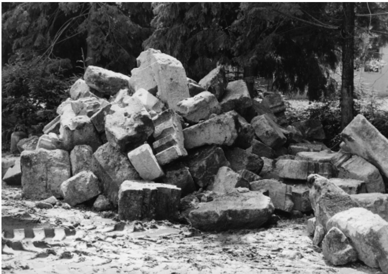
2. Voćin, crkva Naša Gospa voćinska, elementi arhitektonske plastike svetišta snimljeni u lipnju 1995.