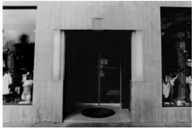
10. Zagreb, »Anić holding«, ulaz u robnu kuću

9. Remete, west facade of the Gothic monastery wing (presentation of elements on the Baroque windows on the first floor)