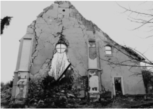
4. Gora, župna crkva B. D. Marije, pogled s istoka na svetište. Stanje u ožujku 1996.

4. Gora, parish church of the Blessed Virgin Mary, east view of the sanctuary. Situation in March 1996