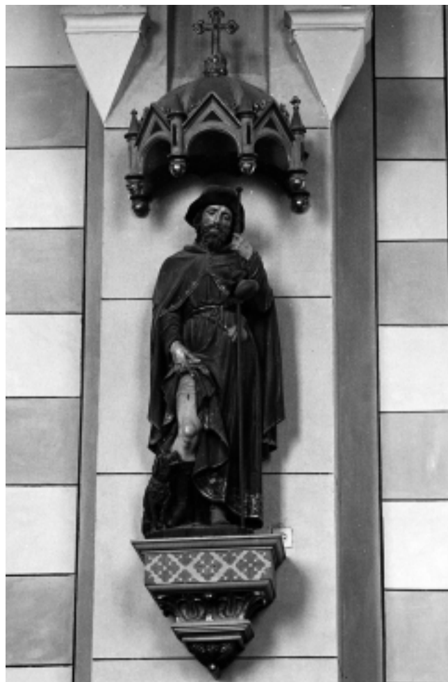
Župna crkva u Molvama: Sv. Rok. Radionica Ferdinanda Stuflessera. St. Ulrich, Tirol

Franciscan Church in Krapina: Saint Apollonia by Ferdinand Prinoth, St. Ulrich, Tyrol