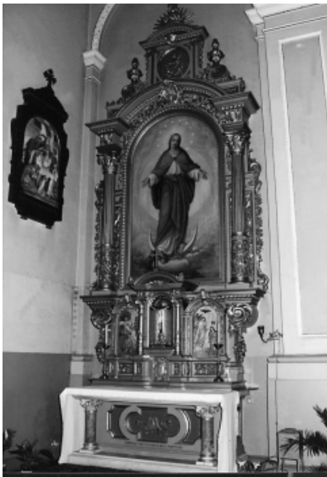
Bazilika Srca Isusova u Zagrebu: Oltar Bl. dj. Marije. Radionica Ferdinanda Stuflessera, St. Ulrich, Tirol

Basilica of the Heart of Jesus in Zagreb: Altar of the Holy Virgin Mary. Ferdinand Stuflessner's studio, St. Ulrich, Tyrol