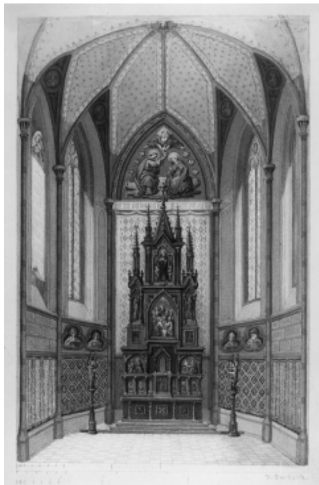
Josip Proksch: Nacrt za sanktuarij 1866. – Grafička zbirka NSB Josip Proksch: Plan for Sanctuary 1866. National and University Library Graphics Collection

dijelova u svetištu, ponajprije prozora, koji su u baroku često bili zazidani, i njihovo figuralno ukrašavanje, na izgradnju novih oltara, ornamentiranje zidova i postavljanje novih podnih ploča. Osnivanje Komisije poklapalo se od 1844. namjeravanom, ali tada tek započetom obnovom bečke katedrale Sv. Stjepana. 2 A što se zagrebačke metropolitanske crkve tiče, biskup Haulik je već 1842. godine odlučio o obnovi svetišta primajući poticaje iz minhenskih crkvenih i umjetničkih krugova.