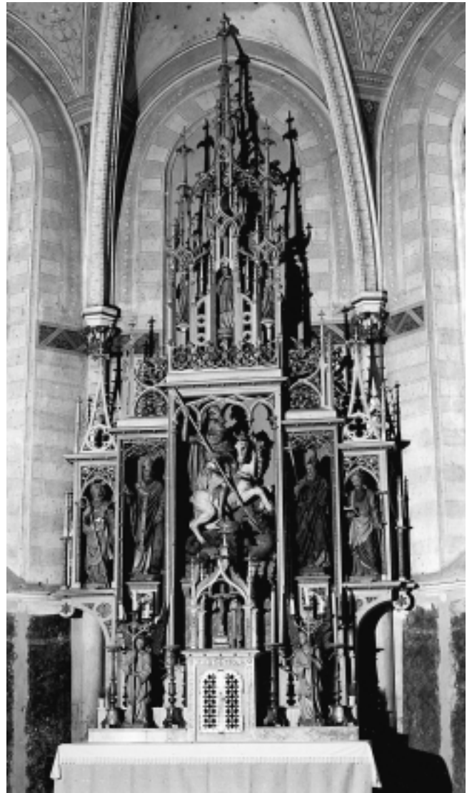
Župna crkva u Desiniću. Glavni oltar obnovljen 1936-37. Parish Church in Desinić. Main Altar renovated in 1936-37.

Church of Saint Mary at Okič: Main Altar designed by August Posilović. Sculptures from the Brothers Moroder Studio (the painter Joseph and the sculptors Ludwig and Rudolf)