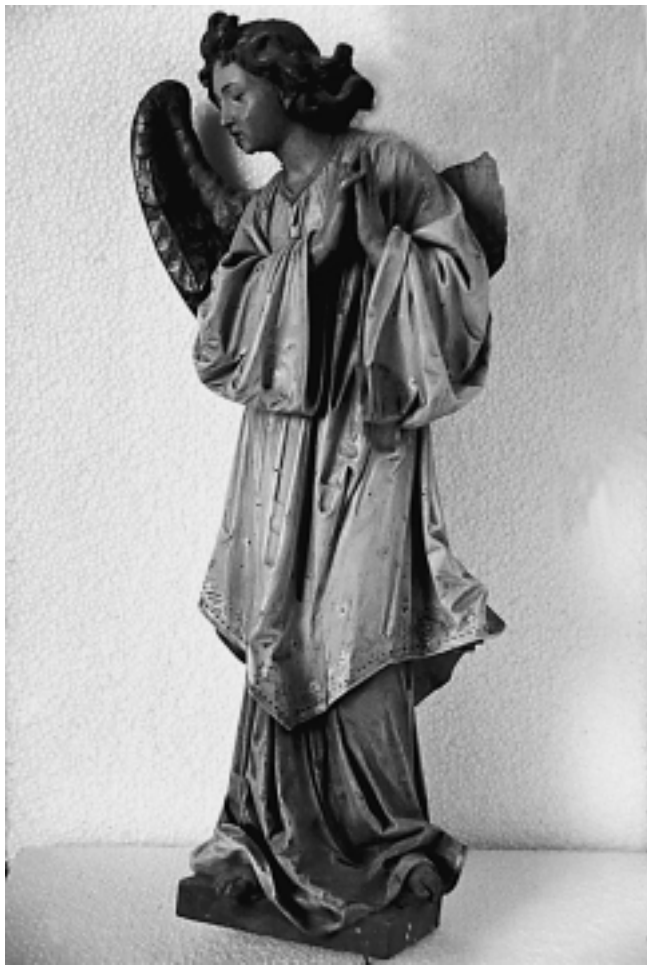
Župna crkva u Sisku: Anđeo. Radionica Insam i Prinoth, St. Ulrich, Tirol

Parish Church in Sisak: Angel. Insam and Prinoth studio, St. Ulrich, Tyrol