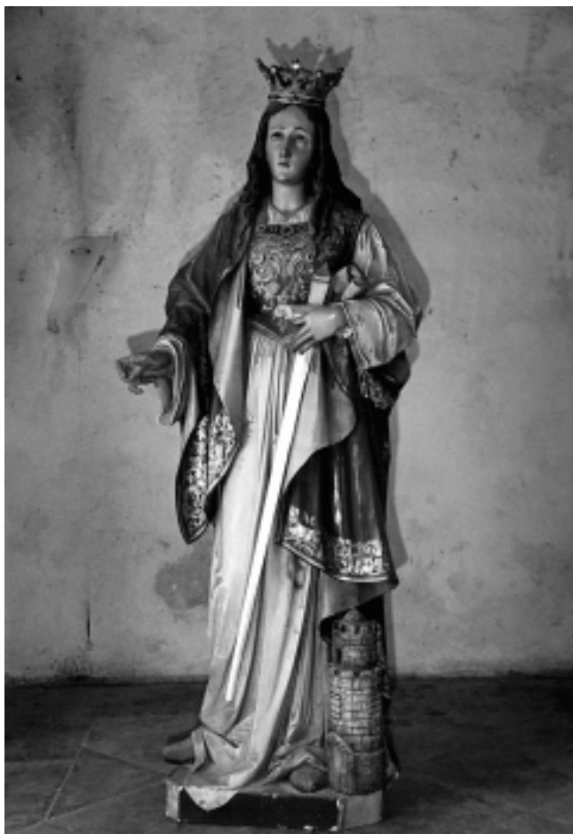
Župna crkva u Sisku: Bočni oltar. Sv. Barbara. Radionica Insam i Prinoth, St. Ulrich, Tirol

Parish church in Sisak: the side altar of Saint Barbara. (Studio Insam and Primoth, St Ulrich, Tyrol)