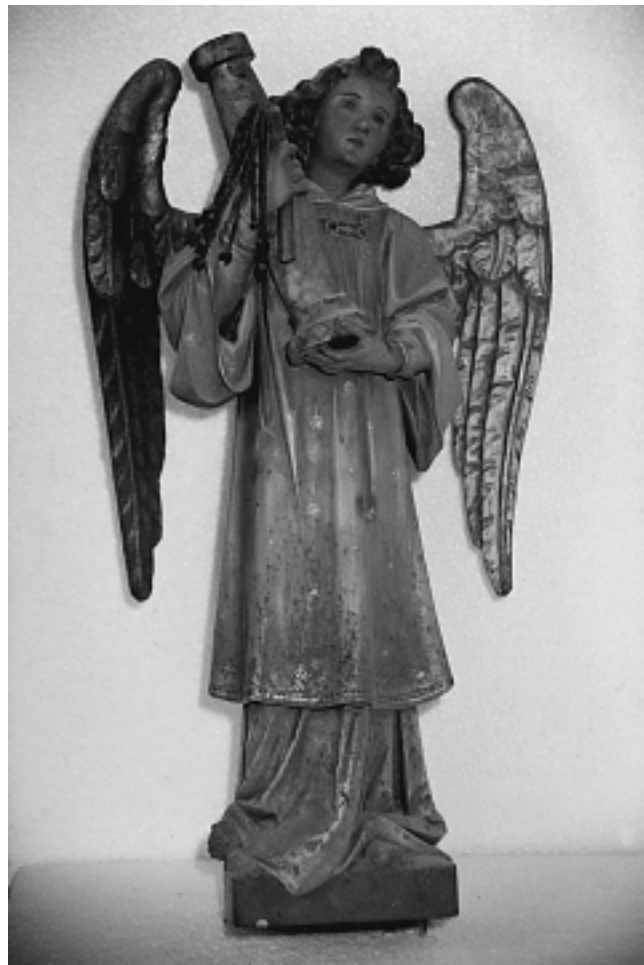
Župna crkva u Sisku: Anđeo. Radionica Insam i Prinoth, St. Ulrich, Tirol

Parish Church in Sisak: Angel. Insam and Prinoth studio, St. Ulrich, Tyrol