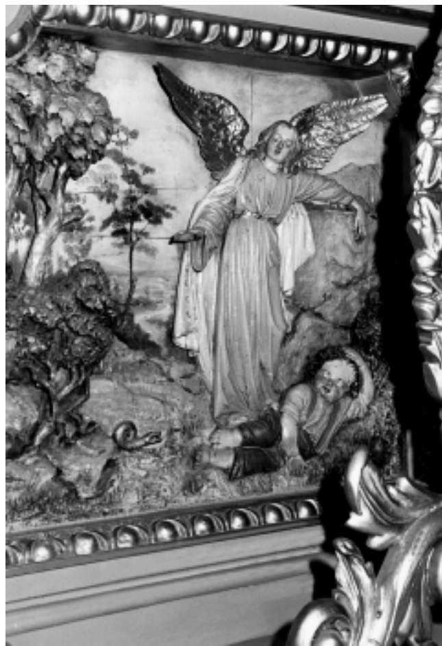
Bazilika Srca Isusova u Zagrebu: Reljef na oltaru Anđela čuvara. Radionica Ferdinanda Stuflessera, St. Ulrich, Tirol

Basilica of the Heart of Jesus in Zagreb: Altar of the Holy Virgin Mary. Ferdinand Stuflessner's studio, St. Ulrich, Tyrol