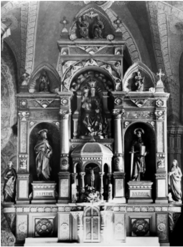
Crkva sv. Marije pod Okičem: Glavni oltar. Nacr August Posilovića. Kipovi iz radionice Braća Moroder (Josef slikar, Ludwig i Rudolf kipari), Tirol.

Church of Saint Mary at Okič: Main Altar designed by August Posilović. Sculptures from the Brothers Moroder Studio (the painter Joseph and the sculptors Ludwig and Rudolf)