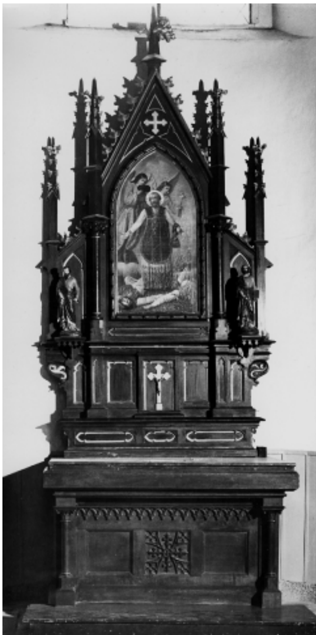
Župna crkva u Krapinskim Toplicama: Oltar sv. Valentina Parish Church in Krapinske Toplice: Altar of Saint Valentine

dijelova u svetištu, ponajprije prozora, koji su u baroku često bili zazidani, i njihovo figuralno ukrašavanje, na izgradnju novih oltara, ornamentiranje zidova i postavljanje novih podnih ploča. Osnivanje Komisije poklapalo se od 1844. namjeravanom, ali tada tek započetom obnovom bečke katedrale Sv. Stjepana. 2 A što se zagrebačke metropolitanske crkve tiče, biskup Haulik je već 1842. godine odlučio o obnovi svetišta primajući poticaje iz minhenskih crkvenih i umjetničkih krugova.