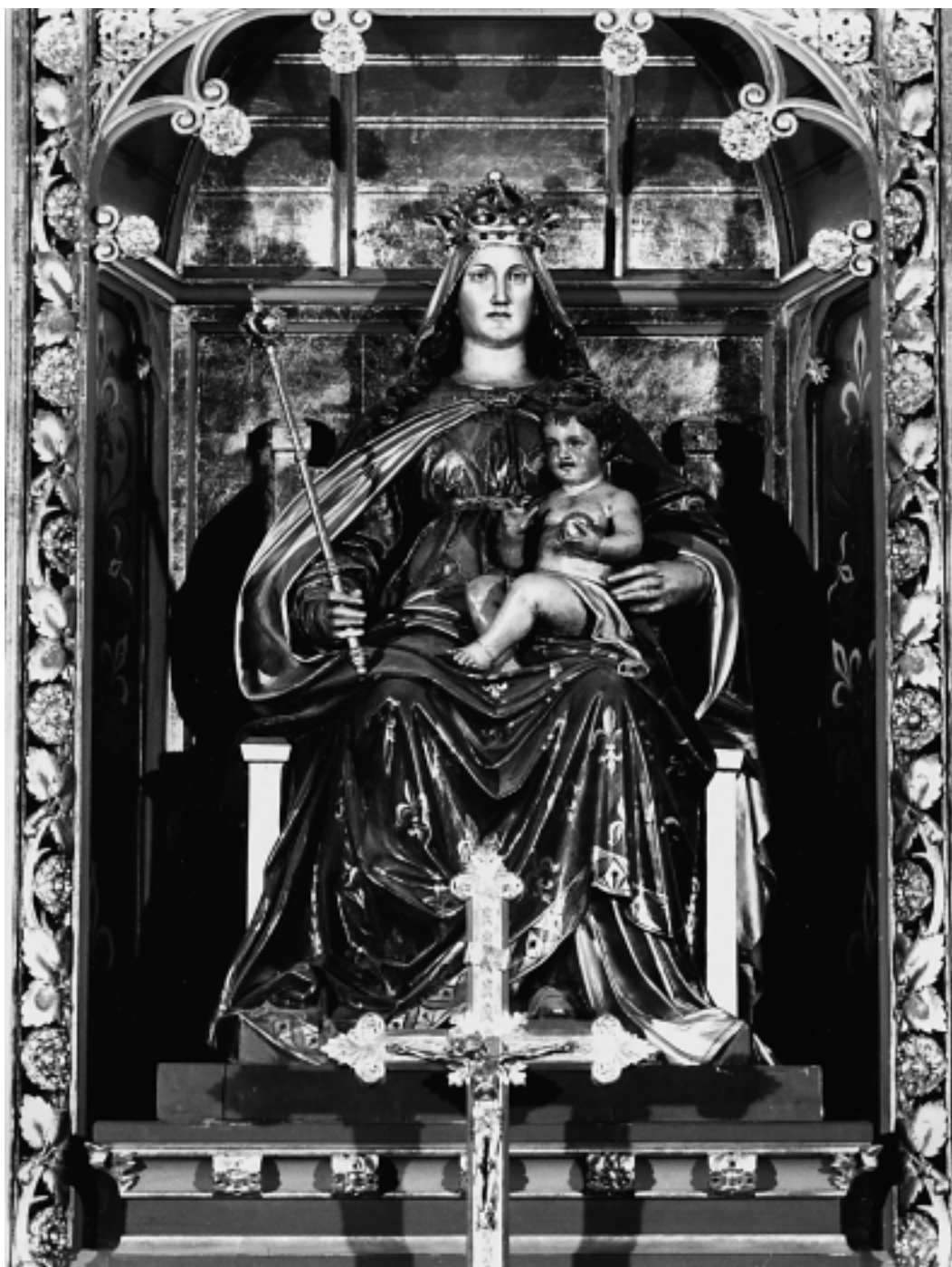
Katedrala u Zagrebu: Oltar Bl. dj. Marije. Marija s Isusom, rad Dragutina Moraka Cathedral in Zagreb: Altar of the Holy Virgin Mary. Mary with Jesus by Dragutin Morak