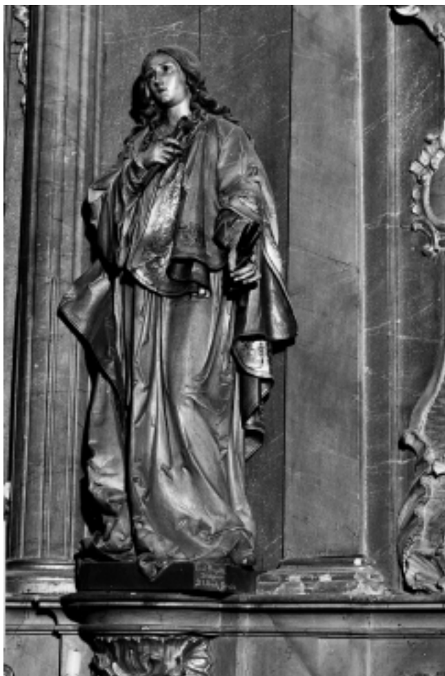
Franjevačka crkva u Krapini: Sv. Apolonija. Rad Ferdinanda Prinotha, St. Ulrich, Tirol

Franciscan Church in Krapina: Saint Apollonia by Ferdinand Prinoth, St. Ulrich, Tyrol