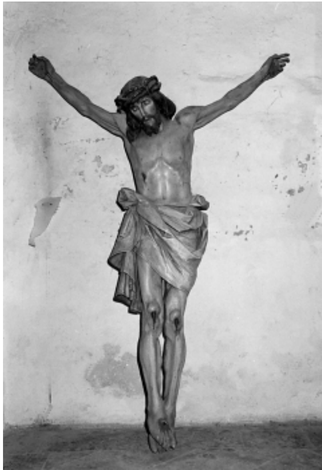
Župna crkva u Sisku: Glavni oltar. Raspeće. Radionica Insam i Prinoth, St. Ulrich, Tiroł

Parish Church in Sisak: Main Altar – The Crucifixion. Insam and Prinoth studio, St. Ulrich, Tyrol