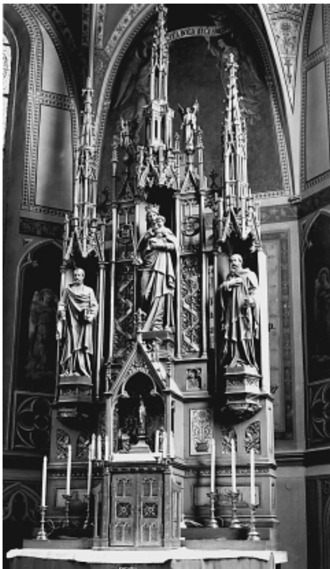
Župna crkva u Granešini: Glavni oltar. Nacrt H. Bolléa. Parish Church in Granešina: Main Altar designed by H. Bollé