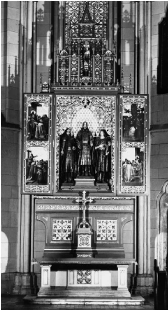
Katedrala u Zagrebu: Oltar sv. Ladislava. Nacrt H. Bolléa. Slike Josipa Bauera, kipovi Dragutina Moraka

Cathedral in Zagreb: Altar of Saint Ladislaus designed by H. Bollé. Paintings by Josip Bauer, sculpture by Dragutin Morak