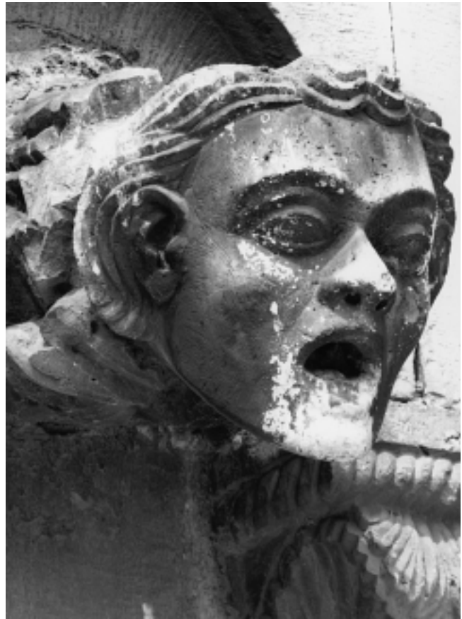
Petar Radmilov Pozdančić (?), Bogorodica sa Stalne izložbe crkvene umjetnosti u Zadru i glava arkandela Gabrijela iz crkve Sv. Ivana, detalj