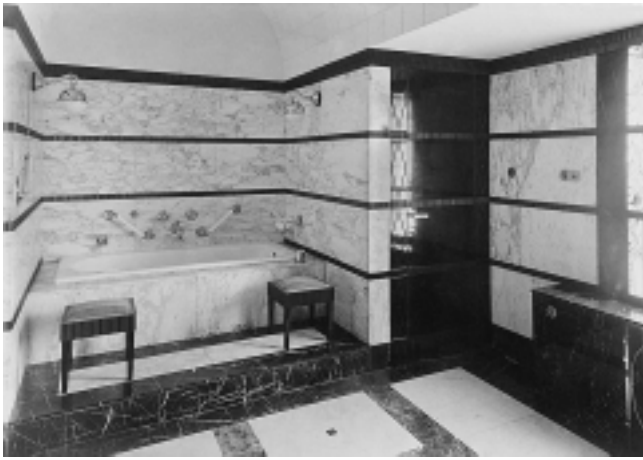
Vila Ilić, 1918–1920. god. Paunovac 7, Zagreb. Kupaonica Vila Ilić, 1918–1920. Paunovac 7, Zagreb. Bathroom