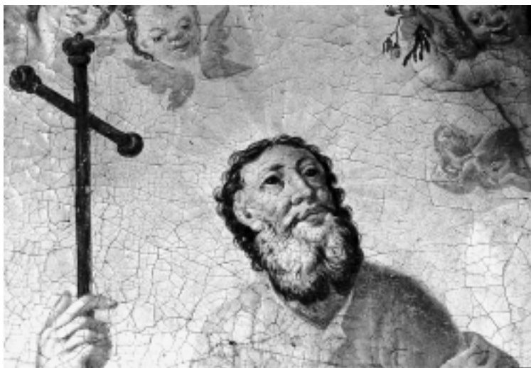
Sv. Filip, detalj, kapela Sv. Fabijana i Sebastijana, Varaždin St. Philip, detail, Chapel of SS Fabian and Sebastian, Varaždin