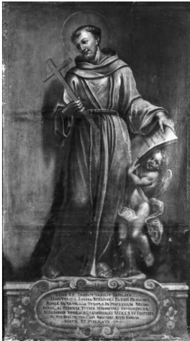
Sv. Franjo Asiški, Franjevački samostan, Varaždin St. Francis of Assisi, Franciscan Monastery, Varaždin

sve do 1745. godine. On je u februaru 1743. godine sklopio ugovor sa starješinama crkve Sv. Florijana Bernardom Kremayerom i Johanom Friedrichom Hempöschom za polikromiranje i pozlatu nove propovjedaonice... Osim navedenih izveo je Blaž Grueber još i prije 1743. godine u toj crkvi neke druge, vjerojatno pozlatarske i polikromatorske radove . O tome su nam sačuvani podaci u računima za tu kapelu... 10 Otvorene sonde otkrivaju za sada samo lako prepoznatljiva lica, vjerojatno Krista i Boga Oca u prikazu Presvetoga Trojstva na središnjem dijelu svoda, te mladoliko lice krupna anđela ili Bogorodice u susvodnici.