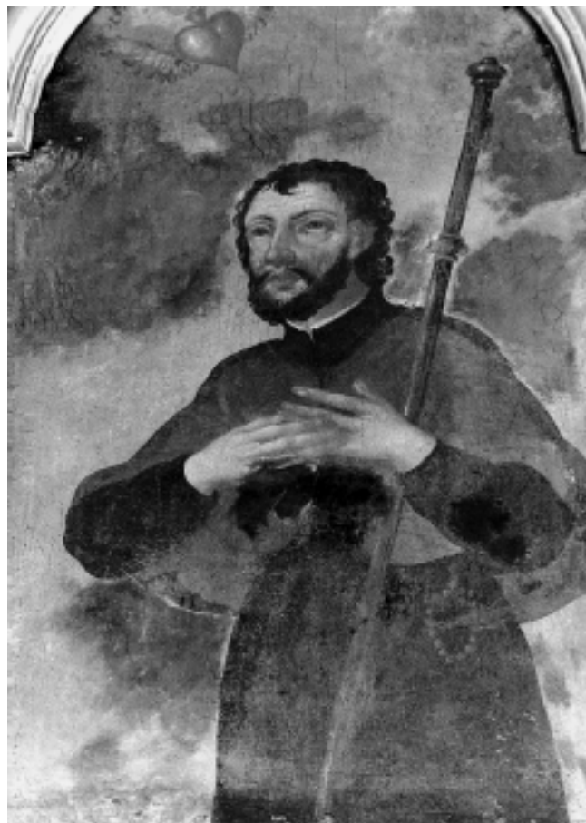
Sv. Franjo Ksaverski, kapela Sv. Fabijana i Sebastijana, Varaždin St. Francis Xavier, Chapel of SS Fabian and Sebastian, Varaždin

presijeca lik u desnom dijelu kompozicije. Slikani je prostor, kao i na oltarnoj pali Sv. Filipa u kapeli Sv. Fabijana i Sebastijana, naglo skraćen, a prostorna dijagonala nelogično se obrušava prema perspektivno umanjenom liku lijevo u pozadini. Fizionomija Sv. Fidelija neznatno je individualizirana. Tipološki je srodna likovima svetaca koji naseljavaju nebeski krajolik u sakristiji varaždinske prvostolnice, prosijedom Sv. Filipu na već spomenutoj oltarnoj pali i Sv. Franji Ksaverskom na prikazu koji resi atiku istoga oltara u kapeli Sv. Fabijana i Sebastijana. S lakoćom se očitavaju otežali kapci naglašenih obrisa, konveksno zaključena čvrsta bradica, vršnim svjetlima istaknute vlasi kose i karakteristična, po sredini razdijeljena duga brada. Grueber ponovno poseže za uobičajenom paletom, a dijelovi draperije ponovo postaju predmetom njegova osjećaja za dekorativno i linearno, pa se, gdje god je to moguće, gužvaju u nečitke labirinte rastočene naglašenim odnosima svijetlih istaka i sivosmeđom bojom zatamnjenih, pravilno omeđenih uleknuća.