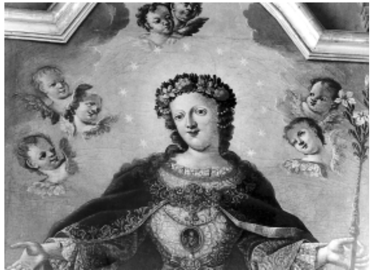
Bezgrješna Bogorodica, detalj, kapela Sv. Vida, Varaždin Immaculate Virgin, detail, Chapel of St. Vid, Varaždin

niz široku haljinu razvedenu plitkim naborima oštih kontura pričvršćuju je u jednoj ravnini, posve približenoj gledatelju. Slikajući Bezgrješnu Bogorodicu za crkvu Sv. Mihovila arkandela u Mihovljanu, Grueber izvodi istovjetnu scenografiju – zemaljsku kuglu presječenu donjim rubom kadra i svjetlom osmišljen prostor stiliziranog nebeskog krajolika koji se otvara iza uspravne Marijine figure. Prikazuje ipak drugi tip Immaculate , Mariju Pobjednicu s malim Isusom koji prislonjen uz majčin lijevi bok dugim krakom križa zadaje zmiji pod njenim nogama smrtonosni udarac.