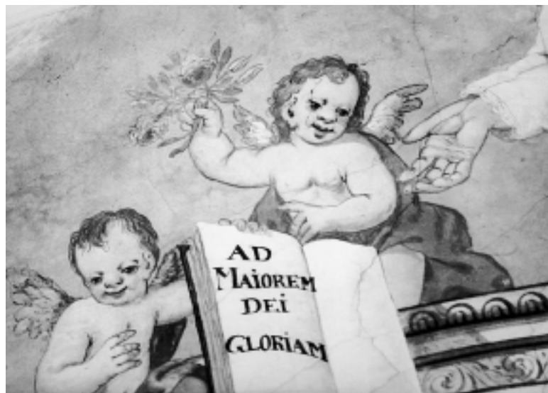
Detalj freske u sakristiji, crkva Uznesenja Marijina, Varaždin Detail of the fresco in the sacristy, Church of the Assumption of Mary, Varaždin