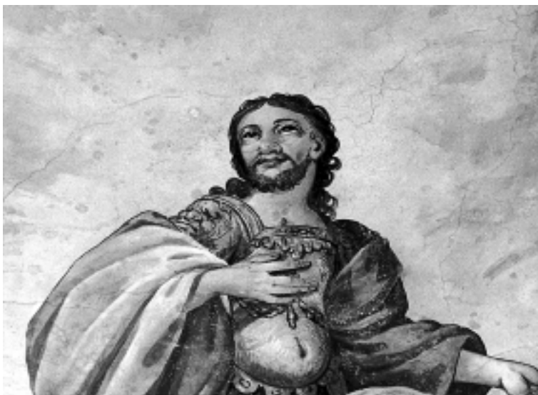
Detalj freske u sakristiji, crkva Uznesenja Marijina, Varaždin Detail of the fresco in the sacristy, Church of the Assumption of Mary, Varaždin