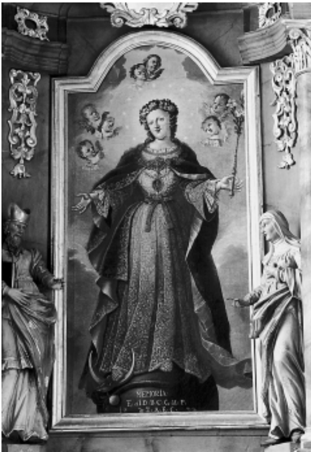
Bezgrješna Bogorodica, kapela Sv. Vida, Varaždin Immaculate Virgin, Chapel of St. Vid, Varaždin