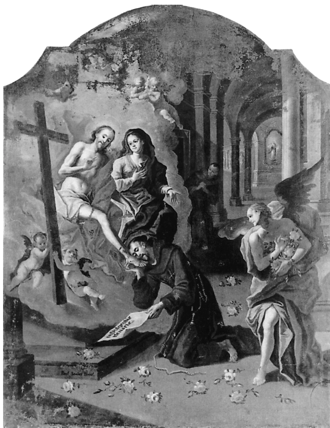
1. Porcijunkulski oprost, Visoko (Bosna i Hercegovina), franjevački samostan

1. The Porziuncola Indulgence, Franciscan monastery, Visoko