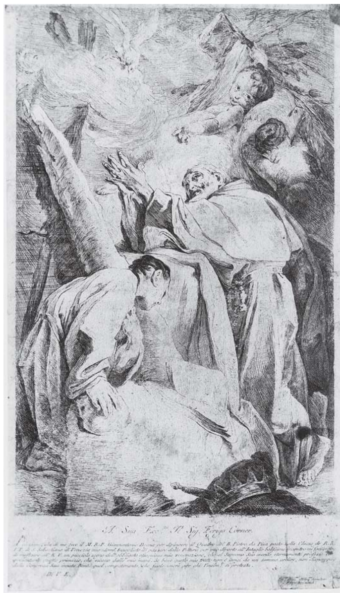
1. Federico Benković, Bl. Pietro Gambacorti , 1725.–1728., bakrorez (Museo Correr, Venecija)

1. Federico Bencovich , Beato Pietro Gambacorti , 1725–1728, etching