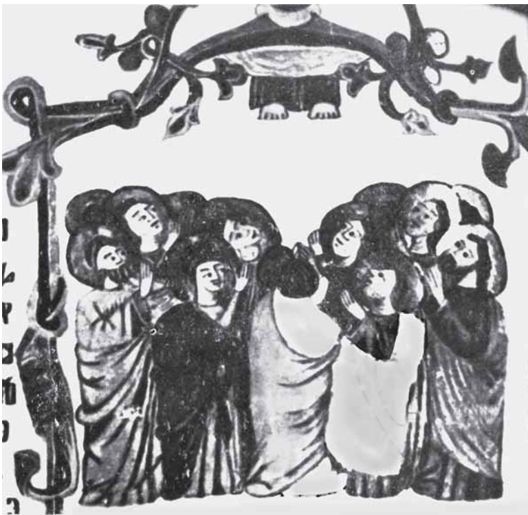
9. Ročki misal , oko 1420. g., Beč, ÖNB, Cod. slav. 4, fol. 103r, Prikaz Uzašašća Kristova

9. Roč Missal, ca 1420, Vienna, ÖNB, Cod. slav. 4, fol. 103r, The Ascension