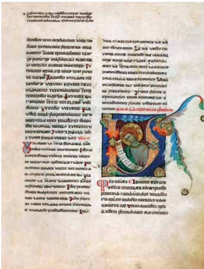
6. Misal kneza Novaka , 1368. g., Beč, ÖNB, Cod. slav. 8, fol. 91r, Lik sv. Ivana Evanđelista 6. Missal of Headman Novak , 1368, Vienna, ÖNB, Cod. slav. 8, Sv. Ivan, fol. 91r; Figure of John the Evangelist