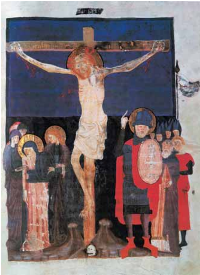
4. Ljubljanski misal , oko 1425. g., Ljubljana, NUK, ms. 162, fol. 145r, Raspeće

4. Ljubljana Missal , ca 1425, Ljubljana, NUL, ms. 162, fol. 145r; Crucifixion