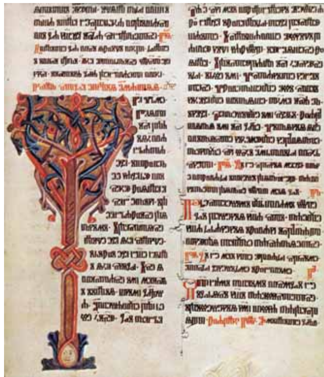
8. Ročki misal , oko 1420. g., Beč, ÖNB, Cod. slav. 4, fol. 30r, Inicijal V (glag.)