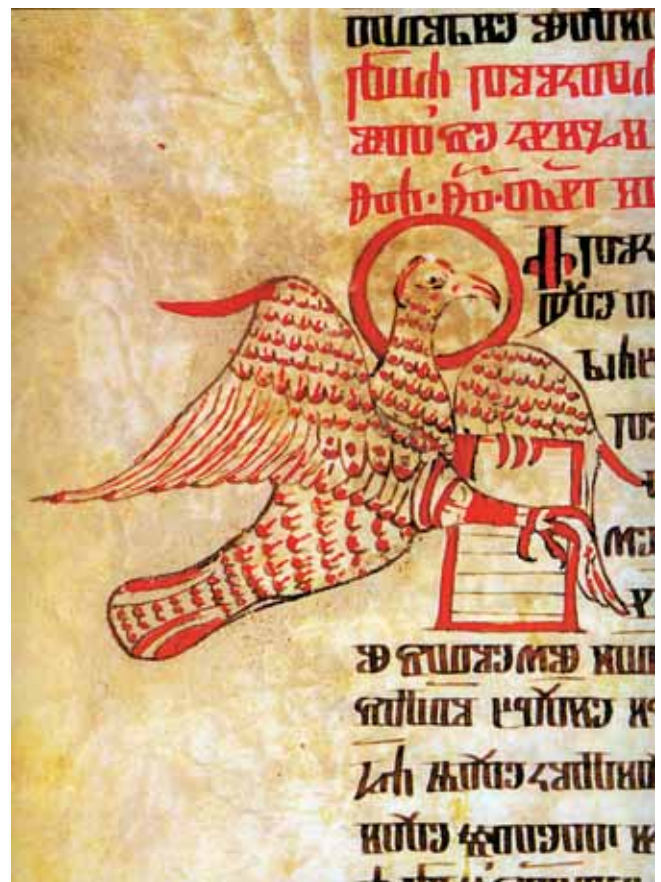
12. Dragučki brevijar , 1407. g., Zagreb, Arhiv HAZU, III b 25, fol. 111r, Orao, simbol sv. Ivana Evanđelista