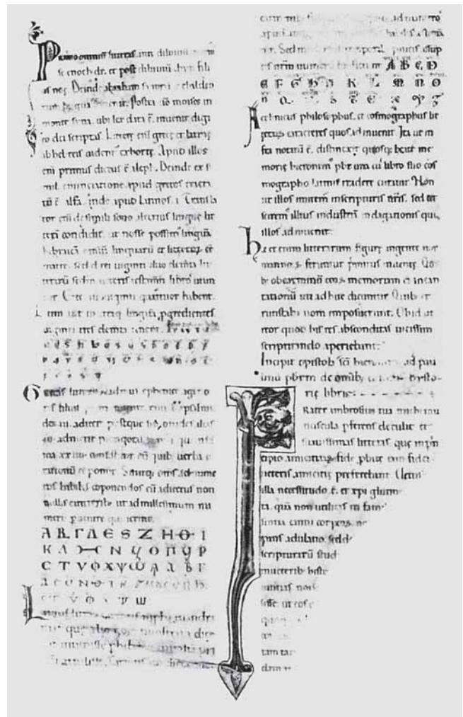
2. Fragmenti Biblije , sredina 12. st., Piacenza, Archivio Capitolare, Cod. n. 68, fol. 1r, Inicijal »F«-rater Ambrosius