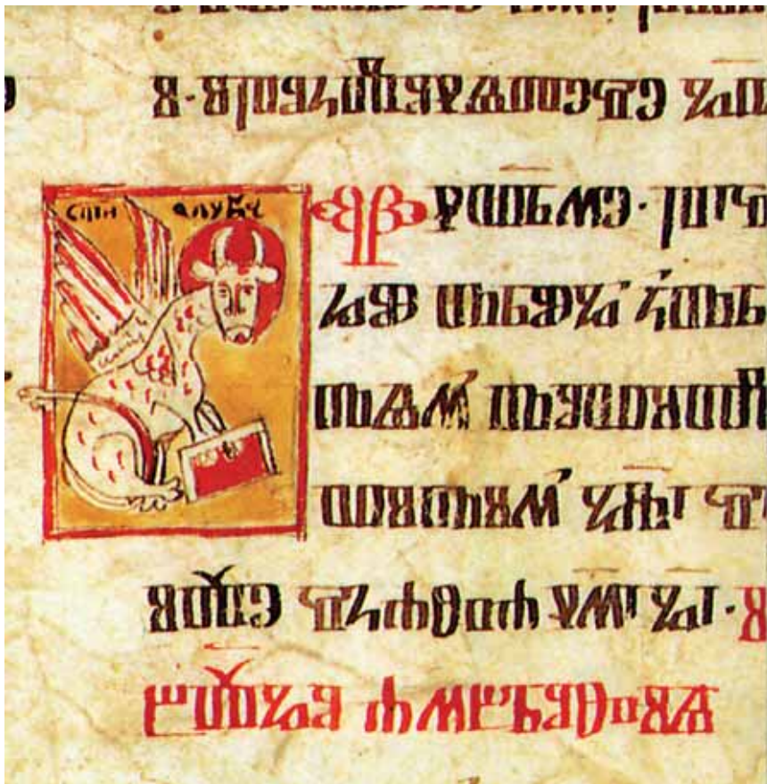
13. Brevijar Vida Omišljanina , 1396. g., fol. 40v, Vol, simbol sv. Luke Evangelista 13. Breviary of Vid of Omiš , 1396. g. fol. 40v, Ox – symbol of Luke the Evangelist