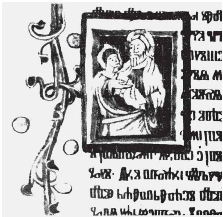
10. Ročki misal , oko 1420. g., Beč, ÖNB, Cod. slav. 4, fol. 152v, Prikazanje Isusa u hramu, Šimun drži Malog Isusa

Tekst je pisan u 2 stupca veličine 85 x 250 mm, a u svakom stupcu ima 28 redaka. Visina redaka je 10 mm a visina slova 5 mm. Veličina marginalnih prostora: unutarnji 25, srednji 10, vanjski 57, gornji 28, donji 73 mm. Okvir i crte po kojima je pisan tekst izvedeni su slijepom pisaljkom. Uvezan je u drvene korice obložene crnom kožom s utisnutim geometrij-