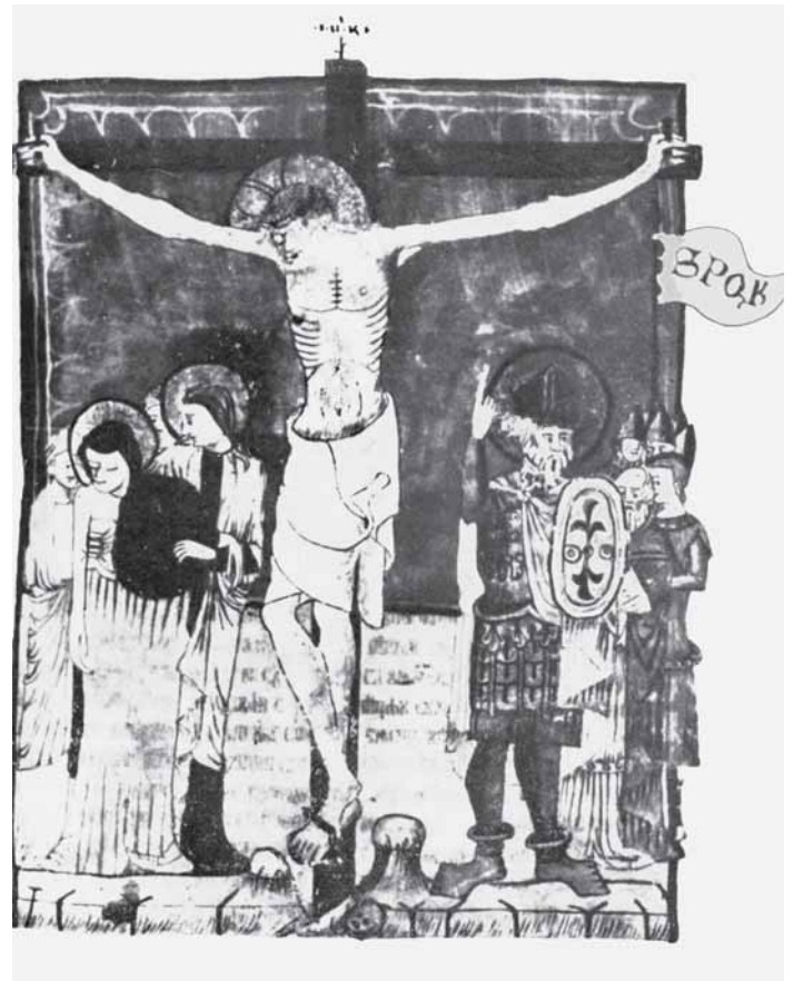
5. Ročki misal , oko 1420. g., Beč, ÖNB, Cod. slav. 4, fol. 143r, Raspeće

4. Ljubljana Missal , ca 1425, Ljubljana, NUL, ms. 162, fol. 145r; Crucifixion