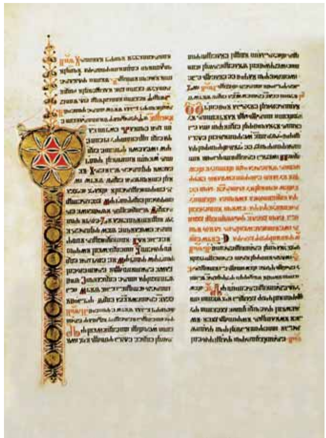
7. Misal kneza Novaka , 1368. g., Beč, ÖNB, Cod. slav. 8, fol. 215v, inicijal V (glag.) 7. Missal of Headman Novak , 1368, Vienna, ÖNB, Cod. slav. 8, fol. 215v. initial V (glag.)

3. Na fol. 84r sv. Luka , naslikan u poluprofilu odjeven u žutu togu i plavi plašt. U lijevoj ruci prekrivenoj plaštom drži knjigu.