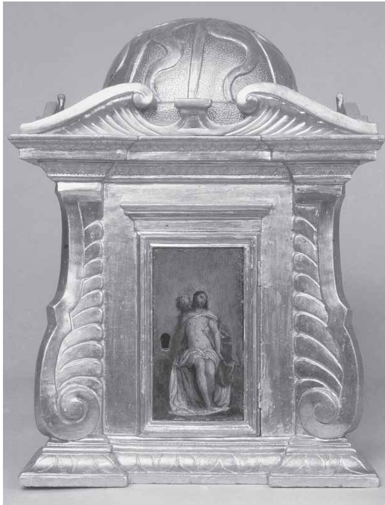
Svetohranište poliptiha P. Veronesea, pozlaćeno i obojeno drvo, 56,5 x 42 x 33 cm, Vrboska, župna crkva

Tabernacle of P. Veronese polyptych, painted and gilt wood, 56,5 x 42 x 33 cm, Vrboska, Parish Church