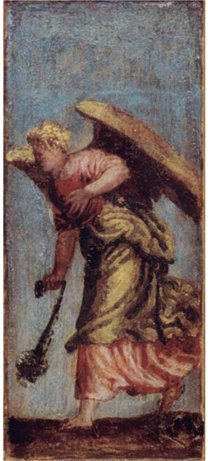
Radionica P. Veronesea, Anđeo s kandilom , ulje na dasci, 20,3 x 8,4 cm, svetohranište poliptiha, Vrboska, župna crkva Workshop of P. Veronese, Angel with Censor, oil on panel, 20,3 x 8,4 cm, tabernacle of the polyptych, Vrboska, Parish Church