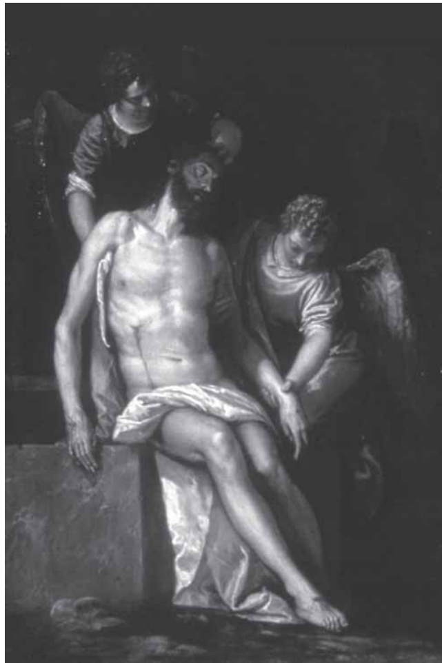
P. Veronese (?), Mrtvi Krist s dva anđela , ulje na platnu, 98 x 71 cm, Boston, Museum of Fine Arts