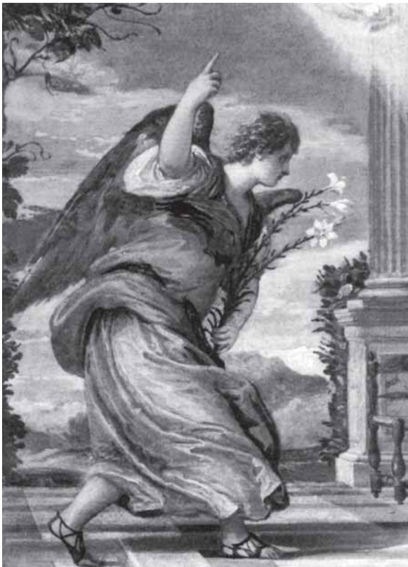
P. Veronese, Navještenje , ulje na platnu, 29 x 44 cm, detalj s arkandelom Gabrijelom, London, privatno vlasništvo

P. Veronese, Annunciation, oil on panel, 29 x 44 cm, detail with the Archangel Gabriel, London, privately owned