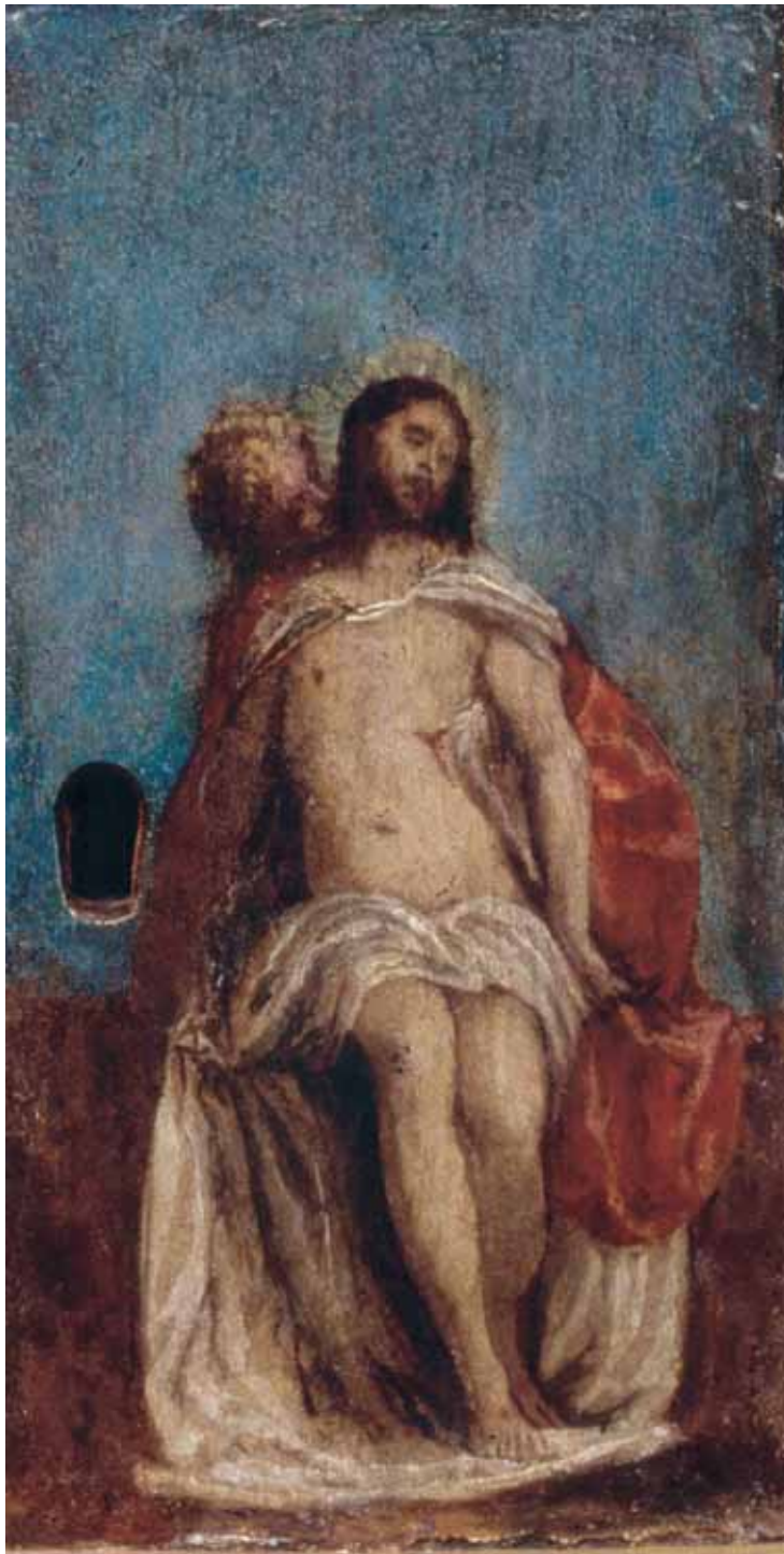
Radionica P. Veronesea, Mrtvi Krist a anđelom , ulje na dasci, 20,4 x 10,6 cm, svetohranište poliptiha, Vrboska, župna crkva

Workshop of P. Veronese, The Dead Christ with Angel, oil on panel, 20,4 x 10,6 cm tabernacle of the polyptych, Vrboska, Parish Church