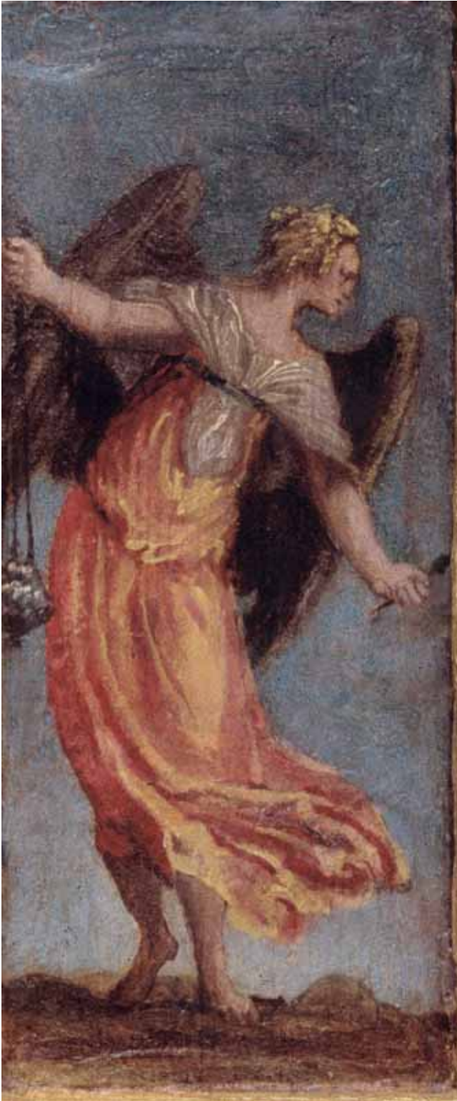
Radionica P. Veronesea, Anđeo s kandilom i čavlom , ulje na dasci, 20,3 x 8,7 cm, svetohranište poliptiha, Vrboska, župna crkva Workshop of P. Veronese, Angel with Censor and Nail, oil on panel, 20,3 x 8,7 cm, tabernacle of the polyptych, Vrboska, Parish Church