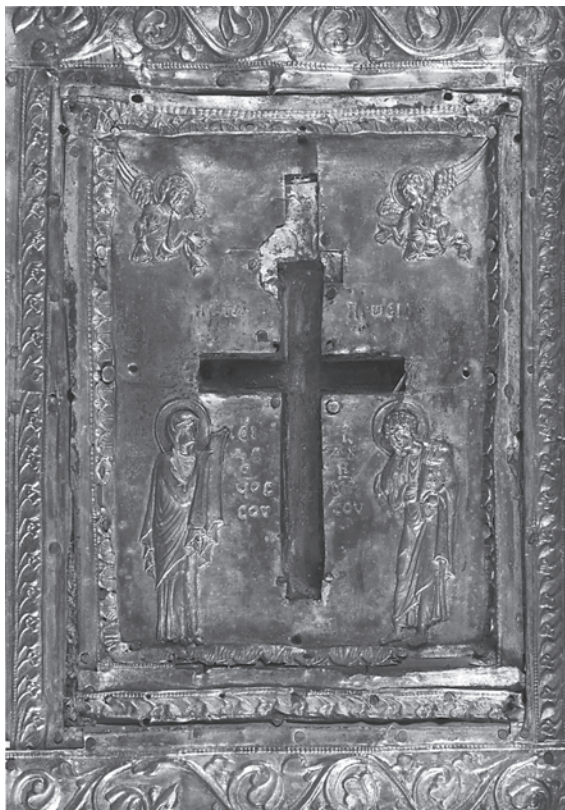
9. Stauroteka s poklopcem, unutrašnji dio, bizantska umjetnost, 11. st., Pariz, Muzej Louvre

Staurotheca with a lid, interior. Byzantine art, 11 th c., Paris, Louvre