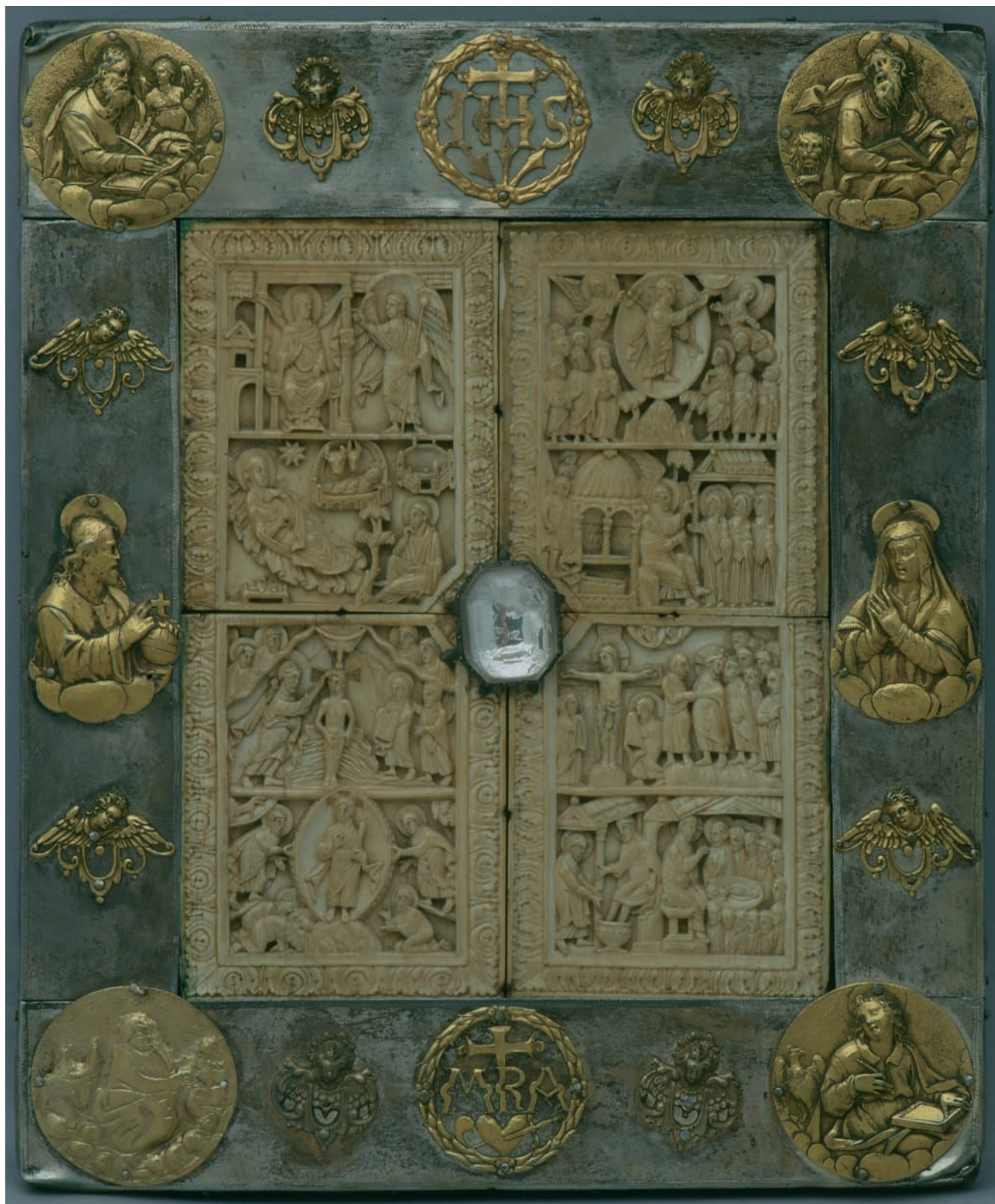
1. »Bjelokosni plenarij«, 11. st. (bjelokosni reljefi), 17. st. (okvir), Riznica Zagrebačke katedrale Ivory plenary, 11 th c. (ivory reliefs), 17 th c. (frame), Treasury of the Zagreb Cathedral