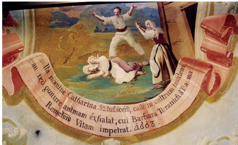
19. Ivan Krstitelj Ranger, Čudo s unesrećenom Katarinom Stubičankom iz 1663., zidna slika, Remete, 1747.

The Miracle with the Injured Katarina Stubičanka from 1663, copperplate engraving in: A. Eggerer, Pharmacopœa coelestis (1672.). Kloštar-Ivanić, Franciscan monastery