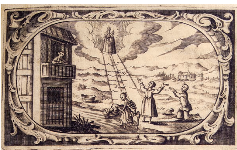
6. Čudo sa spašenom utopljenicom iz 1600., bakrorez u: A. Eggerer, Pharmacopœa coelestis (1672.). Kloštar-Ivanić, franjevački samostan

The Miracle with a Woman Saved from Drowning from 1600, copperplate engraving in: A. Eggerer, Pharmacopœa coelestis (1672.). Kloštar-Ivanić, Franciscan monastery