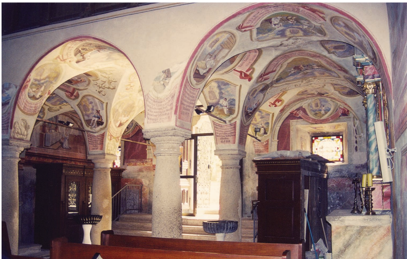
1. Remete, slikani medaljoni Ivana Krstitelja Rangerera iz 1747. g. Remete, painted medallions by Ivan Krstitelj Ranger from 1747

Medaljoni su slikani na zakrivljenim plohamu svoda i na ravnim zidovima, no svaka je slika »položena« na zidni plašt kao prenesena ( quadro riportato ), s vlastitim okvirom, očištem i natpisom na iluzioniranoj traci ili polju pod njim. Za svaki od njih promatrač mora u potpunosti promijeniti motrište, a njegov hod unosi u oslik dimenziju vremena. S obzirom na to da ih nije moguće sagledati u jednom trenutku, medaljoni tvore dojam da se radi o godinama nagomilanim ex-voto prizorima. Ipak, njihov značaj nije zavjetni, kako se to povremeno u literaturi navodi. Čudesni događaji oslobođenja od bolesti, napasti, ropstva ili zavjere datirani su od 1250. do 1747. godine, te sadrže odabrani historijat uslišanja po zagovoru Majke Božje Remetske i imaju propagandnu a ne zavjetnu narav. 6 O tome svjedoči njihov smještaj i funkcija kojom se na početku crkvenoga hoda remetsko proštenište vizualno deklarira kao izvor brojnih čuda. Potom, jedinstvena su koncepcija i izrada, jer su ostvareni na osnovi jedinstvene narudžbe. Nju nisu dali u zavjet uslišanici, u to vrijeme neki već stoljećima pokojni, nego red, odnosno glavari u čijoj je skrbi bilo proštenište. Pavlini su kult Majke Božje Remetske očito željeli osnažiti likovnim i tekstovnim opisom dijela zabilježenih čuda kako bi ona bila vidljiva hodočasnici. Posljednja godina navedena na medaljonu jest 1747., pa tu godinu, uzimamo kao terminus ante quem non za dovršetak remetskih medaljona. U nutrim crkve, na