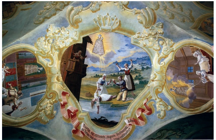
7. Ivan Krstitelj Ranger, Čudo sa spašenom utopljenicom iz 1600., zidna slika, Remete, 1747.

Ivan Krstitelj Ranger, The Miracle with a Woman Saved from Drowning from 1600, mural painting, Remete, 1747