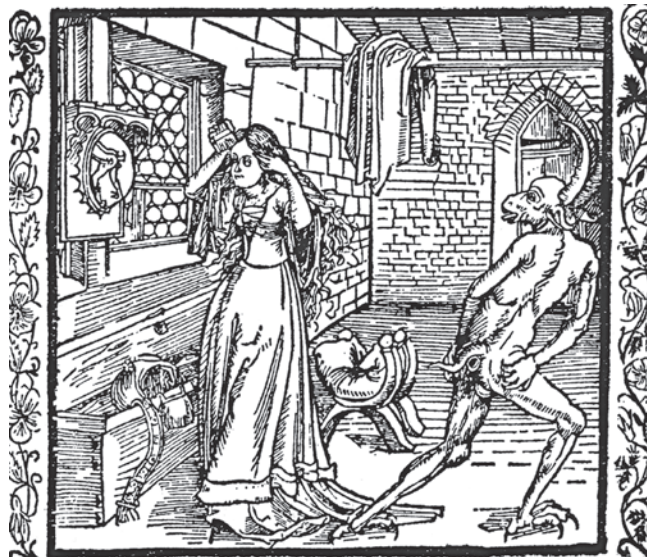
17. Albrecht Dürer, Tašta žena, drvorez u: Der Ritter von Turn, 1493.

Albrecht Dürer, Women Talking during the Mass are Assaulted by an Evil Spirit, woodcut in: Der Ritter von Turn, 1493