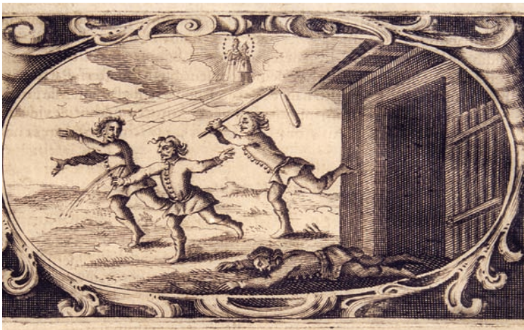
10. Čudo sa smrtno ranjenim Tomom Krajnickim iz 1659., bakrorez u: A. Eggerer, Pharmacopœa coelestis (1672.). Kloštar-Ivanić, franjevački samostan.

The Miracle with Deadly Wounded Toma Krajnicki from 1659, coppperplate engraving in: A. Eggerer, Pharmacopœa coelestis (1672). Kloštar-Ivanić, Franciscan monastery.