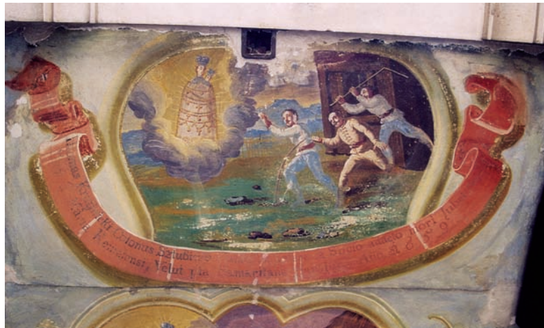
11. Ivan Krstitelj Ranger, Čudo sa smrtno ranjenim Tomom Krajnickim iz 1659., zidna slika, Remete, 1747.

The Miracle with Deadly Wounded Toma Krajnicki from 1659, coppperplate engraving in: A. Eggerer, Pharmacopœa coelestis (1672). Kloštar-Ivanić, Franciscan monastery.