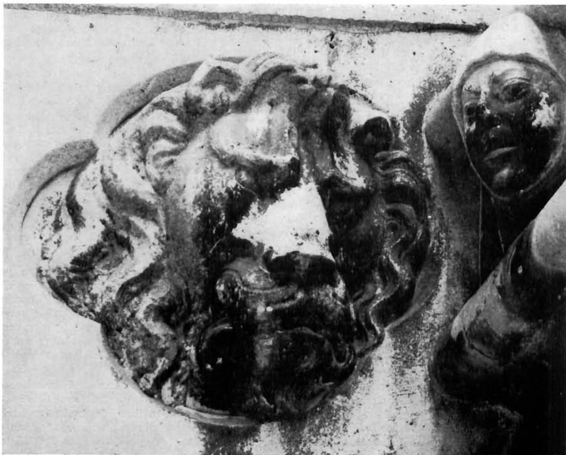
Juraj Matejev Dalmatinac, glava lava na apsidi šibenske katedrale

Sovraccarico di impegni, lavorando in molti luoghi lungo la costa adriatica, non riuscì a realizzare i suoi intenti, per cui oggi non ci sono le fortificazioni che egli aveva tanto genialmente ideato negli abbozzi che sono andati perduti.