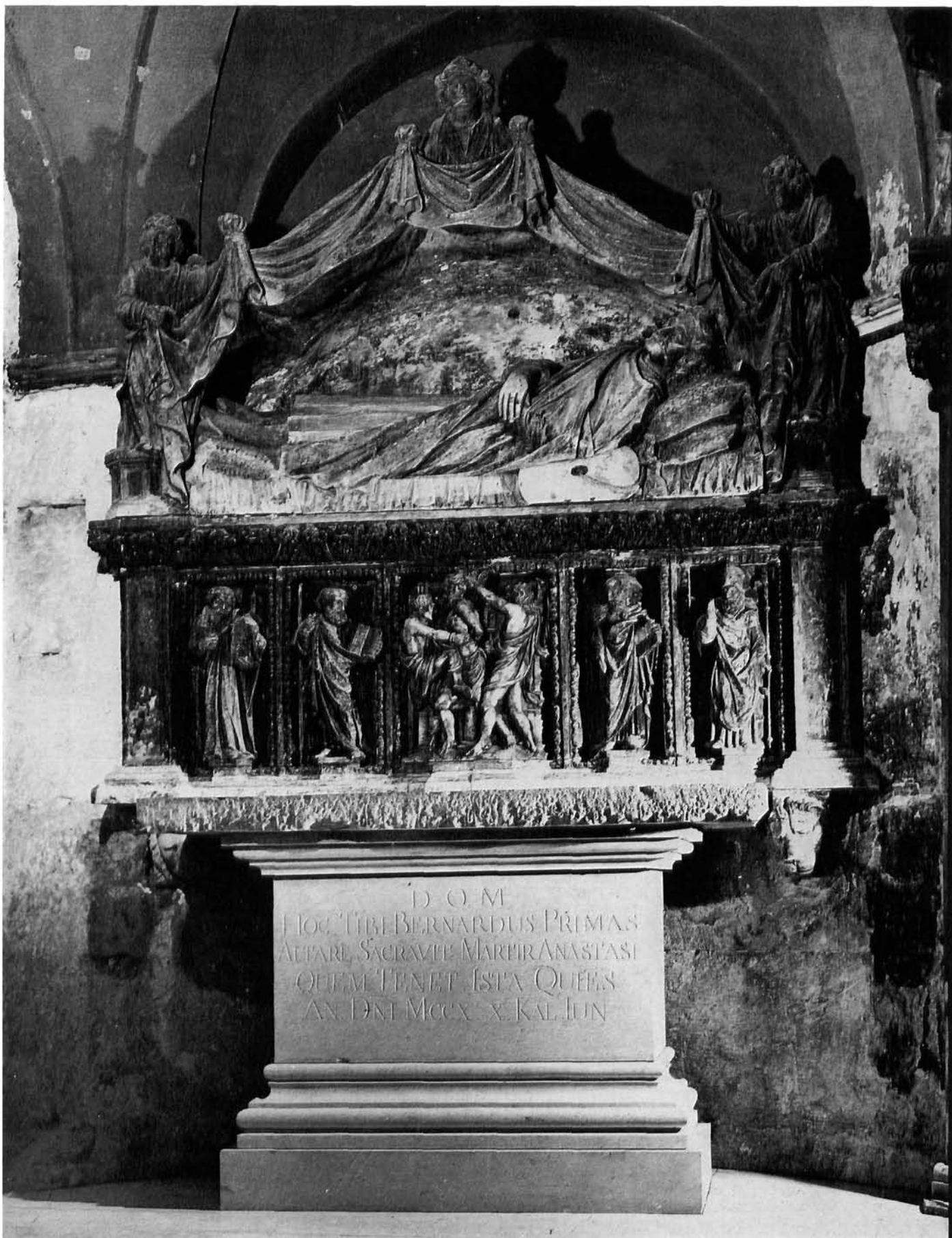
2. Split, Oltar Staševe kapele poslije restauriranja