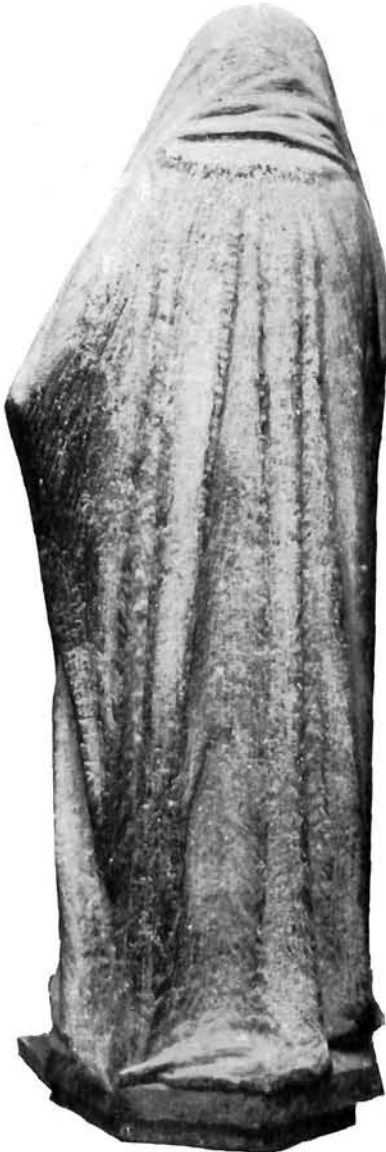
Split, oltar sv. Staša Bogorodica Navještenja, stražnja strana

Hrvatski prijevod: Gortan (1967), strana 35—36 — čitava isprava.