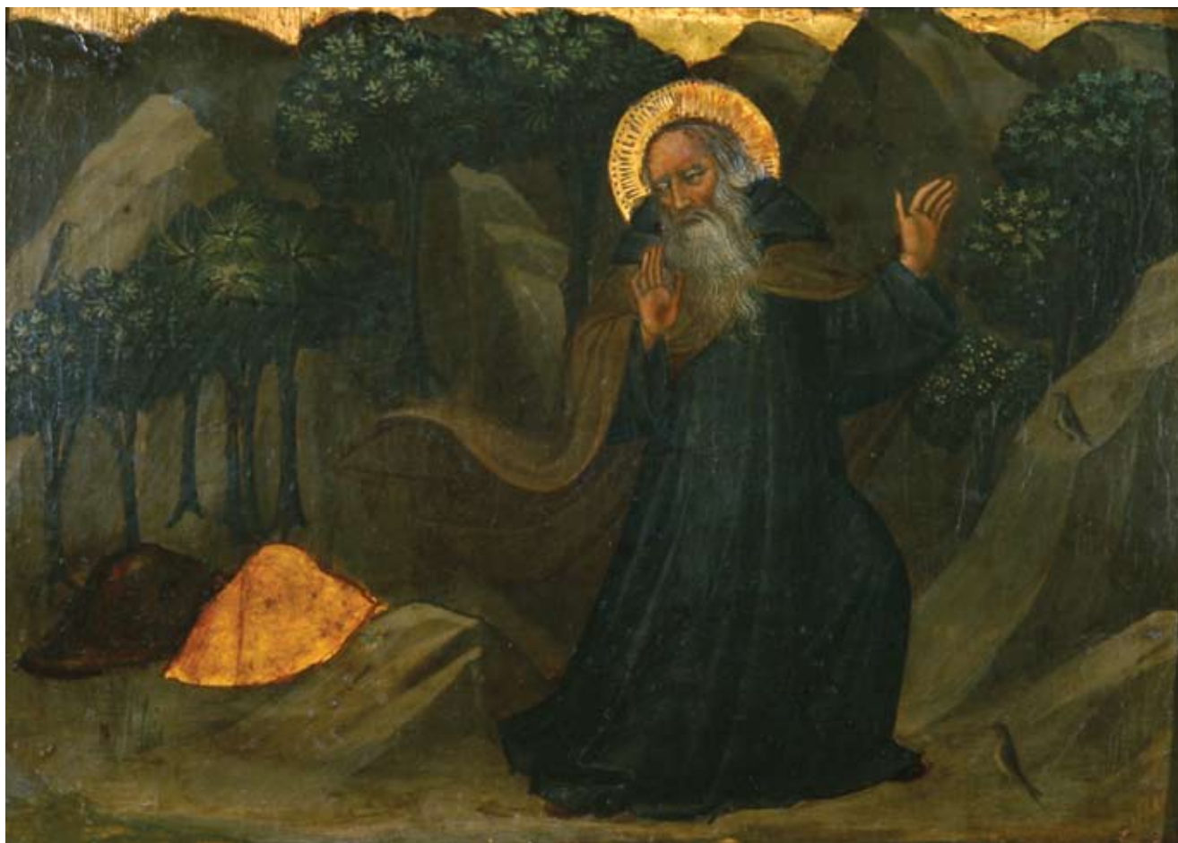
1. Niccolò di Pietro Gerini, Iskušenje svetoga Antuna Pustinjaka , 1390.–1400., tempera na dasci, 22 x 32 cm, Strossmayerova galerija starih majstora HAZU, Zagreb, inv. br. SG-28

Niccolò di Pietro Gerini, The Temptation of St Anthony the Hermit, 1390–1400, tempera on wood, 22 x 32 cm, Strossmayer Gallery of Old Masters, HAZU, Zagreb, inv. no. SG-28