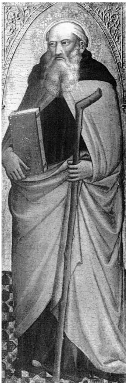
4. Niccolò di Pietro Gerini, Sveti Antun Pustinjak , 1390.–1400., tempera na dasci, 96 x 32 cm, inv. br. XX.A.19 (foto: fototeka Kunsthistorisches Instituta u Firenci)

Niccolò di Pietro Gerini, St Anthony the Hermit, 1390–1400, tempera on wood, 96 x 32 cm, inv. no. XX.A.19 (Photo: Photo Collection of the Kunsthistorisches Institut in Florence)