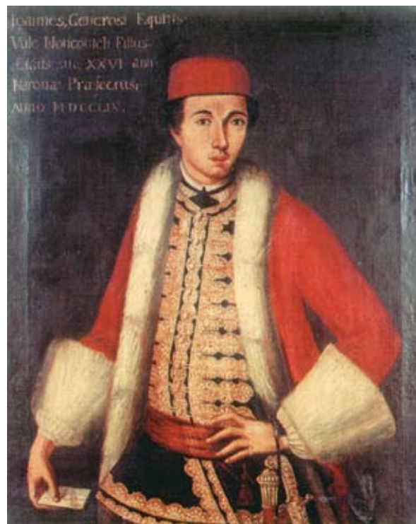
32. Filippo Naldi, Portret Ivana Nonkovića , Split, Muzej grada Splita

Filippo Naldi, Portrait of Luka Nonković, Split, City Museum of Split