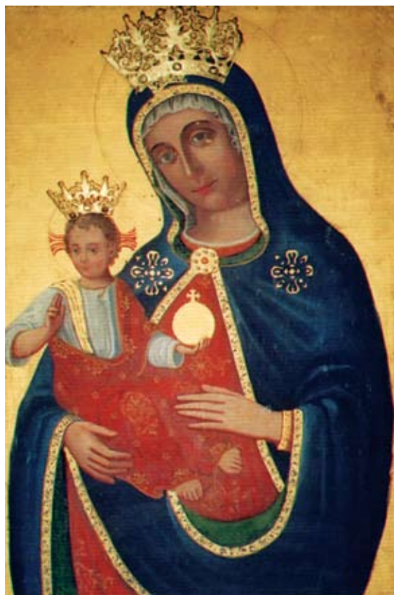
29. Filippo Naldi, Bogorodica s Djetetom , Žuljana, Župna crkva sv. Martina

Filippo Naldi, The Virgin, Žuljana, parish church of St Martin