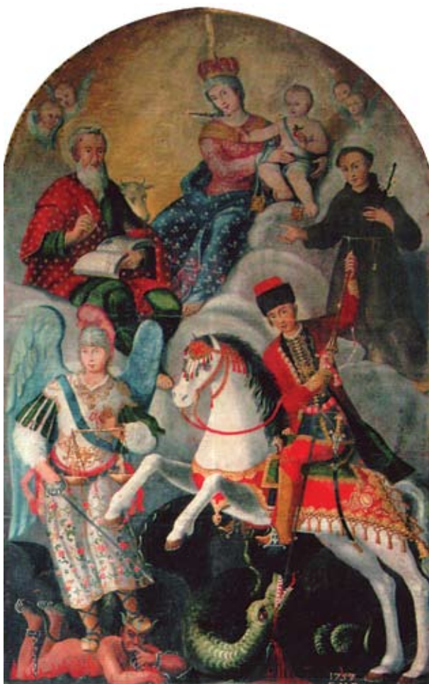
1. Filippo Naldi, Bogorodica s Djetetom i svecima , Kučiće (Omiš), Župna crkva sv. Luke

Filippo Naldi, The Virgin with Child and Saints, Kučiće (Omiš), parish church of St Lucas