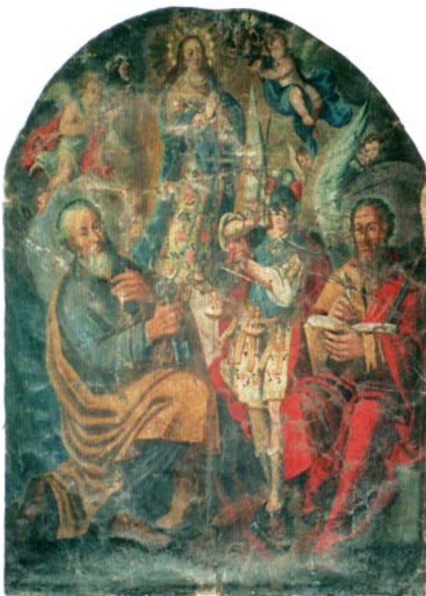
27. Filippo Naldi, Bezgrešno začéće Blažene Djevice Marije sa svecima , Trpanj, Župna crkva sv. Petra i Pavla Filippo Naldi, The Immaculate Conception with Saints, Trpanj, parish church of St Peter and St Paul