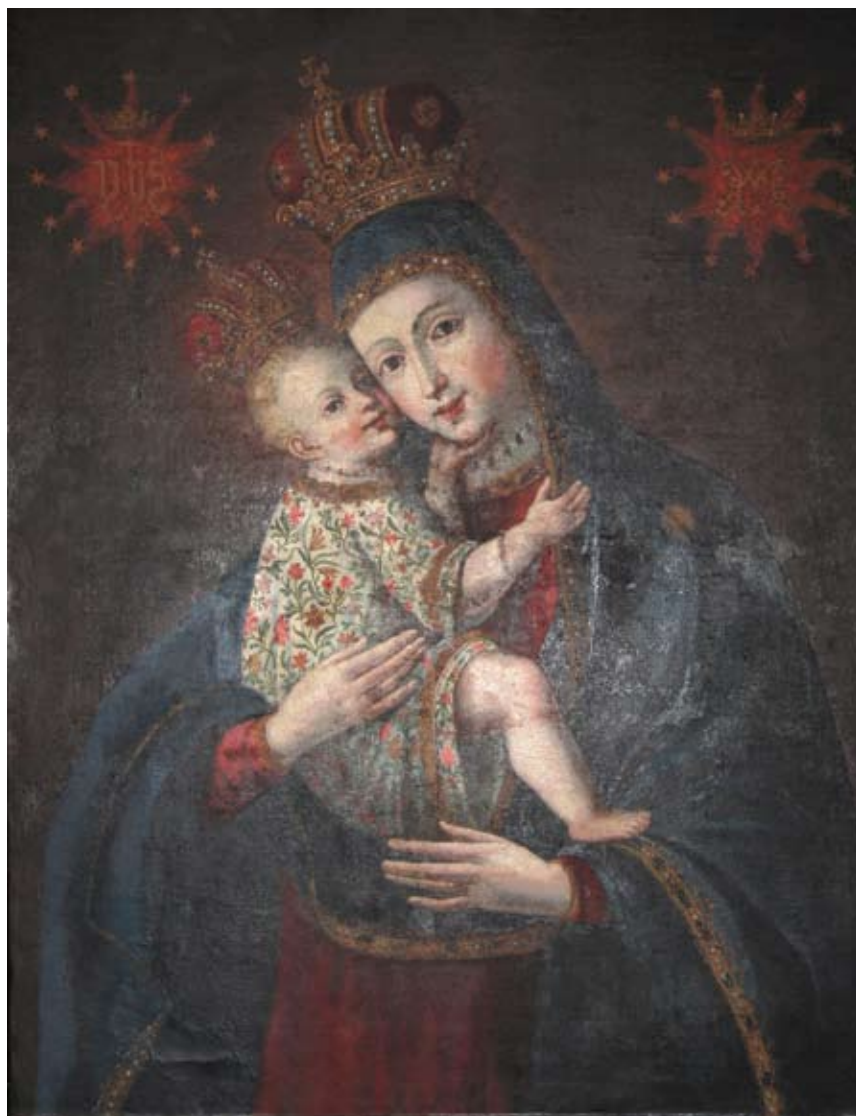
35. Bogorodica s Djetetom , Živogošće, Franjevačka crkva sv. Križa The Virgin with Child, Živogošće, Franciscan church of the Holy Cross

predaji, sliku je iz Budima donio ugledni redovnik fra Petar Karapandža (Goranci kraj Mostara, oko 1680. – Živogošće, 1765.), gdje je bio profesor teologije i filozofije na Franjevačkom učilištu, te ju je darovao samostanu u Živogošću, u kojem je proveo posljednje desetljeće svojega života (1755.–1765.). 33 Te je podatke zabilježio je 1931. godine fra Karlo Balić. Opisujući crkvu Balić navodi da je »pobočni oltar posvećen Majci Božjoj. Gospa drži u desnoj ruci Djetića. Ovu je sliku naslikao god. 1727 u Budimpešti Polikarp F. Scotus, a crkvi ju je darovao fra Petar Karapandža. To nam svjedoči natpis na zadnjem dijelu slike, koji ovako glasi: 'Donata et cordicitus commendata devotioni, et fervori religiosorum venerab: contus S. Crucis Xivogosten. Al. prov. Bosnae arg. ab ejud. Alum.= Devoto Iesu et Mrae cliente fre Petro Karapancsich SS. Th. L. Ge. Devoti mirabilem spr experientur.' Pri dnu