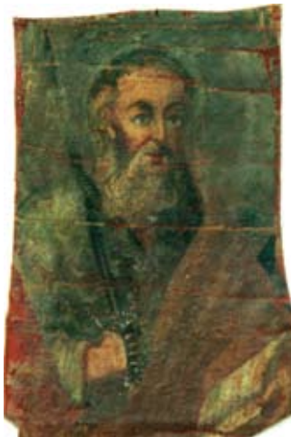
20b. Filippo Naldi, Sv. Pavao , Split, privatno vlasništvo, ulomak veće cjeline Filippo Naldi, St Paul , Split, private property, fragment of a larger unit