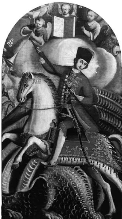
3. Filippo Naldi, Sv. Juraj , Žeževica (Omiš), Župna crkva sv. Jurja Filippo Naldi, St George, Žeževica (Omiš), parish church of St George