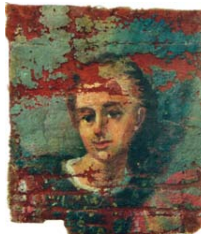
20c. Filippo Naldi, Andeo , Split, privatno vlasništvo, ulomak veće cjeline Filippo Naldi, an Angel , Split, private property, fragment of a larger unit