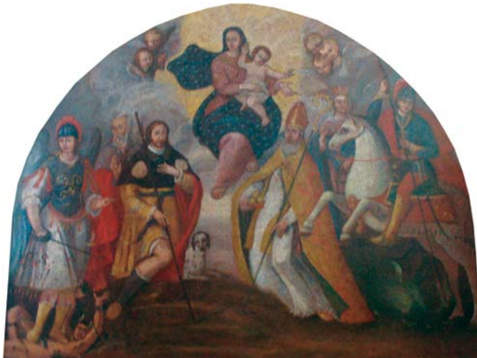
23. Filippo Naldi, Bogorodica s Djetetom, sv. Mihovilom, sv. Rokom, sv. Petrom, sv. Nikolom, i sv. Jurjem , Slivno Ravno (Neretva), Župna crkva sv. Stjepana Filippo Naldi, The Virgin with Child, St Michael, St Rochus, St Peter, St Nicholas, and St George, Slivno Ravno (Neretva), parish church of St Stephen