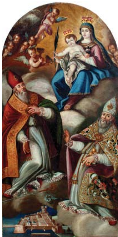
24. Filippo Naldi, Bogorodica s Djetetom, sv. Vlahom i sv. Nikolom, Janjina, Župna crkva sv. Vlaha Filippo Naldi, The Virgin with Child, St Blasius, and St Nicholas, Janjina, parish church of St Blasius