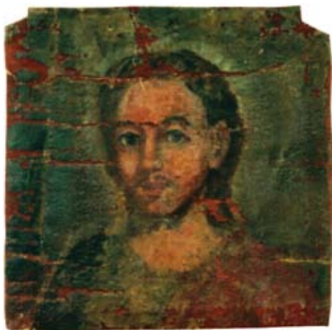
20a. Filippo Naldi, Krist , Split, privatno vlasništvo, ulomak veće cjeline Filippo Naldi, Christ , Split, private property, fragment of a larger unit