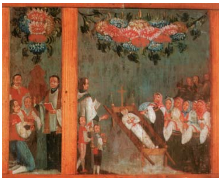
26. Filippo Naldi, Rođenje i smrt i sedam sv. Sakramenata , Tomislavovac, Župna crkva Gospe od Ružarija Filippo Naldi, Birth and Death with the Seven Holy Sacraments, Tomislavovac, parish church of Our Lady of the Rosary

lika dominira u prednjem planu slike. U ruci drži bodež. Uz nju su top i visoka okrugla kula.