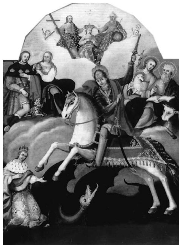
25. Filippo Naldi, Krunjenje Bogorodice sa Sv. Trojstvom, sv. Rokom, sv. Marijom Magdalenom, sv. Ivanom Krstiteljem, sv. Lukom i sv. Jurjem, Janjina (Popova luka), Crkva sv. Jurja Filippo Naldi, The Coronation of the Virgin with the Holy Trinity, St Rochus, St Mary Magdalen, St John the Baptist, St Lucas and St Georg, Janjina (Popova Luka), Church of St George

standardni natpisi koji se javljaju na ikonama: M P i ΘY (Majka Božja). Unutar Kristove aureole upisana su i sljedeća grčka slova: o ω v (Exod. 3, 14; Onaj koji jest). Aureola okružuje i Bogorodičinu glavu. Oboje su okrunjeni. Na svitku što ga Krist drži u rukama upisane su, nevjesto, grčkim slovima riječi iz Ivanova Evanđelja (Iv. 8, 12 i 6, 35): »Ja sam svjetlo svijeta: tko dolazi k meni, ne će ogladnjeti, i tko vjeruje u mene (...)« 15 Njihova je odjeća šarena, protkana bogatim pozlaćenim rubom s resama, bijelom čipkom, ljiljanovim cvijetom i ispletenim viticama, koje na Kristovoj odjeći gotovo podsjećaju na motive i odjevne predmete s narodnih nošnji u Dalmatinskoj zagori.