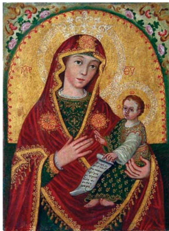
19. Filippo Naldi, Bogorodica s Djetetom , Vrgorac, Franjevačka crkva Navještenja Blažene Djevice Marije Filippo Naldi, The Virgin with Child , Vrgorac, Franciscan church of the Annunciation