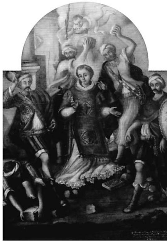
22. Filippo Naldi, Kamenovanje sv. Stjepana , Opuzen, Župna crkva sv. Stjepana Filippo Naldi, Stoning of St Stephen, Opuzen, parish church of St Stephen