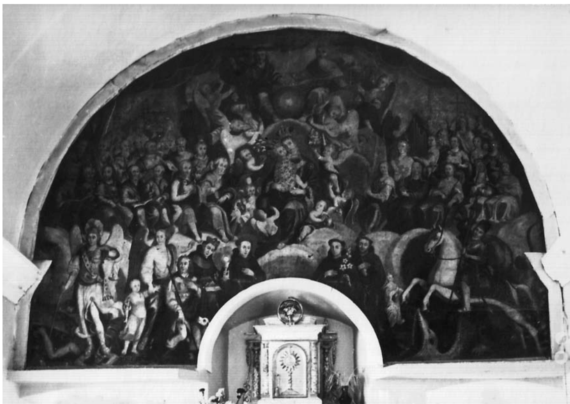
8. Filippo Naldi, Bogorodica s Djetetom, Presvetim Trojstvom i svecima , Slivno (Imotski), Župna crkva Presvetoga Trojstva

Filippo Naldi, The Virgin with Child, the Holy Trinity, and Saints, Slivno (Imotski), parish church of the Holy Trinity