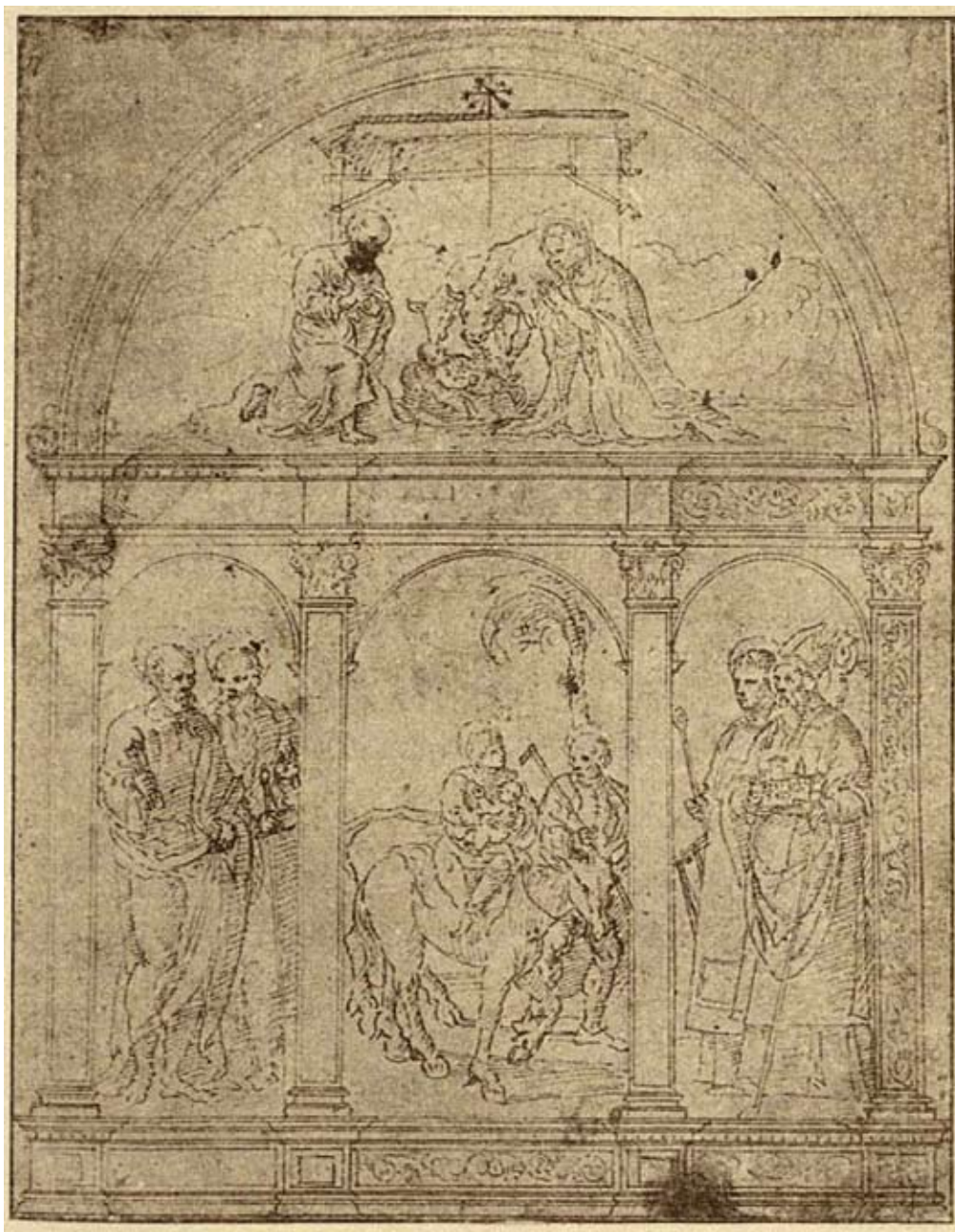
1. Crtež poliptiha , Milano, Biblioteca Ambrosiana Drawing of a polyptych, Milan, Biblioteca Ambrosiana

londonski. Ista je impostacija figure s blagim okretom tijela u stranu. Na oba su crteža tkanine misnica slično nabrane, a modeli gradova u biskupovim rukama imaju sličnu srednjovjekovnu arhitekturu s kulama i zvonnicima. Usporedbi crtanih figura svetog biskupa s košljunskim sv. Kvirinom možemo pridružiti još jedan pandan iz kataloga slikanih djela Girolama da Santa Croce. Riječ je o prikazu sv. Ivana Zlatoustog na polju oslikanih vratnica nekadašnjih orgulja u venecijanskoj crkvi S. Giovanni Crisostomo. 8 Na venecijanskoj slici biskup ima palij, misno je ruho skromnije ukrašeno, a umjesto modela grada u ruci sv. Ivan Zlatousti drži knjigu tamnih korica (sl. 3). Zsigurno nećemo pogriješiti ako navedenoj skupini