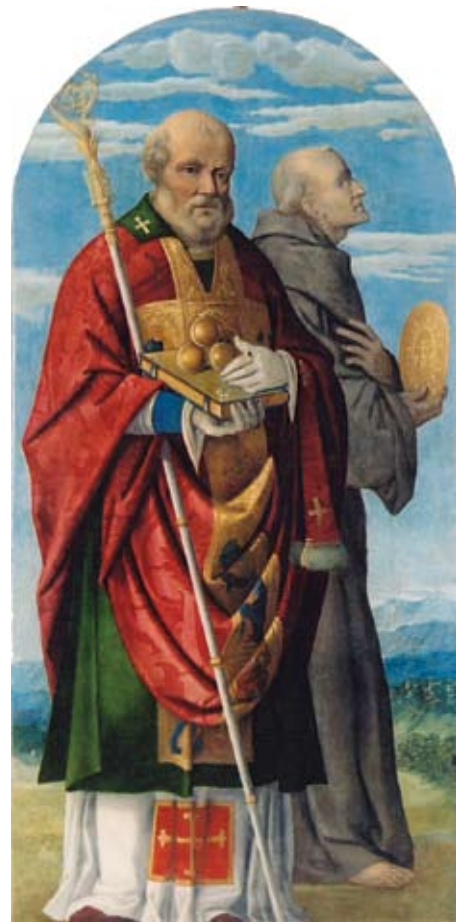
4. Sv. Nikola i sv. Bernardin Sijenski, lijevo polje triptiha, Pazin, Crkva Pohođenja Marijina St Nicholas and St Bernardino of Siena, the left field of a triptych, church of the Visitation at Pazin

ni crteža dva pilastra, čiji je dizajn s dekoracijom all'antica , vitičasto ukrašenim frizom i anđeoskim glavicama istovjetan milanskom. Nadalje, oba crteža pokazuju sličan crtački duktus s linearno obrubljenim figurama i šrafiranim sjenama. Izražajnijim, tamnijim sjenama, koje su postignute upotrebom kista i vode preko šrafiranih zatamnjenja, na londonskom je crtežu stvorena predodžba treće dimenzije i plastičnosti prikazanih likova. Na milanskom crtežu upotreba kista je izostavljena, a sjene su općenito sumarnije naznačene. Do danas nije poznato nijedno cjelovito sačuvano djelo koje bilježi nastanak u radionici Santa Croce, a čija bi se izvedba temeljila na milanskom pripremnom crtežu poliptiha. No, kako je uočio Tomić na primjeru londonskog crteža, »na njemu se mogu pronaći dijelovi rasuti na različitim oltarnim slikama.« 9