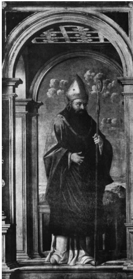
3. Sv. Ivan Zlatousti, polje oslikanih vratnica orgulja, Venecija, San Giovanni Crisostomo St John Chrysostom, part of a painted organ frame, Venice, San Giovanni Crisostomo

St Quirinus, St Catherine of Alexandria, and St John the Baptist, the left field of a polyptych from the main altar, Franciscan church of the Annunciation at Košljun