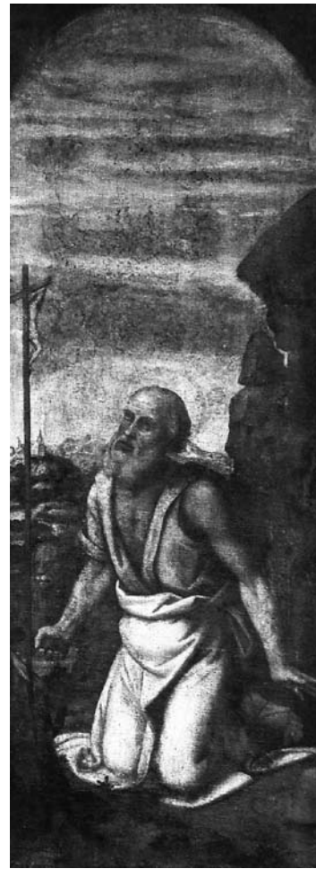
8. Sv. Jeronim , desno polje triptiha, Stari Grad na Hvaru, Župna crkva sv. Stjepana

The Holy Trinity, a church standard, Milan, Civiche Raccolte d'Arte del Castello Sforzesco.