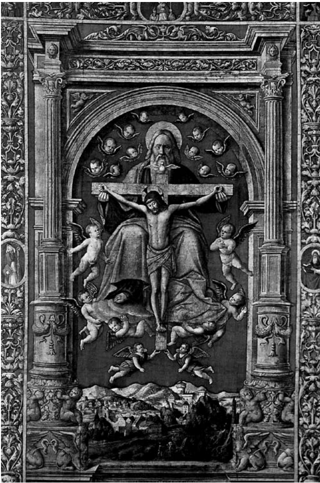
7. Sveto Trojstvo , crkvena zastava, Milano, Civiche Raccolte d'Arte del Castello Sforzesco

The Holy Trinity, a church standard, Milan, Civiche Raccolte d'Arte del Castello Sforzesco.