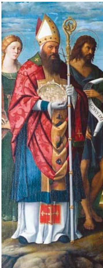
2. Sv. Kvirin, sv. Katarina Aleksandrijska i sv. Ivan Krstitelj, lijevo polje poliptiha glavnog oltara, Košljun, Franjevačka crkva Navještenja Marijina

St Quirinus, St Catherine of Alexandria, and St John the Baptist, the left field of a polyptych from the main altar, Franciscan church of the Annunciation at Košljun