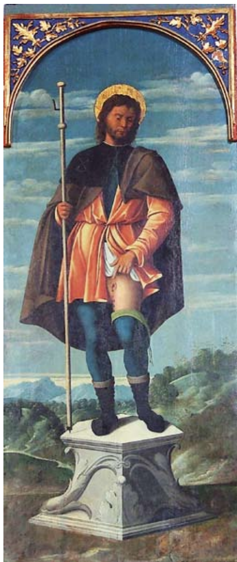
10. Sv. Rok , dio rastavljenog poliptiha, Lopud, Crkva Gospe od Spilica

St Rochus, part of a dismembered polyptych, church of Our Lady of Spilice on Lopud.