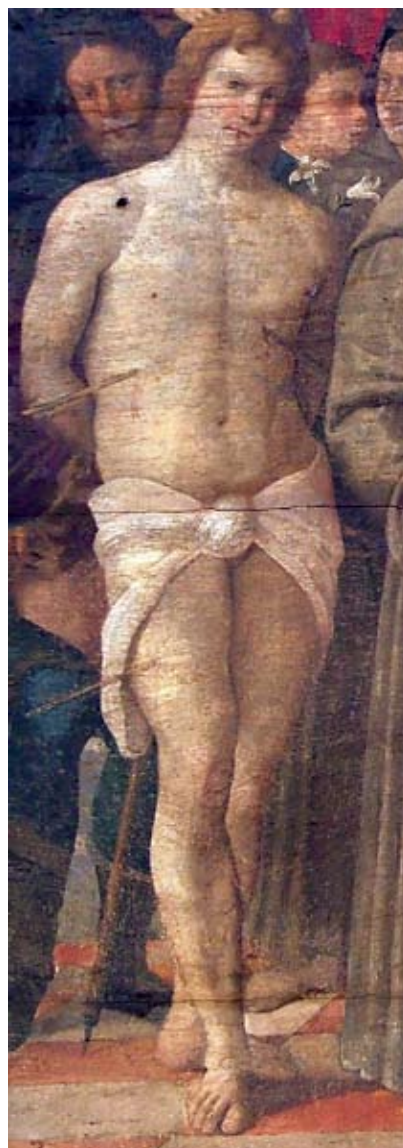
11. Sv. Sebastijan , detalj slike, Blato na Korčuli, Župna crkva Svih Svetih

St Rochus, part of a dismembered polyptych, church of Our Lady of Spilice on Lopud.