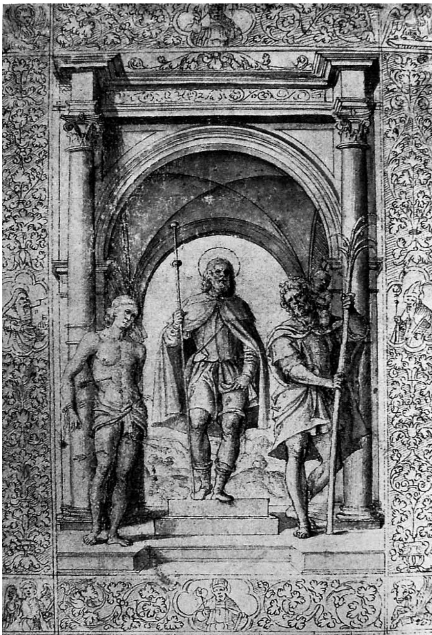
9. Sv. Rok, sv. Sebastijan i sv. Kristofor; crtež, London, British Museum St Rochus, St Sebastian, and St Christopher, a sketch, London, British Museum.

ukrašenim frizom i dekorativnim elementima koji se nastavljaju iznad gređa. Unutar lučnog otvora naslikan je prizor sa sakralnim likovima. Za lik Bogorodice s harlemskog crteža možemo reći kako pripada istoj tipologiji prikaza Bogorodice s londonskog Uznesenja . Za razliku od londonskog prikaza, gdje Bogorodica ima obje ruke raskriljene, na harlemskom crtežu Bogorodica ima ruke sklopljene u molitvi i općenito se njezina figura doima nešto manje elegantnom. Vjerujem da obje figure Bogorodice, poglavito onu s londonskog crteža, možemo prepoznati na predeli košljunskog poliptiha. Lik sv. Jeronima koji kleči pod križem s kamenom u ruci, kako je uočio još i Meijer, možemo povezati s Girolamovom slikom