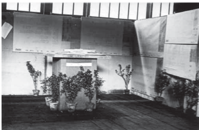
4. Izložba natječajnih radova za Zakladnu i kliničku bolnicu u Zagrebu. Nagrađeni projekt E. Weissmanna, 1931. (Arhiv Ernesta Weissmanna, kutija 7.1.)

The exhibition of competition designs for the Foundation and Clinical Hospital in Zagreb. The awarded design by E. Weissmann, 1931 (Ernest Weissmann Archive, box 7.1)