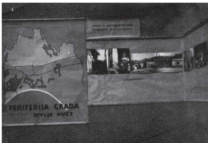
6. Izlaganje Radne grupe Zagreb »Kuća i život« na Četvrtoj izložbi »Zemlje«, 1932. (VLADIMIR ČEPULIĆ, Naša nastojanja u borbi protiv tuberkuloze, Zagreb, 1940., 68–69)

6. The designs of Zagreb Working Group »Kuća i život« [House and Living] at the Fourth Exhibition of »Zemlja« in 1932 (Vladimir Čepulić, Naša nastojanja u borbi protiv tuberkuloze [Our efforts in fighting tuberculosis], Zagreb, 1940, 68–69)