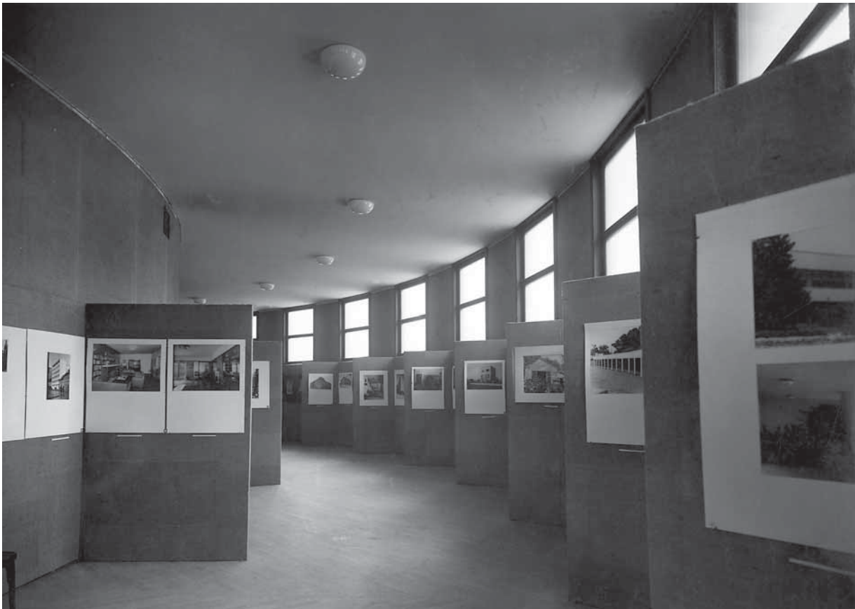
8. Arhitektonski odjel izložbe »Pola vijeka hrvatske umjetnosti« u Domu likovne umjetnosti 1938.–1939. g. (HAZU, Arhiv za likovne umjetnosti, F/62–2)

Architectural department of the exhibition on »Half a Century of Croatian Art« at the Artists' Centre, 1938–1939 (Croatian Academy of Arts and Sciences, Visual Arts Archive, F/62–2)