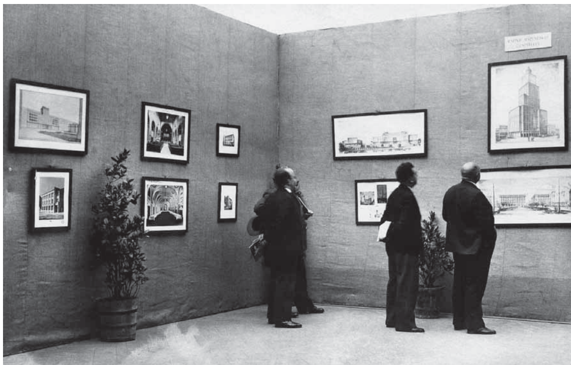
3. Međunarodna »Graditeljska izložba«, 1930. (MGZ, 14.323 fot.) The international »Architectural Exhibition« of 1930 (MGZ, 14.323 fot.)

torova ugleda. Autori nagrađenih projekata i članovi žirija nisu prešutjeli kritike, nego su se izravno obratili javnosti i obrazložili svoja stajališta. 31