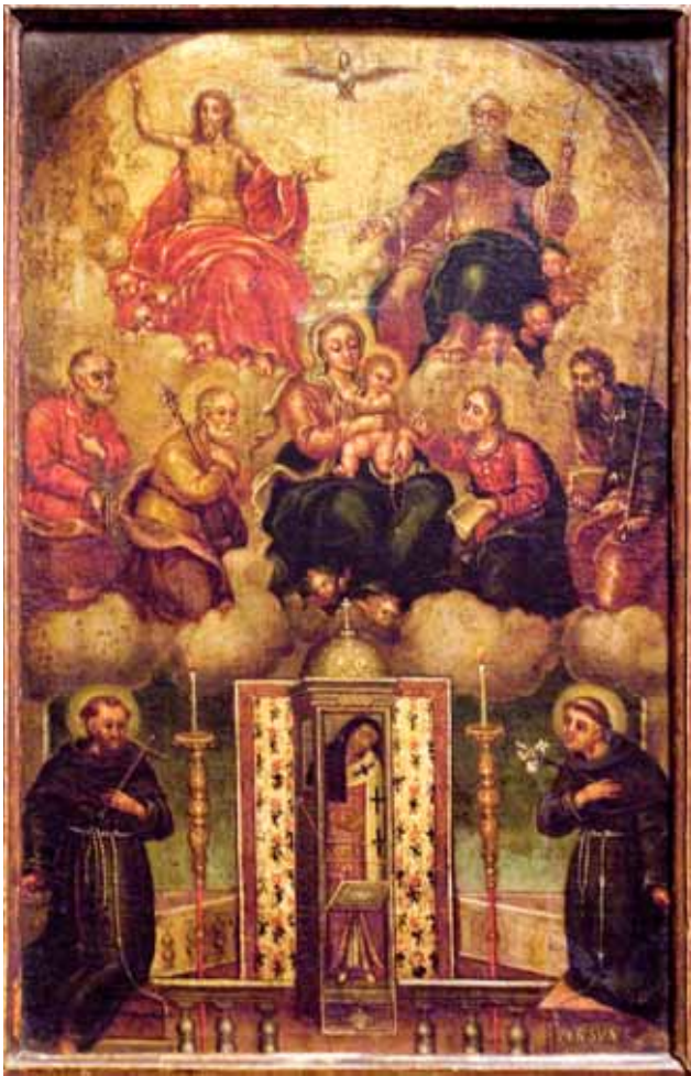
6. Sv. Spiridon s Bogorodicom, svecima i Svetim Trojstvom, ulje na platnu, 39,5 x 63,5 cm, Samostan sv. Nikole, Trogir St Spyridon with the Virgin, Saints and Holy Trinity, oil on canvas, 39.5 x 63.5 cm, Monastery of St Nicholas, Trogir

crkvenom koncilu u Niceji. 26 Po mojem mišljenju upravo su razlozi njihova sudjelovanja na tom koncilu i uvjerenja koja su tu branili osnovna poveznica svih prikazanih ličnosti na ovoj ikoni. Nastup sv. Spiridona i sv. Nikole na nicejskom koncilu označava otpor prema Arijevom učenju i čvrsto zastupanje dogme o Svetome Trojstvu. U širem smislu time se simbolizira čvrstina vjere u temeljnu kršćansku dogmu. Upravo to s njima povezuje i trećega svetog biskupa – sv. Atanazija Velikog (Aleksandrijskog). I on je njihov suvremenik 27 i kao predstavnik Aleksandrijske patrijaršije također je sudjelovao na spomenutom koncilu u Niceji. U raspravama o Arijevom učenju i on je bio jedan od utjecajnih i žestokih sudionika koji mu se suprotstavio i osudio njegovo krivovjerje, te tako dobiva značenje branitelja kršćanske dogme o Sv. Trojstvu.