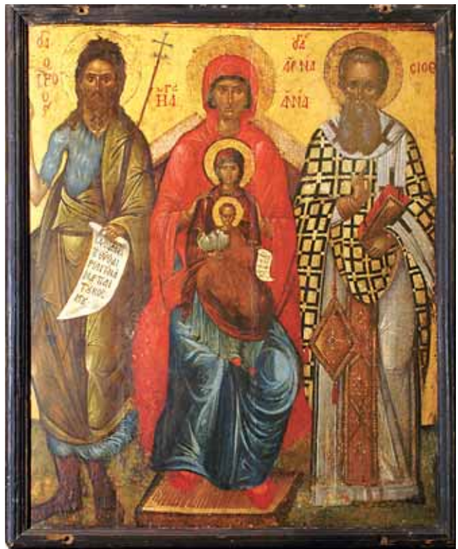
7. Sv. Ana s Bogorodicom i Kristom i sv. Ivanom Krstiteljem i Atanazijem Aleksandrijskim, tempera na dasci, 83,8 x 100,5 cm, Zbirka ikona Bratovštine Svih svetih u Korčuli St Anne with the Virgin and Christ and John the Baptist and Anastasius of Alexandria, tempera on board, 83.8 x 100.5 cm, Collection of Icons of the Confraternity of All Saints in Korčula

Dok, kao što vidimo, zajednički prikazi sv. Spiridona i sv. Nikole nisu rijetki, primjera zajedničkog prikazivanja sv. Spiridona ili groba sv. Spiridona sa sv. Atanazijem Velikim na našim prostorima, koliko mi je poznato, nema. Ipak, jedna ikona iz zbirke Bratovštine svih svetih u Korčuli prikazuje sv. Atanazija Velikog uz sv. Anu s Bogorodicom i Kristom, te Ivana Krstitelja. (sl. 4) Konačno značenje te slike