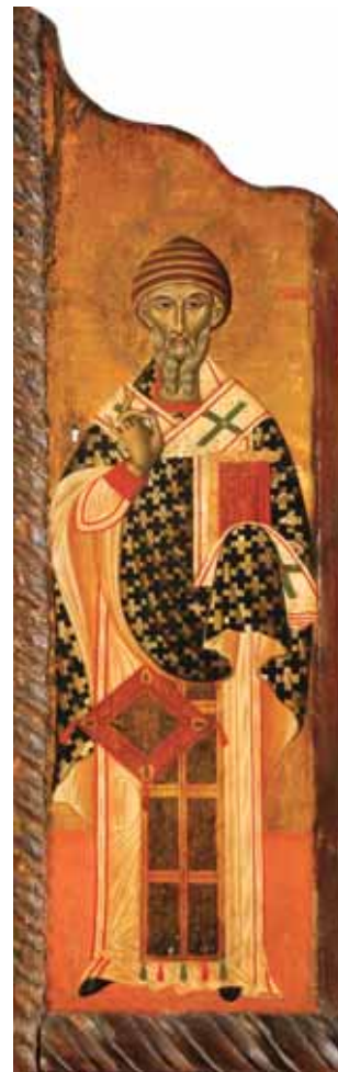
5. Sv. Spiridon, tempera na dasci, 111 x 35 cm, Strossmayerova galerija starih majstora HAZU, inv. br. SG-526.

St Gregory of Nazianzus and St Basil the Great, tempera on board, 111 x 75 cm, Croatian Academy Strossmayer Gallery of Old Masters, inv. no. SG-525