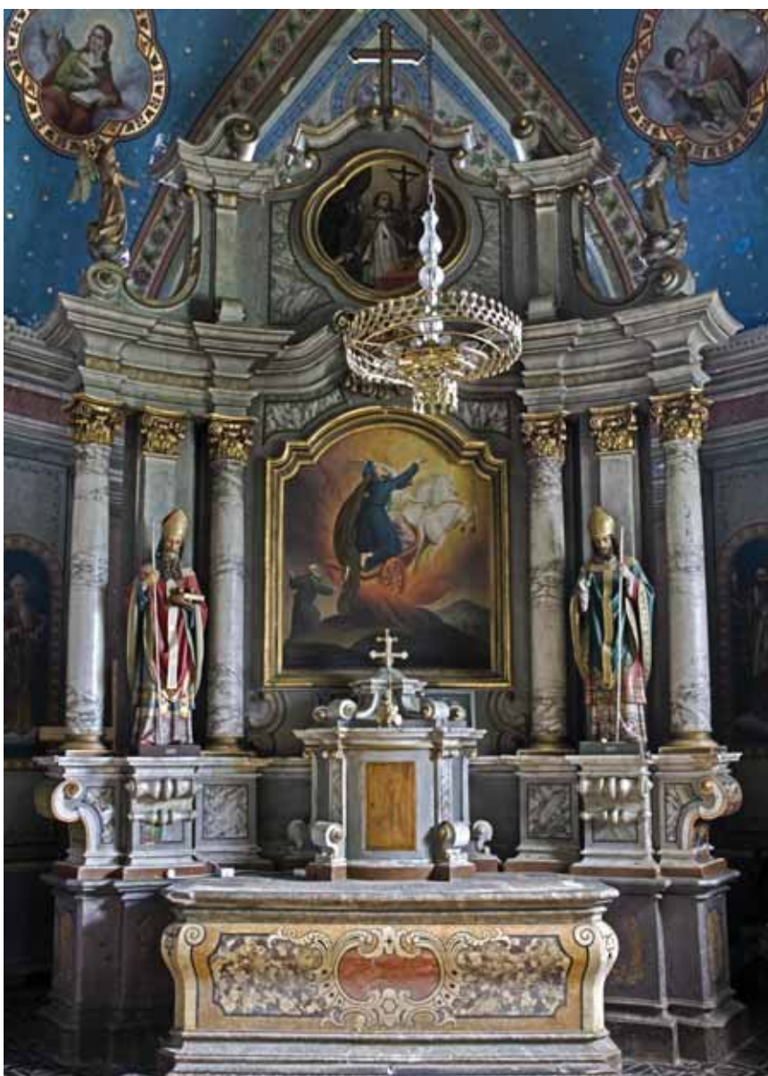
8. Lipnik, župna crkva sv. Ilije, glavni oltar, 1760.

Lipnik, parish church of St Elijah, the main altar, 1760