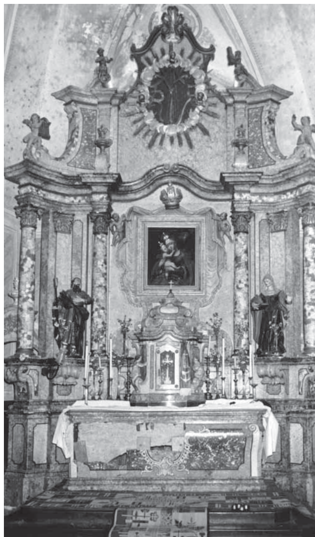
12. Sotin, župna crkve Blažene Djevice Marije, glavni oltar, 1767.