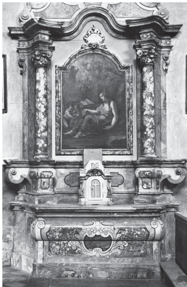
4. Maja, župna crkva sv. Ilije, oltar sv. Magdalene, 1758. Maja, Parish church of St Elijah, altar of St Magdalene, 1758