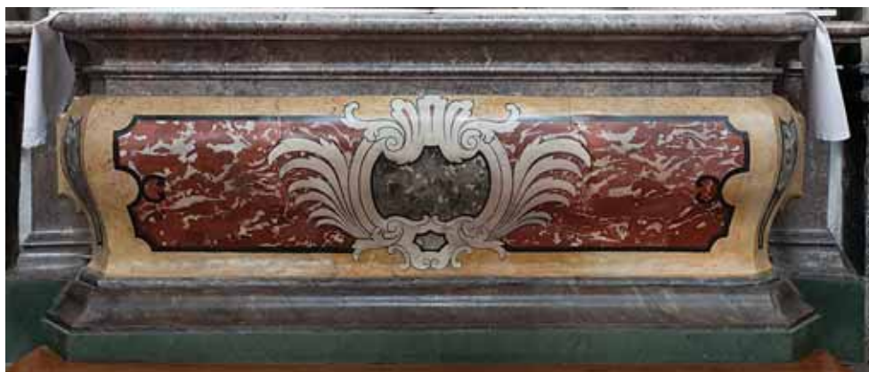
16. Ljubljana, uršulinska crkva sv. Trojice, stipes oltara sv. Augustina (foto: Paolo Mofardin, 2010.)

Ljubljana, Ursuline church of Holy Trinity, the altar of St Ursula