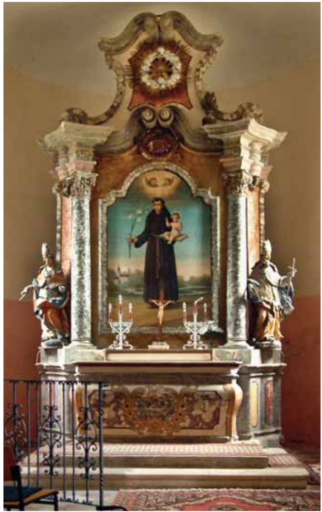
3. Blaškovec, kapela sv. Antuna Padovanskog, oltar sv. Antuna Padovanskog (izvorno sv. Nikole), 1756.

Zagreb, interior of the Cathedral after the earthquake, altar of St Nicholas