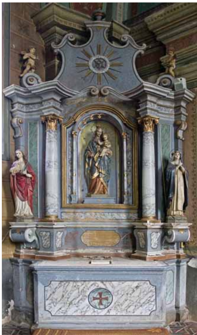
11. Lipnik, župna crkva sv. Ilije, oltar Bogorodice Bezgrešne, 1775. (foto: Paolo Mofardin, 2008.)

Lipnik, parish church of St Elijah, altar of the Immaculate Virgin, 1775