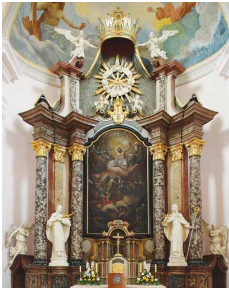
6. Požega, župna crkva sv. Terezije, glavni oltar, 1763.

Sražeman, parish church of St Michael, altar of St Isidore, around 1760