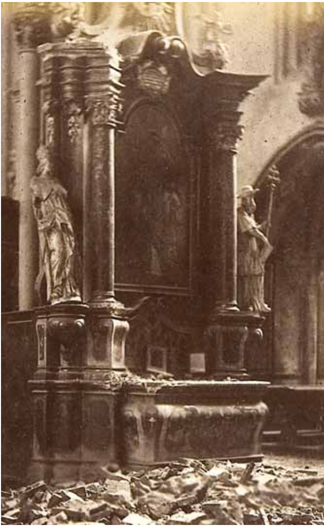
2. Zagreb, unutrašnjost katedrale nakon potresa, oltar sv. Nikole

Zagreb, interior of the Cathedral after the earthquake, altar of St Nicholas