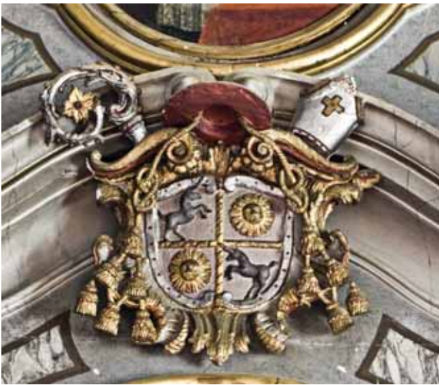
9. Lipnik, župna crkva sv. Ilije, glavni oltar: stipes i svetohranište, (foto: Paolo Mofardin, 2008.)

Lipnik, parish church of St Elijah, the main altar: stipes and the tabernacle