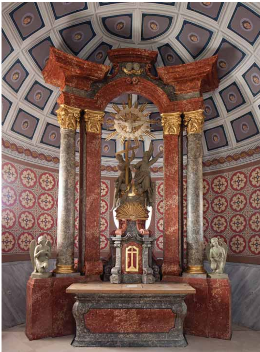
14. Daruvar, župna crkva sv. Trojstva, glavni oltar, 1770. Daruvar, parish church of Holy Trinity, the main altar, 1770

župnoj crkvi. Oltar nije sačuvan u izvornom obliku, a natuknice za rekonstrukciju njegova izvornog izgleda nalazimo u vizitacijama i suvremenim opisima. Crkva je bila privatna kapela obitelji grofa Antuna Jankovića i izvorno centralna građevina. Gradila se od 1764. do 1770, 57 a oltar izrađen od gipsa u vizitacijama je prvi puta zabilježen 1771. 58 Vizitacije iz godine 1780. 59 daju opširan opis oltara, iz kojeg doznajemo da je bio smješten u središtu crkve i imao tlocrt u obliku trokuta ( magnificum triangularis figura ). Imao je tri stupa koji su