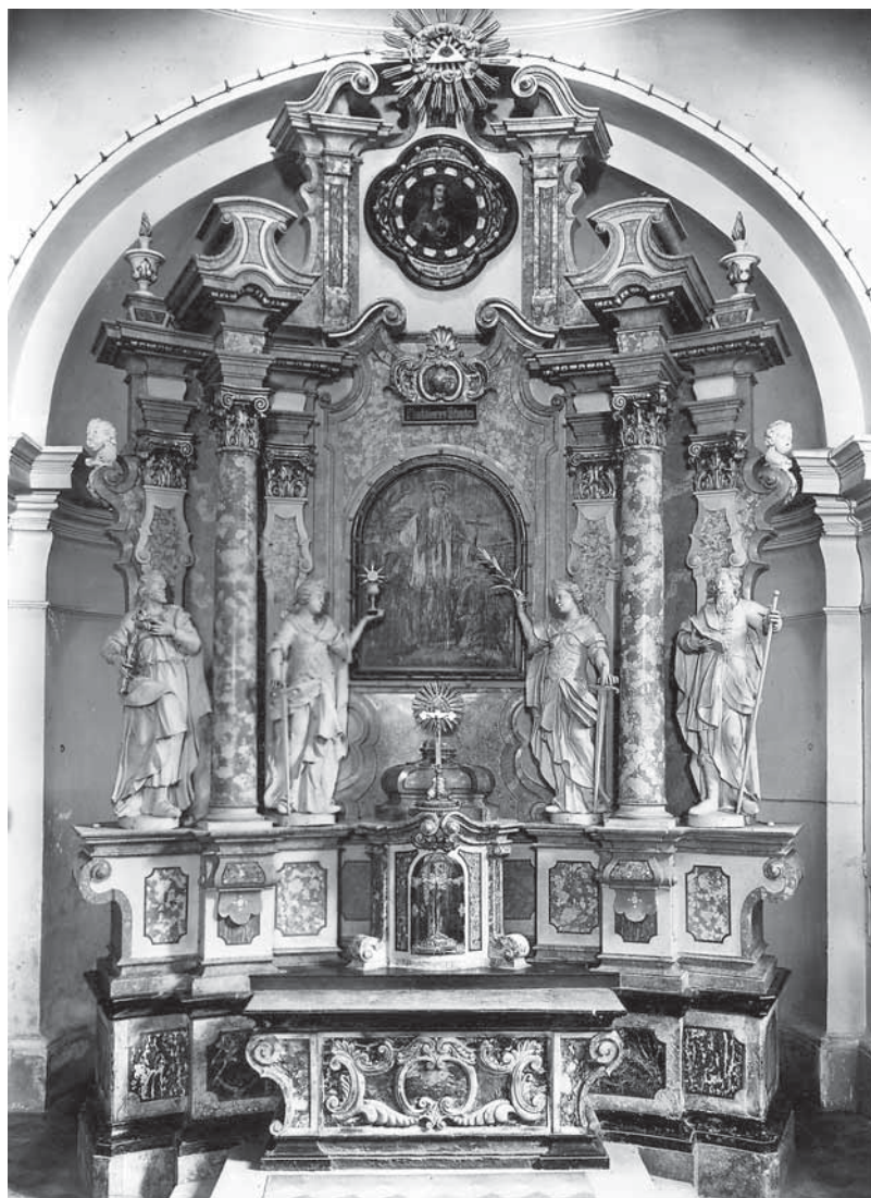
13. Zagreb, crkva Sv. Franje Ksaverskog, glavni oltar, 1757.

Pojedinim obilježjima oltarima ove skupine srodan je oltar podignut 1757. godine u svetištu nekadašnje isusovačke crkve sv. Franje Ksaverskog u Zagrebu (sl. 13.). 53 Osnovnom oltarnom dispozicijom odgovara glavnim oltarima u Požegi, Lipniku i Sotinu, a dodirne točke nalazimo i u karakterističnom oblikovanju kapitela i voluta, kao i u motivu prelomljenog profila konzola stupova koji u jednostavnijoj izvedbi nalazimo na oltaru u Maji. Zasebnu poziciju unutar skupine ovom oltaru daju raznovrsniji repertoar i složenija razrada ornamentalnih motiva. Na vanjskim krajevima retabla nalaze se kipovi sv. Josipa i Joakima, dok su uz palu kipovi sv. Katarine i sv. Barbare. Kipovi su drveni i monokromno obojeni, u nastojanju da se dobije privid mramornog materijala. Oltar je tijekom vremena doživio više izmjena. Izvorni stipes još je u 18. stoljeću zamijenjen mramornim, nestali su kipovi anđela koji su držali sliku u atičkom zaključku, kao i kipovi anđela koji su se nalazili uz gloriolu s Božjim Okom na vrhu oltara, a sredinom prošlog stoljeća promijenjene su i oltarne slike. 54 Unatoč tome, oltar se doima kao zaokružena cjelina i uz požeški je oltar sv. Terezije najraskošniji sačuvani primjer štukomramornog oltara u sjevernoj Hrvatskoj