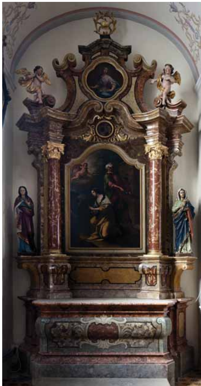
18. Nazarje, franjevačka crkva Navještenja Marijina, oltar sv. Barbare

Nazarje, Franciscan church of Annunciation, altar of St Barbara