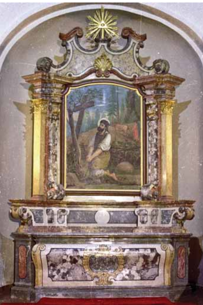
5. Stražeman, župna crkva sv. Mihovila, oltar sv. Izidora, oko 1760.

Sražeman, parish church of St Michael, altar of St Isidore, around 1760