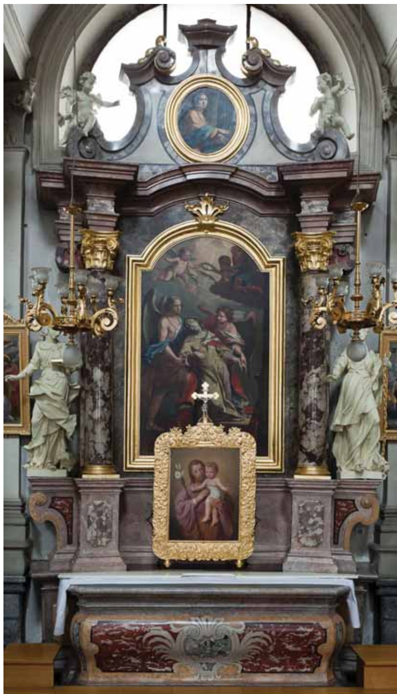
15. Ljubljana, uršulinska crkva sv. Trojice, oltar sv. Uršule, (foto: Paolo Mofardin, 2010.)

Ljubljana, Ursuline church of Holy Trinity, the altar of St Ursula