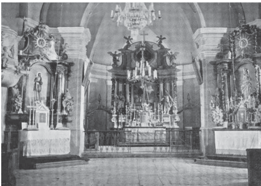
7. Lipnik, župna crkva sv. Ilije, pogled prema svetištu

Lipnik, parish church of St Elijah, view of the shrine