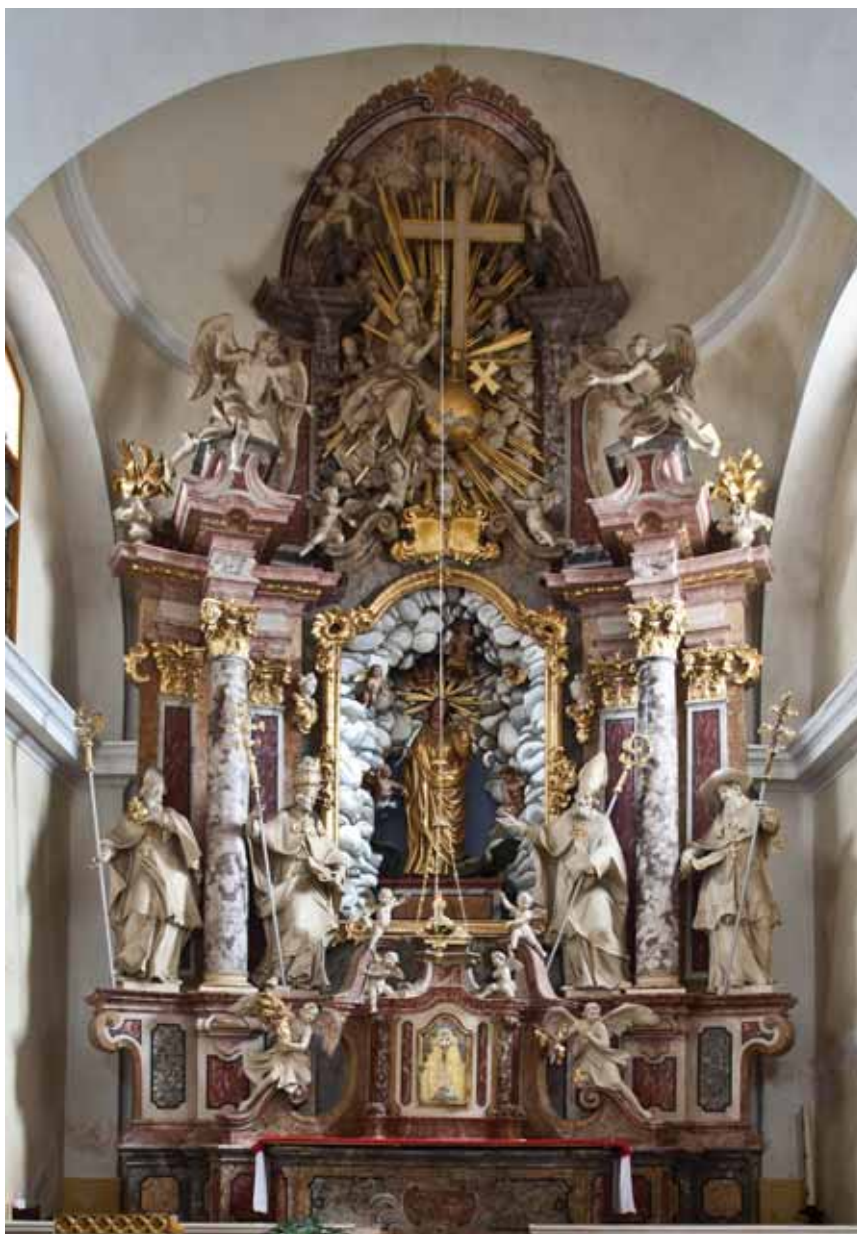
19. Golo, župna crkva sv. Margarete (Marjete), glavni oltar (nekoć glavni oltar u cistercitskoj crkvi u Kostanjevici na Krki), (foto: Paolo Mofardin, 2011.)

Osim promijenjenih stilskih pozicija, razlog tomu vjerojatno treba tražiti i u izmjenama i propadanju tijekom vremena, što je zatimilo njihovu izvornu kakvoću. Neprepoznavanje i nedostatak interesa potrajat će i kroz 20. stoljeće, kada pozornost istraživača prvenstveno privlače brojčano neusporedivo više zastupljena oltaristika i skulptura u drvu, kao i tradicionalno visoko cijenjeni radovi u mramoru čijim su primjerima, doduše, nerijetko realizirani i znatno viši kreativni dosezi. Tako se, unatoč svojevremenoj ekskluzivnosti narudžbi štu-