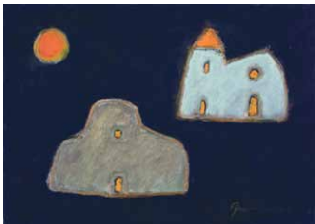
Jakov Bratanić, Sa Hvara, bunja i crkvice , 1976., Hrvatski muzej naivne umjetnosti

Jakov Bratanić, From Hvar, stone shelter and church , 1976, Croatian Museum of Naive Art