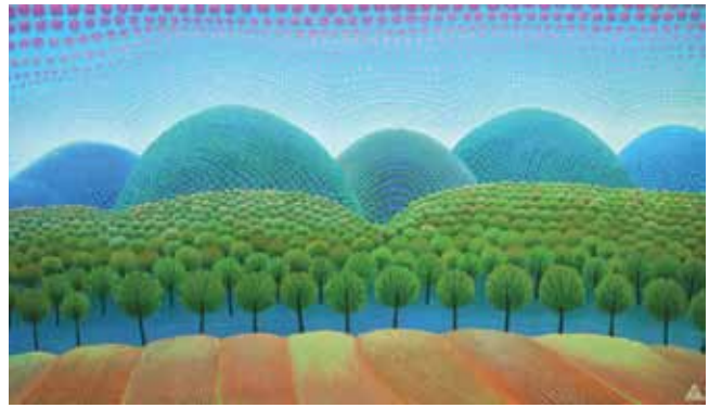
Ivan Rabuzin, Na bregovima – prašuma , 1960., Hrvatski muzej naive umjetnosti

Kao eminentni majstor podjednako pisane i izgovorene riječi, s interesima na najraznorodnijim područjima ljudskog stvaralaštva – najčešće, dakako, u okrilju književne i likovne sfere – Maroević bijaše i jest gotovo idealan interpret, sjajan tekstopisac, govornik i promotor, jedan od ponajboljih i najangažiranijih, najaktivnijih na hrvatskoj kulturnoj i umjetničkoj sceni posljednjih desetljeća. Uvijek je imao i ima nevjerovatnu sposobnost sinteznog