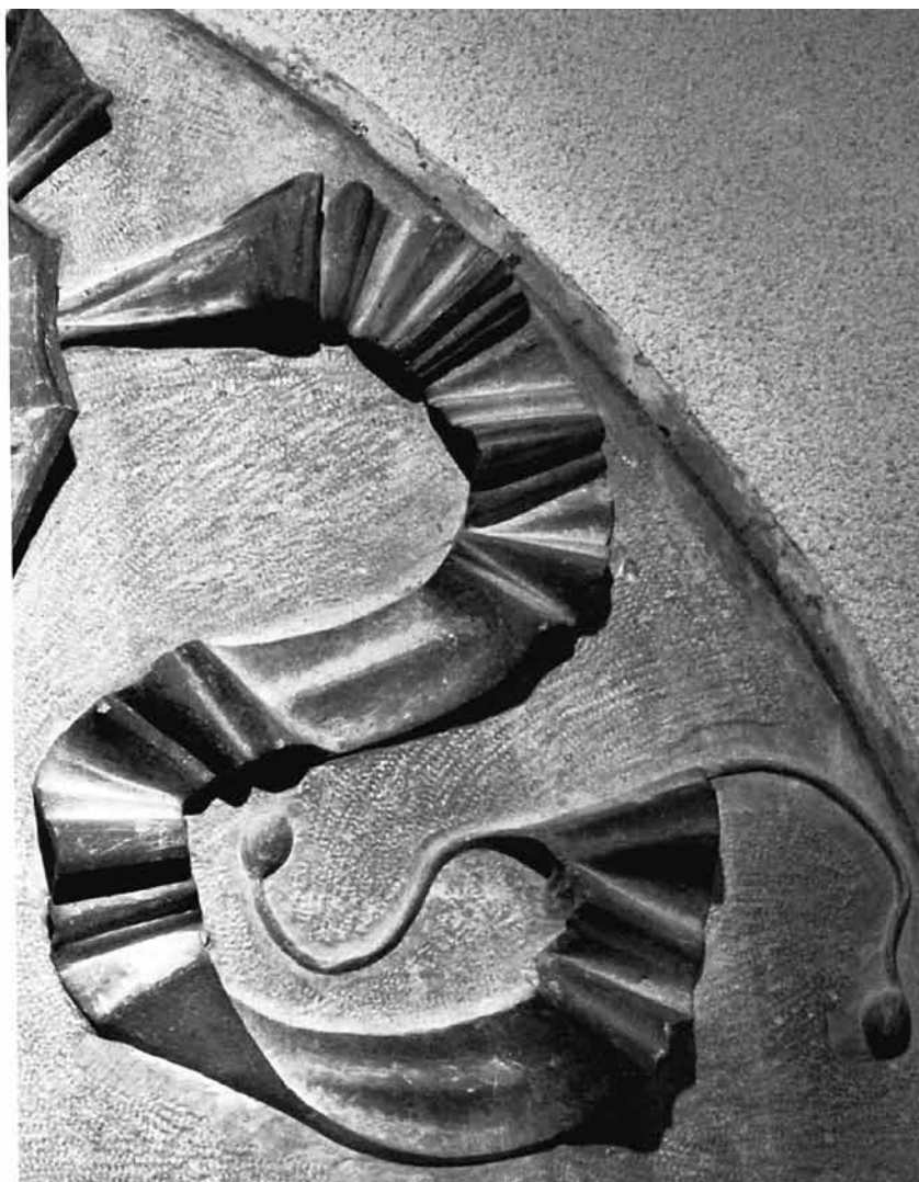
Reljef s prikazom kralja Matije Korvina, Povijesni muzej, Budimpešta, detalj Relief depicting King Matthias Corvinus, Budapest History Museum, detail