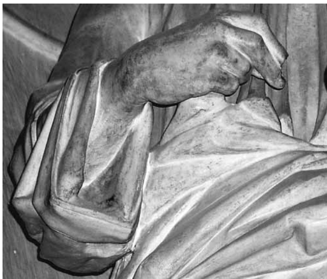
Sv. Ivan Evanđelist, kapela sv. Ivana Trogirskog, Trogir, detalj ruke St John the Evangelist, Chapel of St John of Trogir, Trogir Cathedral, detail of a hand