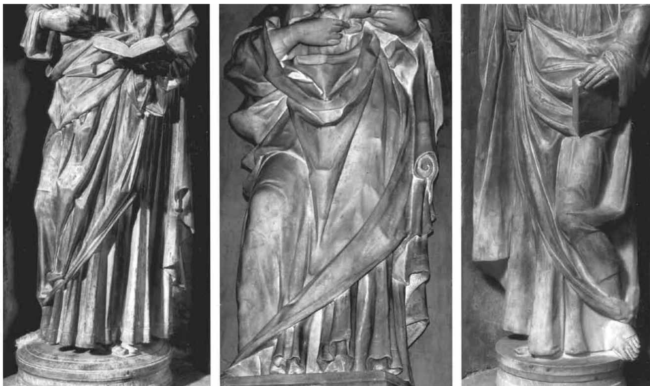
Sv. Ivan Evanđelist , kapela sv. Ivana Trogirskog, trogirski katedrala, donji dio kipa St John the Evangelist, Chapel of St John of Trogir, Trogir Cathedral, lower part of the statue