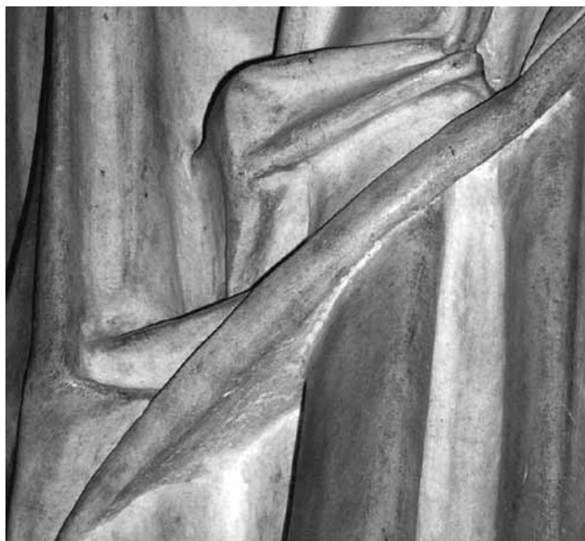
Sv. Ivan Evanđelist, kapela sv. Ivana Trogirskog, trogirska katedrala, detalj odjeće

Angel on the left side of the Resurrection scene, relief from the tomb of Paul II, Vatican Grottoes, detail of clothing