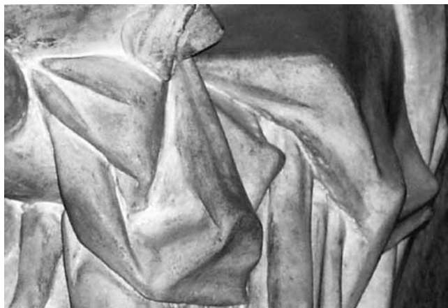
Sv. Ivan Evanđelist, kapela sv. Ivana Trogirskog, trogirska katedrala, detalj odjeće

Angel on the right side of the Resurrection scene, relief from the tomb of Paul II, Vatican Grottoes, detail of clothing