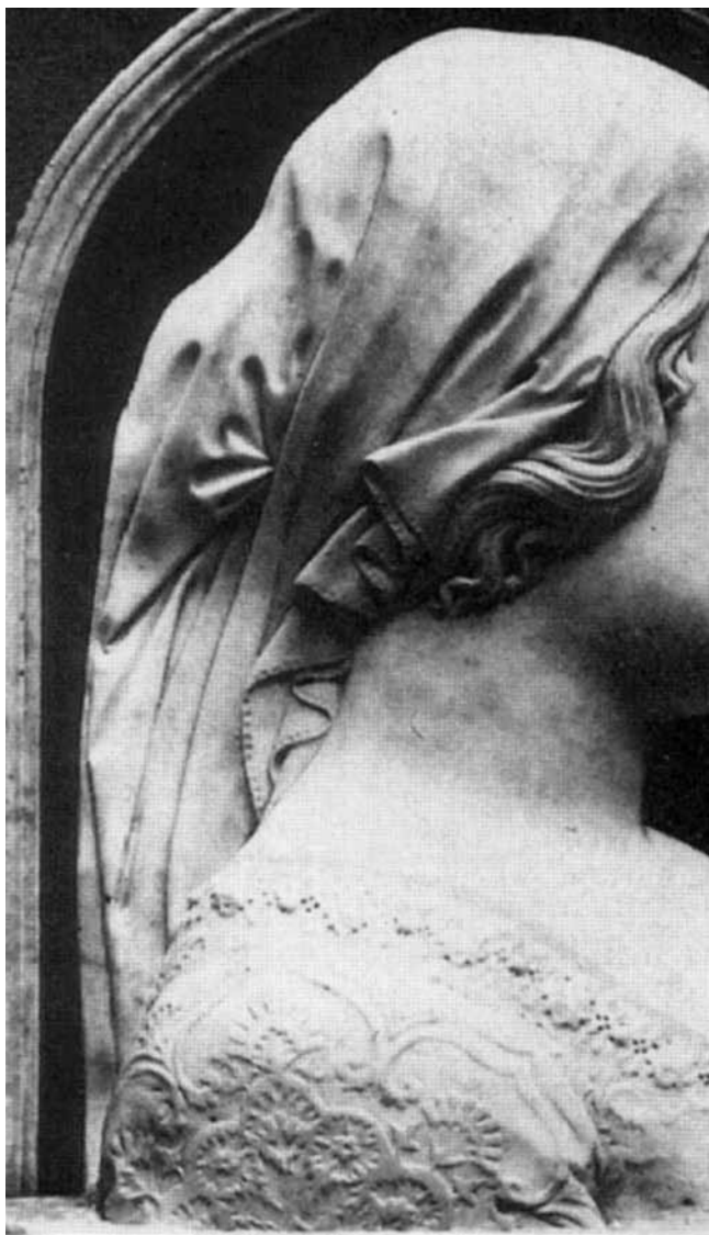
Kraljica Beatrica Aragonska, Povijesni muzej, Budimpešta, detalj reljefa Queen Beatrice of Aragon, Budapest History Museum, detail of the relief

Dekorativeni motiv trake s prelomljenim naborima u skromnijoj varijanti ponavljaju početkom 16. stoljeća i dalmatinski klesari povodeći se vjerojatno za Duknovićem. 20 Isti motiv isklesao je 1516. godine majstor Johannes Fiorentinus na grobnoj ploči biskupa Jana Łaskija u katedrali u Gnieznom. 21 S naborima razdvojenima ravnim linijama izvijaju se trake i na bazi tabernakula u staroj župnoj crkvi u Pešti. 22 Trake, tako slične onima kakve kleše Duknović, isklesane su, primjerice, uz vijenac s grbom i uz glave sfinga na propovjedaonici katedrale u Pratu. 23