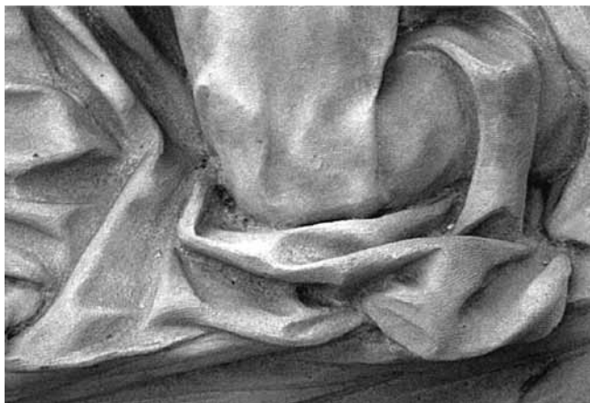
Desni anđeo na reljefu Uskrsnuća s grobnice pape Pavla II., vaticanske Grotte, detalj odjeće

Angel on the right side of the Resurrection scene, relief from the tomb of Paul II, Vatican Grottoes, detail of clothing