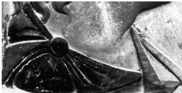
Reljef s prikazom humanista, Mala palača Cippico, Trogir, detalj Relief depicting a humanist, Small Cippico Palace, Trogir, detail