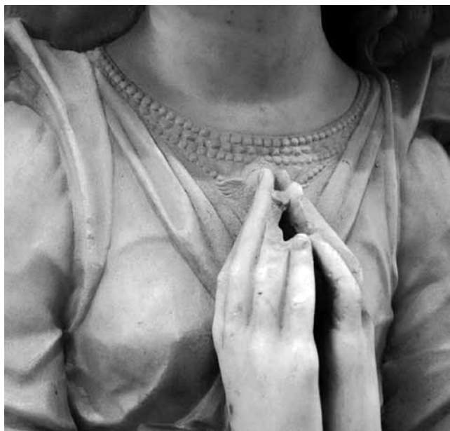
Personifikacija Nade, reljef s grobnice pape Pavla II., vatikanske Grotte, detalj reljefa Personification of Hope, relief from the tomb of Paul II, Vatican Grottoes, detail of the relief