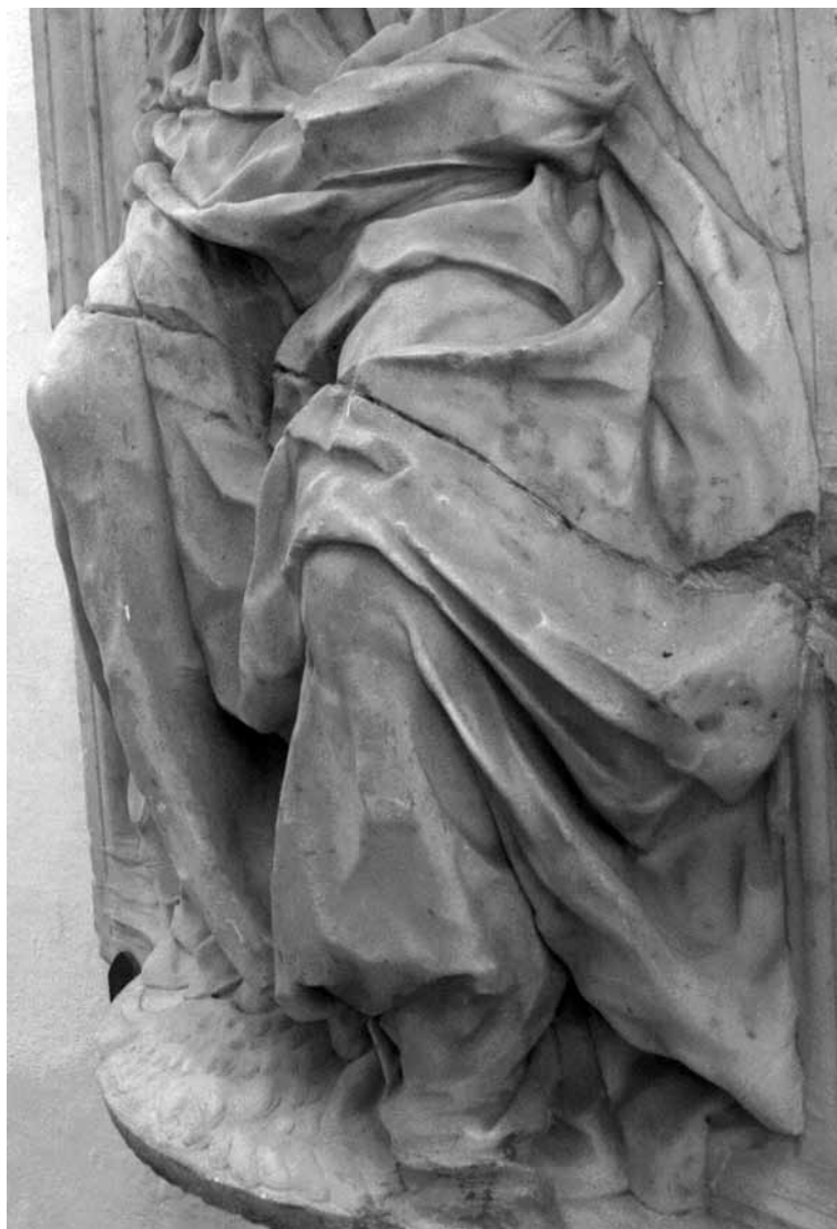
Personifikacija Nade, reljef s grobnice pape Pavla II., vatikanske Grotte, Vatikan, Rim, detalj odjeće

nosti zbog stilizacija i smisla za red (slijedimo ideje Ernesta Hansa Gombricha), (pre)naglašenoj kod Duknovića, koji djeluje nota bene u razdoblju renesanse, kada se cijenio ponajviše mimetički pristup: slika kao otvoreni prozor, vjerna kao odraz na vodi... Vjerojatno je stoga Duknovićevo kiparstvo moglo izazivati udivljenje, ali i nerazumijevanje. Možda zbog toga nisu bili prihvaćeni uklonjeni reljefi i kipovi koje je isklesao za bratovštinu sv. Marka u Veneciji; ugovor je sklopljen 22. listopada 1498. godine, a raskinut 2. veljače 1500., jer se kiparu zamjeralo da se nije držao modela u vosku. 5 Kako se na povijest umjetnosti gleda unatrag s očista suvremenosti, pri čemu ulogu igra i faktor »izbora po srodnosti«, Duknović postaje osobito zanimljiv s obzirom na proživljena iskustva apstraktnog kiparstva.