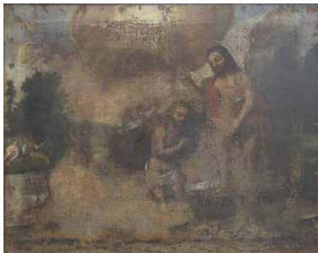
Giovanni Francesco Fedrigazzi, Krštenje Krista , Trogir (Čiovo), crkva sv. Josipa (Sv. Lazara)

tkaninom i klijestima). Ne samo umetanje tih motiva, nego i njihovo oblikovanje, ocrtava Fedrigazzijevu likovnu kulturu. U odnosu na Bogorodicu, svetac i princeza minijature su dimenzija, iako je njihova udaljenost od prednjeg plana posve neznatna. Poigravanje sa svetačkim likovima, njihovim veličinama i prostornim relacijama otkrivaju da majstor nije oblikovao narativnu cjelinu, nego je površinu platna ispunjao odvojenim motivima koje se nije trudio, a ni znao, povezati u radnju koja počiva na unutarnjoj logici, povezanosti i smislu. Aritivan princip oblikovanja kompozicije, proizvoljno korištenje ikonografske perspektive, nizanje anđeoskih likova koji međusobno ne komuniciraju, pretpostavljaju da se slikar koristio grafičkim listovima koje je slobodno, smiono i nepovezano prenosio na svoja djela. Čini se da bez grafičkih listova, dakle bez pomoći sa strane, Fedrigazzi nije znao naslikati prostor u perspektivnom skraćanju te je likove sv.