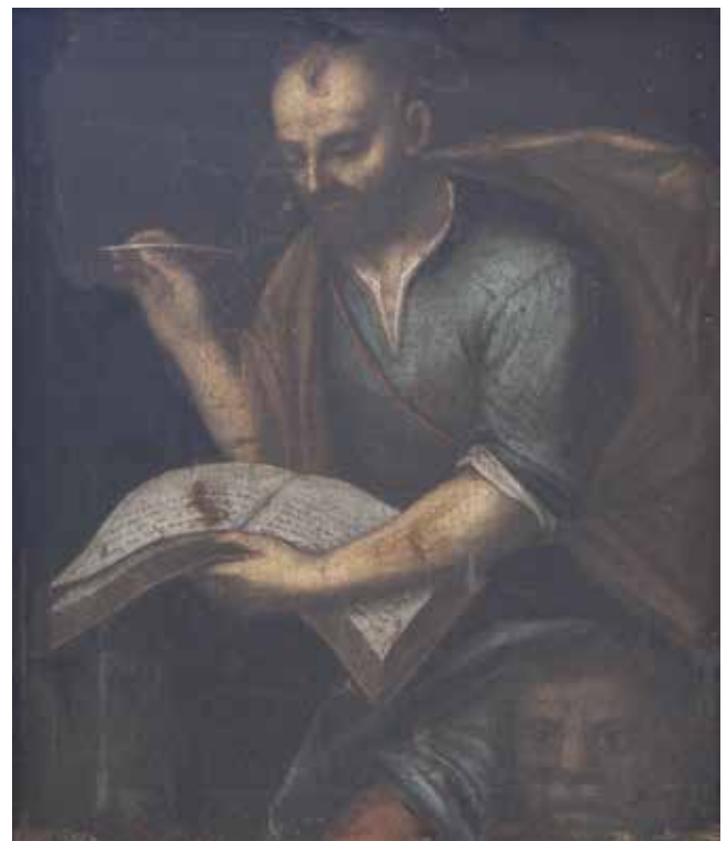
Giovanni Francesco Fedrigazzi, Anđeo čuvar , Vis, crkva sv. Duha, ograda pjevališta

Giovanni Francesco Fedrigazzi, Guardian Angel, Vis, church of the Holy Spirit, the choir railing