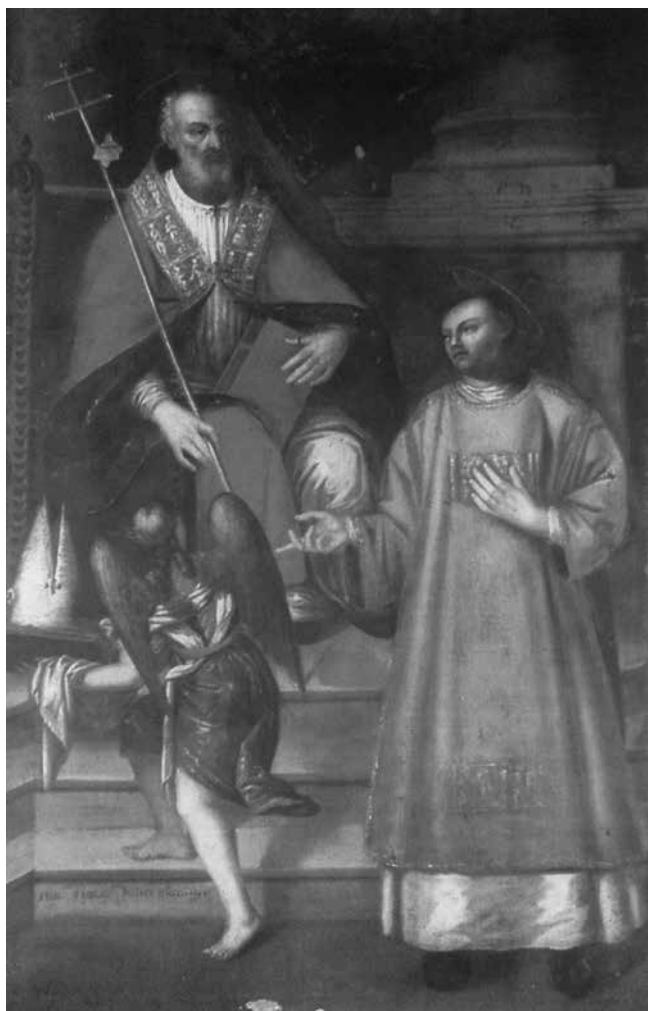
Giovanni Francesco Fedrigazzi, Sv. Ermagora i sv. Fortunat , Chions (Pordenone), Župna crkva sv. Jurja