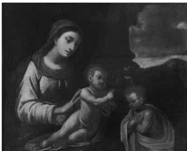
Giovanni Francesco Fedrigazzi, Krštenje Krista , Trogir – Okrug Donji (Čiovo), crkva sv. Tudora