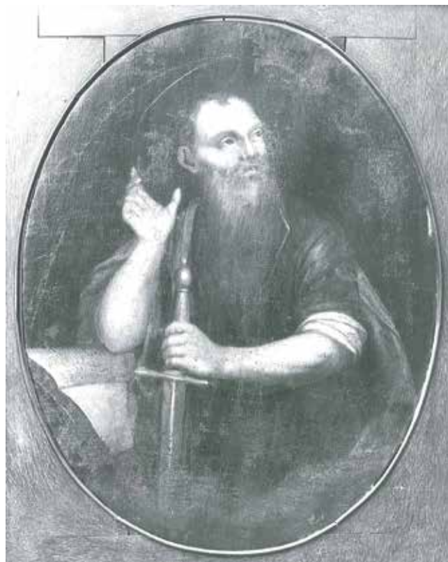
Giovanni Francesco Fedrigazzi, Sv. Pavao , Trogir, Zbirka Slade-Šilović Giovanni Francesco Fedrigazzi, St Paul , Trogir, Slade-Šilović collection

treba pretpostaviti da su na njima izvorno stajali portreti sv. Ivana Evanđelista i sv. Ambroza. Na taj je način oslikani ciklus bio cjelovit, a prikazivao je četiri crkvena oca i četiri evanđelista sa strana Anđela čuvara koji je najveći i postavljen u sredinu. 13