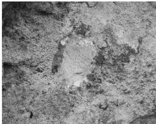
9 Probna sonda na donjem rubu reljefa Probe in the relief's lower edge