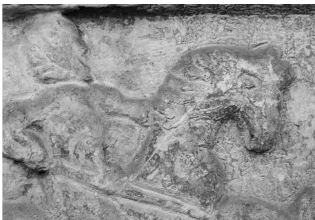
5 Detalj reljefa Detail of the relief