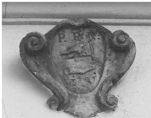
14 Grb uzidan iznad prozora s južne strane ljetnikovca

Coat-of-arms built into the southern façade above the window