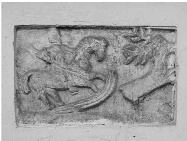
4 Reljef uzidan u zapadno pročelje ljetnikovca Werner Relief built into the western façade of the Werner Summerhouse

Duljina reljefa iznosi 51 cm, a visina 31,5 cm. Kako je uzidan 3 cm unutar pročelja, rubovi su mu djelomično prekriveni žbukom i bojom, tako da su stvarne dimenzije i nešto