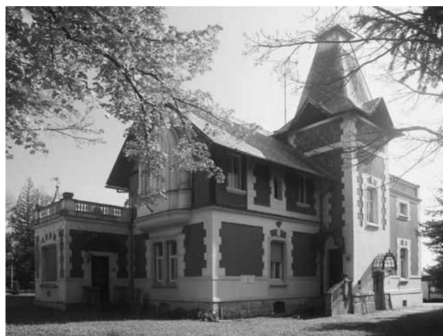
2 Ljetnikovac Werner na Tuškancu 36 u Zagrebu, pogled s jugozapada

Prilikom uobičajene šetnje zagrebačkom ulicom Tuškanac u veljači 2014. godine pomnije sam se osvrnuo na kuću na kbr. 36, poznatu kao ljetnikovac Werner (sl. 2). 16 Nekoć ljetnikovac u susjednom posjedu nekoliko bogatih zagrebačkih trgovaca i industrijalaca, danas je ta kuća luksuzni rezidenci-