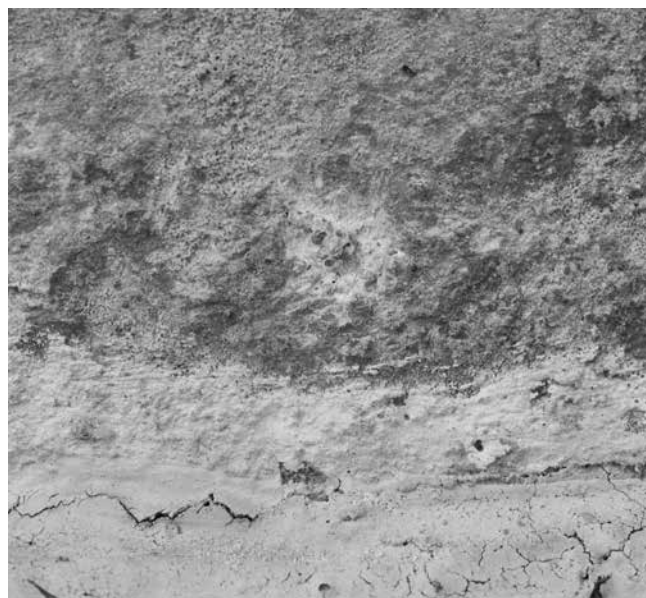
10 Probna sonda ispod tijela jelena Probe below the deer's body

12–12,5 cm s desne) glatki tanki premaz crvenkaste boje vrlo se lako skida i ljušti u dva sloja. Ispod njega otkrila se bjelkasta površina fino osipajuće strukture, koju se vrlo lako može oštetiti, pa nisam nastavio s dubljim ispitivanjem (sl. 7 i 8). Treća pozicija nalazi se na samom donjem rubu, 10–11 cm s lijeve strane (sl. 9). Ovdje je površina primjetno grublja i hrapavija, pa ni sloj crvenkaste boje nije toliko kompaktan ni gladak nego je pomiješan s površinskim inkrustacijama. Vrlo je tanak (donji dio reljefa najviše je izložen atmosferilijama) i ispod njega se otkrila sasvim drugačija struktura, vrlo čvrsta i s primjesama krupnih zrnaca pijeska. Moguće je da je riječ o starijem sloju žbuke. Zanimljivo je da je na novigradskom ulomku površina donjeg ruba također vrlo gruba i neravna,