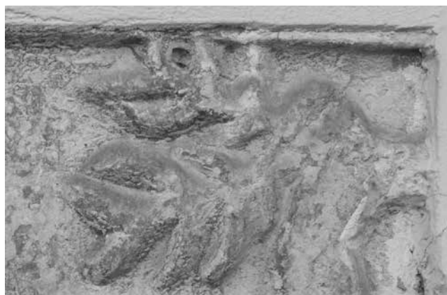
6 Detalj reljefa Detail of the relief