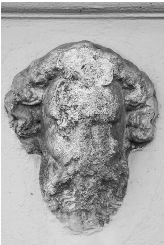
12 Glava bradatog muškarca uzidana u zapadno pročelje ljetnikovca Werner

Head of a bearded man built into the western façade of the Werner Summerhouse