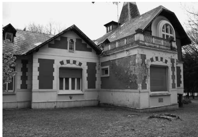
3 Ljetnikovac Werner, pogled sa sjeverozapada Werner Summerhouse, view from the northwest

Werner Summerhouse at Tuškanac no. 36 in Zagreb, view from the southwest