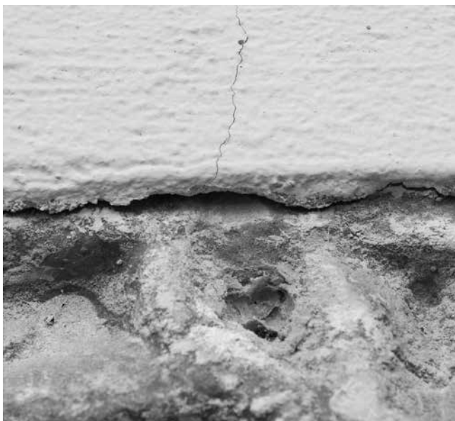
8 Probna sonda na desnom dijelu gornjeg ruba reljefa Probe in the right-hand part of the relief's upper edge