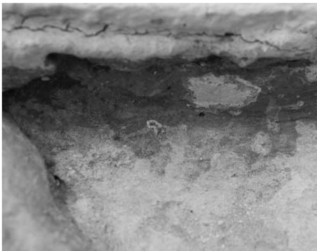
7 Probna sonda na lijevom dijelu gornjeg ruba reljefa Probe in the left-hand part of the relief's upper edge