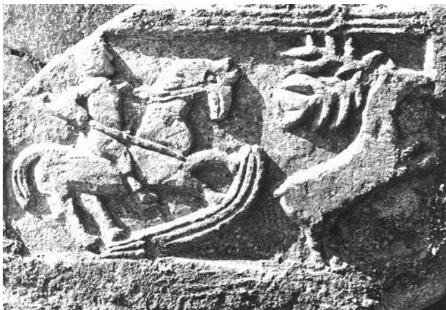
1 Ulomak pluteja iz Novigrada (iz: NIKOLA JAKŠIĆ – EMIL HILJE /bilj. 1/, 24, sl. 029)