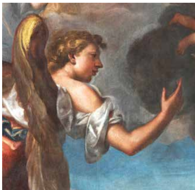
5 C. Tasca, Navještenje s prijenosom Nazaretske kućice na Trsat , 1714., Trsat, franjevačka crkva, detalj C. Tasca, The Annunciation with the Transfer of Mary's House from Nazareth to Trsat , 1714, Franciscan church in Trsat , a detail

Konvencionalnu ikonografiju navještenja slikar vješto dopunjuje prizorom prijenosa Nazaretske kućice, prilagođujući kompoziciju izduženom i lučno zaključenom formatu. Između krupnih likova arkanđela Gabrijela i Marije smještenih u kutovima kadra, anđeli nose Marijinu kućicu prema prepoznatljivoj silueti franjevačke crkve i samostana na trsatskoj stijeni u pozadini. Uravnoteženu, iluzionistički oblikovanu cjelinu povezuju eliptično kretanje masa oblaka i pokrenutih anđela koji okružuju Boga Oca. Svijetla paleta i sugestivan slikarski rukopis potvrđuje Tascinu usklađenost s modelima venecijanskog barocchetto akademskog prizvuka, a istaknuta plastičnost i elegantan stav arkanđela Gabrijela i Marije