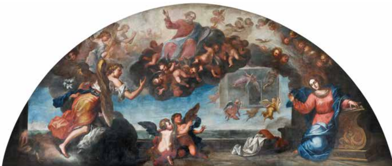
4 C. Tasca, Navještenje s prijenosom Nazaretske kućice na Trsat , 1714., Trsat, franjevačka crkva C. Tasca, The Annunciation with the Transfer of Mary's House from Nazareth to Trsat , 1714, Franciscan church in Trsat

večere s apostolima zamijenjena je složenijim, tipološki povezanim sadržajima. Prikazani franjevački sveci otjelovljuju temeljne vrline reda, a snagu i kontinuitet svetišta koje se obnavlja poslije velike pobjede nad Turcima, potvrđuju grbovi njegovih pokrovitelja – najmoćnije plemićke obitelji i austrijske vladarske kuće.