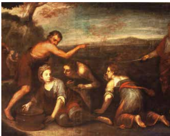
9 C. Tasca, Kiša mane , 1705., Trsat, refektorij franjevačkog samostana, detalj C. Tasca, Raining Mana , 1705, refectory of the Franciscan monastery in Trsat, a detail

Klasicizirajući, akademski karakter mletačkog barocchetto najizraženiji je u narativnoj strukturi i oblikovanju likova na slikama Kiša mane i Umnažanje kruha iz refektorija na Trsatu, no izrazito loše stanje obiju slika, nevjesto preslikanih tijekom obnove in situ 1963. godine, ne omogućuje detaljniju analizu slikarskih značajki (sl. 9). 56 Pouzdaniji oslonac u tumačenju Tascina slikarstva pružio je ciklus iz svetišta katedrale u Krku, potpisan i datiran u 1706. godinu, 57 za koji je već Dorotea Westphal (1937.) utvrdila da »podsjeća