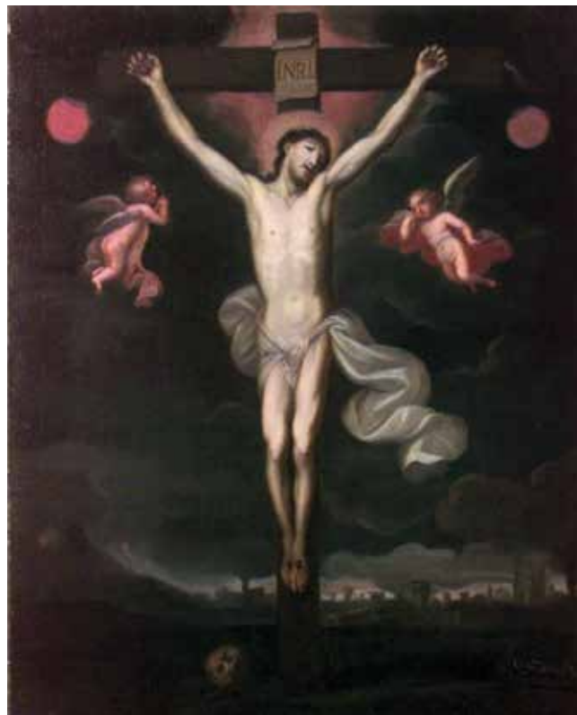
2 C. Tasca, Raspeće , 1706., župna crkva Uznesenja Marijina, Clusone C. Tasca, The Crucifixion , 1706, parish church of Mary's Assumption , Clusone