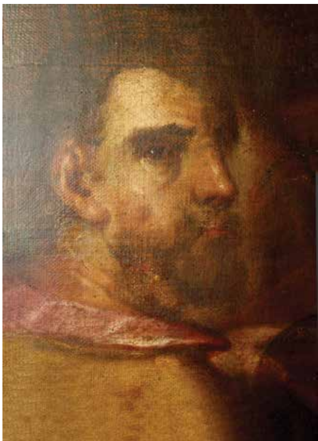
15 C. Tasca, Posljednja večera , detalj C. Tasca, The Last Supper , a detail

Klara bili na glavnom oltaru kapucinske crkve. Sa strana izgubljenoga središnjeg prikaza sv. Josipa, mogao je biti smješten prizor navještenja – arkandeo Gabrijel na lijevoj i Bogorodica Navještenja na desnoj strani, a iznad njih slika Boga Oca kružnog formata koja je taj format i položaj na atici, ali u prikazu iz 19. stoljeća, zadržala do danas. Na