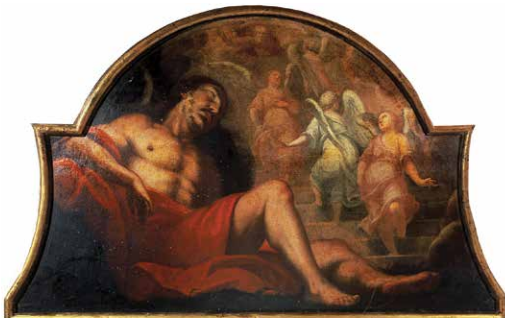
8 C. Tasca, Jakovljevi san u Betelu , 1704., Trsat, refektorij franjevačkog samostana C. Tasca, Jacob's Dream at Bethel , 1704, refectory of the Franciscan monastery in Trsat