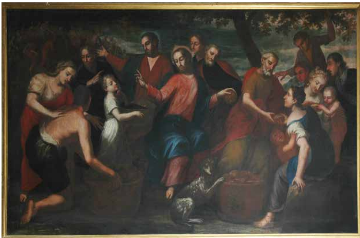
11 C. Tasca, Umnažanje kruha , 1706., Krk, katedrala C. Tasca, The Multiplication of Bread , 1706, Krk cathedral