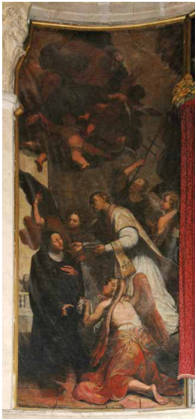
3 C. Tasca, Čudo bilokacije sv. Lovre Giustinianija koji pričešćuje redovnicu , crkva San Pietro di Castello, Venecija

C. Tasca, The Bilocation Miracle of St Laurence Giustiniani Offering the Eucharist to a Nun , church of San Pietro di Castello, Venice