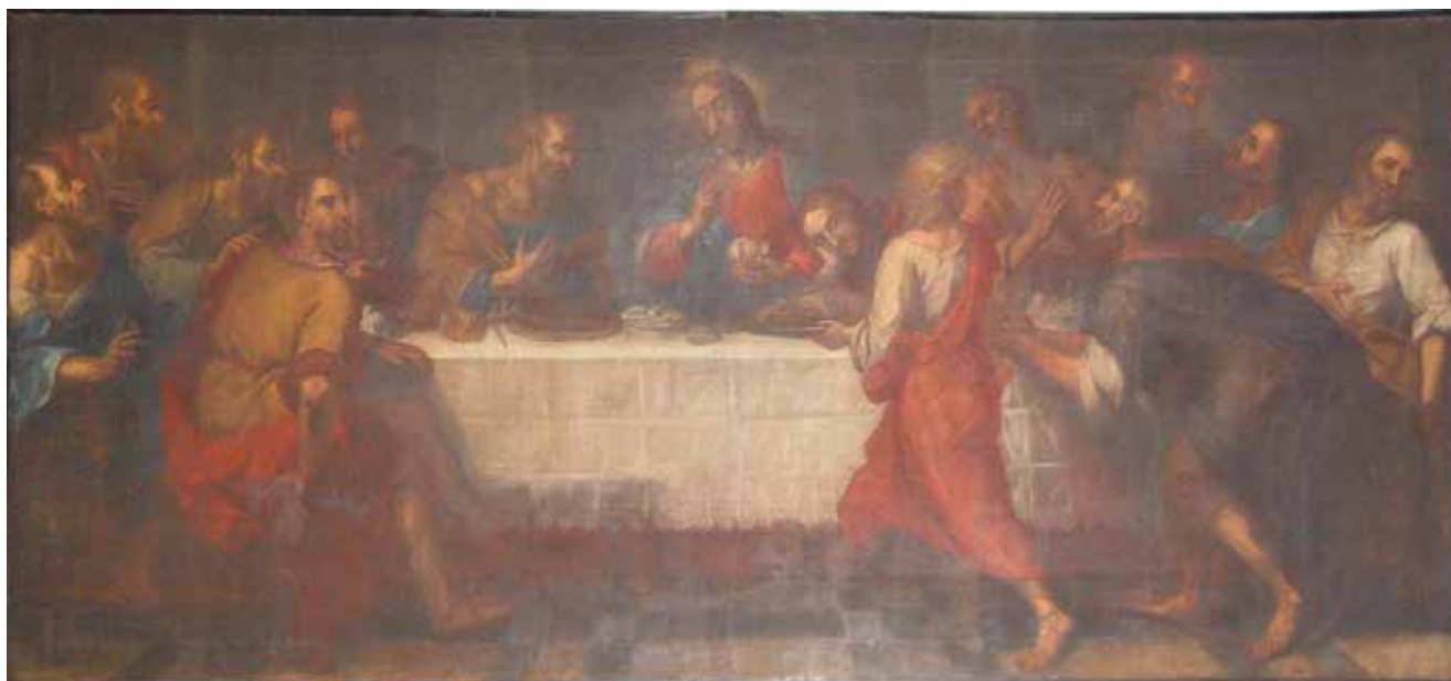
14 C. Tasca, Posljednja večera , 1712., Karlobag, refektorij kapucinskog samostana C. Tasca, The Last Supper , 1712, refectory of the Capuchin monastery in Karlobag