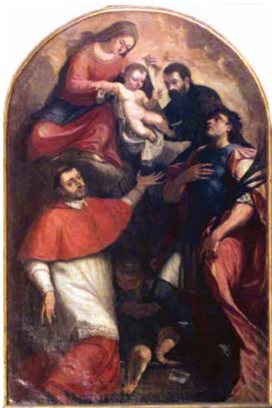
1 C. Tasca, Bogorodica s Djetetom i svecima , 1697., župna crkva Rođenja Marijina i sv. Ferma i Rustica, Sombreno C. Tasca, The Virgin and Child with saints , 1697, parish church of Mary's nativity and Sts Firmus and Rusticus , Sombreno