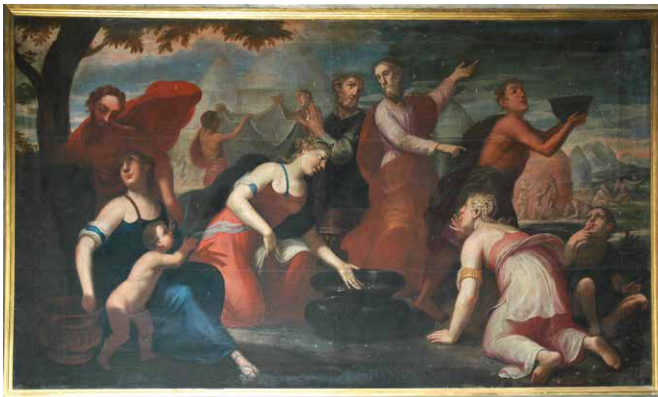
10 C. Tasca, Kiša mane , 1706., Krk, katedrala C. Tasca, Raining Mana , 1706, Krk cathedral

uključen. Elegantne kamene pilastre i vijence koji uokviruju slike u svetištu nekadašnje venecijanske katedrale, u Krku su, međutim, zamijenile drvene profilacije i rezbareni bujni akantus, polikromija i dekorativni motivi koji ovu baroknu cjelinu povezuju s austrijskim zaleđem.