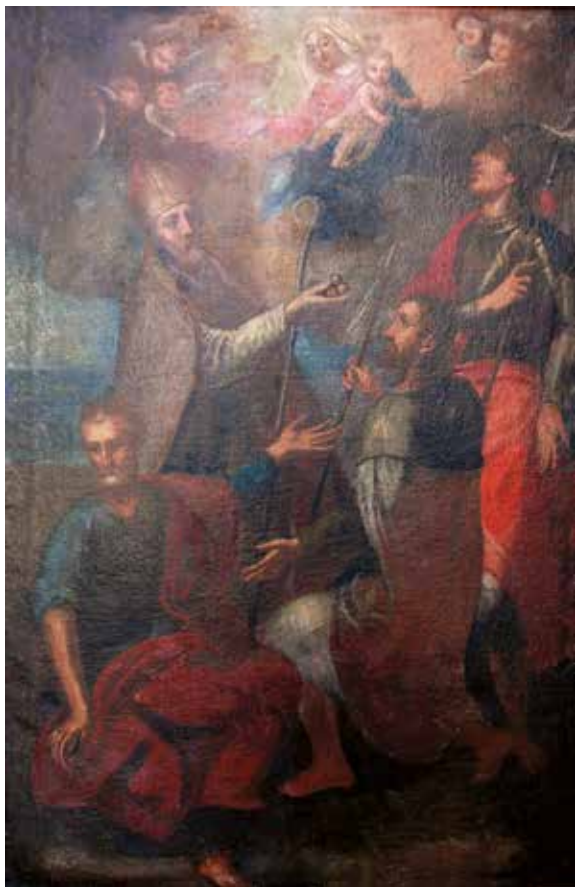
12 C. Tasca, Bogorodica s Djetetom i svecima , Krk, katedralna zbirka C. Tasca, The Virgin and Child with the Saints , collection of the Krk cathedral