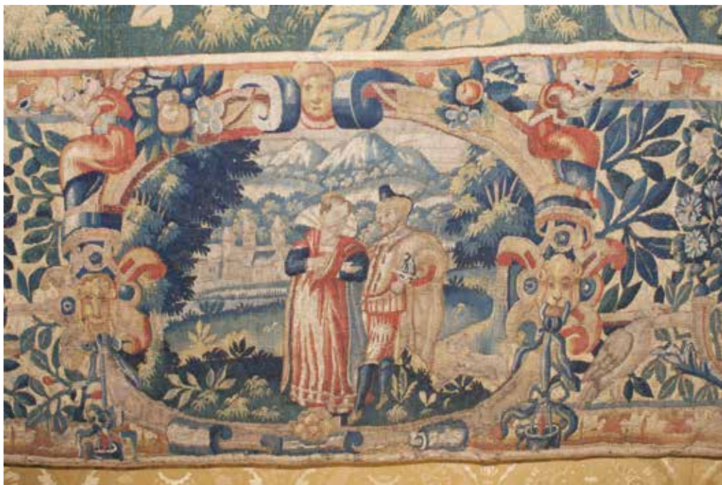
11 Medaljon, detalj tapiserije Bitka kod Isa (?) , Strossmayerova galerija starih majstora (SG-13)