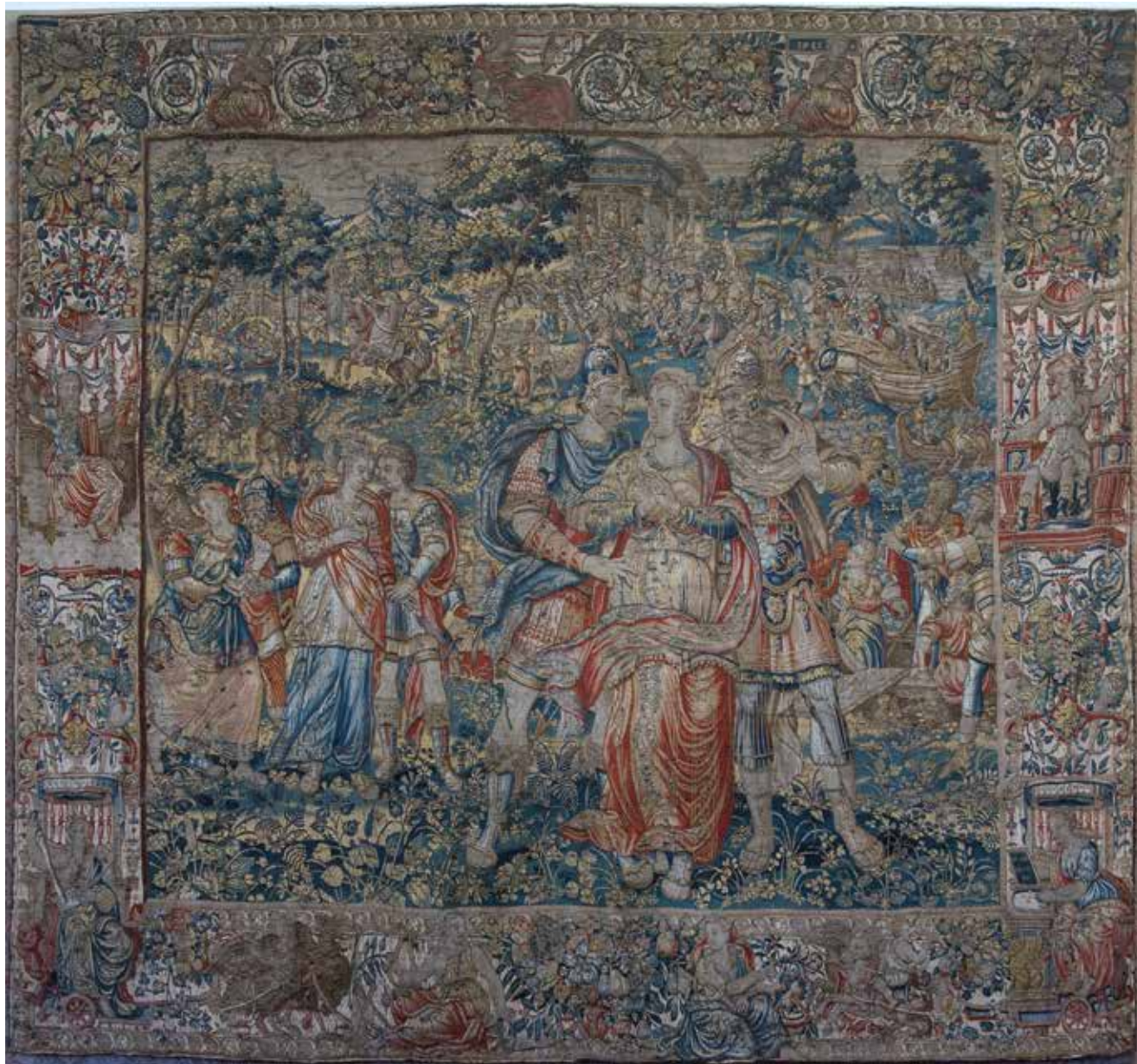
1 Neznani autor, Otmica Sabinjanki , Bruxelles, oko 1560./1590., vuna i svila, 352,4 × 377 cm, Strossmayerova galerija starih majstora (SG-12)

Anonymous author, The Rape of the Sabine Women, Brussels, ca. 1560/1590, wool and silk tapestry, 352.4 × 377 cm, Strossmayer's Gallery of Old Masters (SG-12)