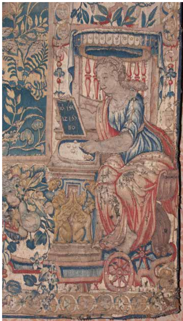
5 Alegorija Aritmetike, detalj tapiserije Otmica Sabinjanki (SG-12) Allegory of Arithmetic, detail of the tapestry The Rape of the Sabine Women (SG-12)

vijeku dobila zrcalo; ono znači da mudrac može vidjeti sebe onakvim kakav doista jest. 24 Odvojene od personifikacije razboritosti buketima voća i cvijeća na čijim spiralno savijenim viticama stoje paunovi, sa svake je strane po jedna istovjetna figura žene u sjedećem položaju, glave okrenute u lijevu stranu i s prekrizanim rukama na grudima. Tik do nje je sidro, jedan krak kojega proviruje ispod njezine haljine. Te su figure označene natpisom na latinskom SPES (Nada, Ufanje). U renesansnoj umjetnosti uobičajeno je da se Nada prikazuje kao lik žene s rukama sklopljenim u molitvi, očiju uprtih u nebo. Sidro, koje je djelomice skriveno odjećom potječe od svetog Pavla koji je o Nadi rekao: »Ona nam je kao pouzdano i čvrsto sidro duše što ulazi u unutrašnjost iza zavjese.« (Heb, 6, 19). 25 Na lijevoj vertikalnoj borduri prikazan je Jupiter