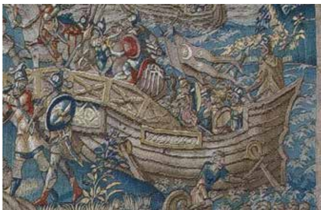
2 Zastava sa zvijezdom i polumjesecom, detalj tapiserije Otmica Sabinjanki (SG-12)

Flag with the star and crescent, detail of the tapestry The Rape of the Sabine Women (SG-12)