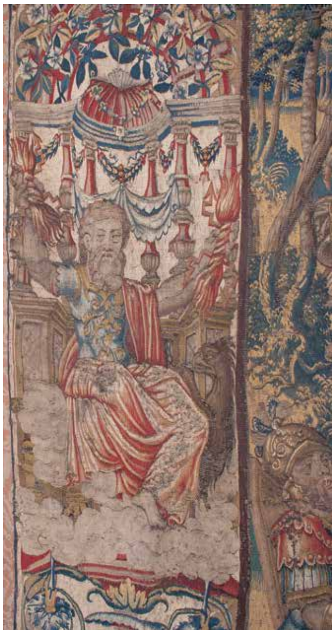
4 Alegorija Sunca, detalj tapiserije Otmica Sabinjanki (SG-12) Allegory of The Sun, detail of the tapestry The Rape of the Sabine Women (SG-12)