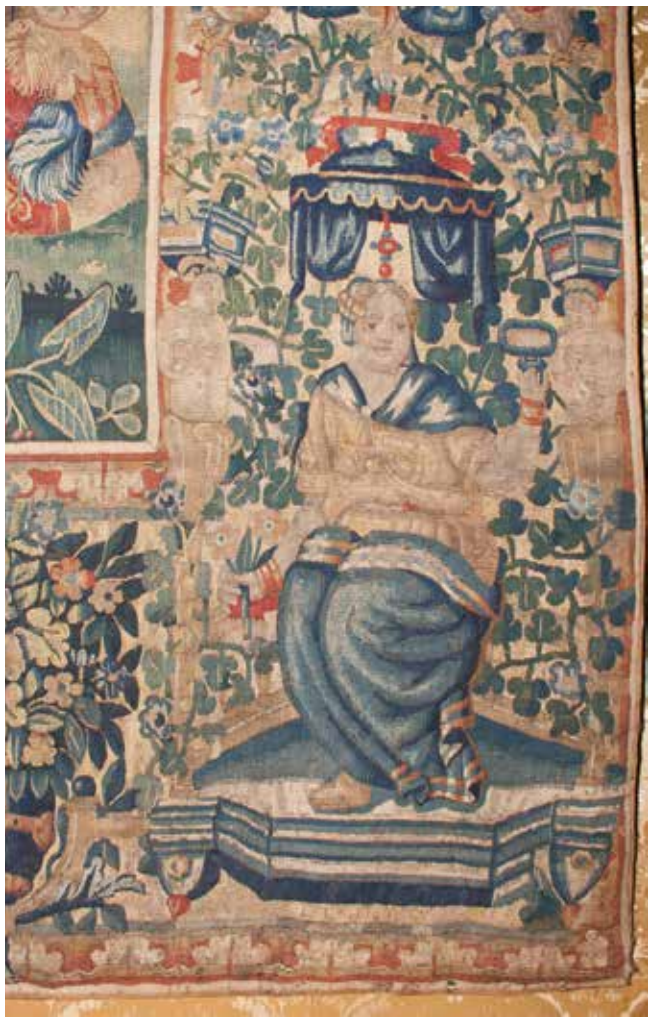
10 Alegorija Vjere, detalj tapiserije Bitka kod Isa (?) , Strossmayerova galerija starih majstora (SG-13) Allegory of Faith, detail of the tapestry Battle of Issus (?) , Strossmayer's Gallery of Old Masters (SG-13)