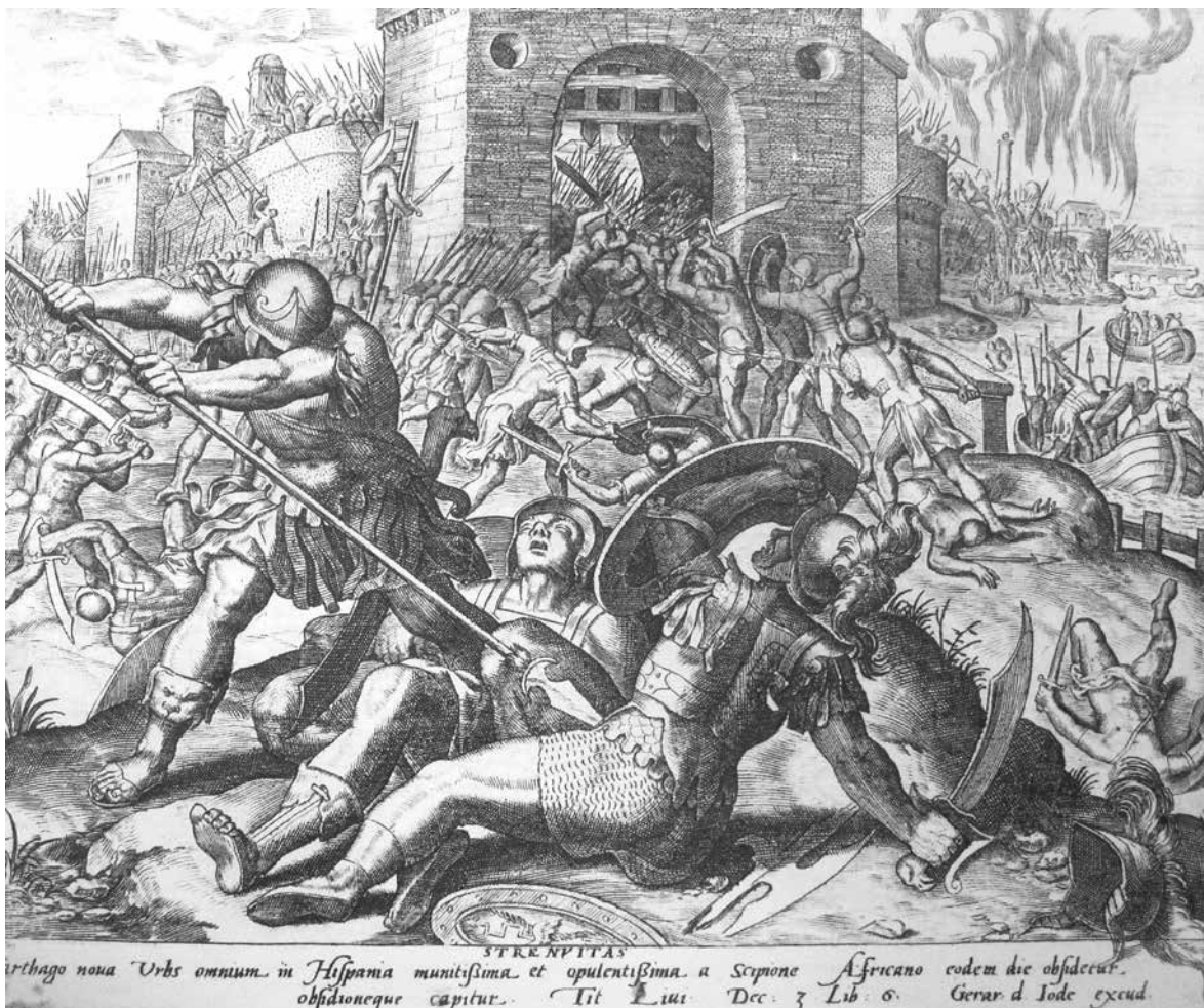
8 Gerard de Jode, Osvajanje Nove Kartage , gravura, 20,6 × 24,5 cm (Izvor: bilj. 49) Gerard de Jode, Conquest of New Carthage , engraving, 20.6 × 24.5 cm

početka, prvi je predložio Lossky 1938. godine, smatrajući kako je riječ o Boju pod zidovima Troje . 47 Pomanjkanje ikonografskih detalja koji bi opravdali tematiku Trojanskog rata, isključuje tu mogućnost. 48 Na svim tapiserijama ovoga temata naglašena je upravo arhitektura zidina Troje, bilo da je riječ o tapiserijama iz 15. stoljeća ili kasnijim, prethodno spomenutim djelima. Međutim, obrisi arhitektonske strukture u pozadini na tapiseriji u Strossmayerovoj galeriji ne bi se mogli dovesti u vezu s tim legendarnim gradom.