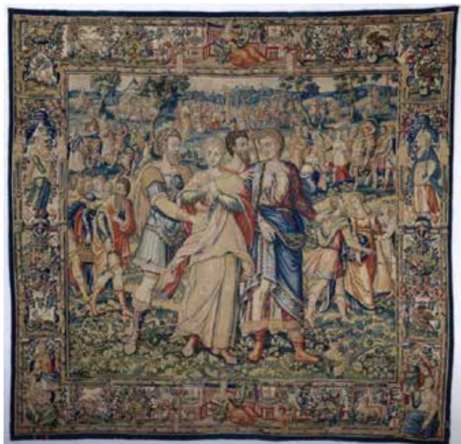
3 Frans Geubels, Progon Tobita i Ane u Ninivu , Bruxelles, oko 1560./1575., vuna i svila, 328 × 338 cm, Rijksmuseum, Amsterdam

Flag with the star and crescent, detail of the tapestry The Rape of the Sabine Women (SG-12)