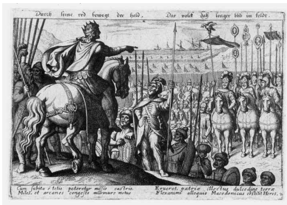
12 Matthäus Merian, Aleksandar Veliki se obraća svojoj vojsci , gravura, 10,3 × 16,5 cm Matthäus Merian, Alexander the Great Addresses His Army , engraving, 10.3 × 16.5 cm

denim antičkim temama, ove tapiserije – bez odgovarajućih popratnih tekstova u kartušama na gornjim bordurama ili posebnih ikonografskih detalja – Guy Delmarcel naziva »cr-