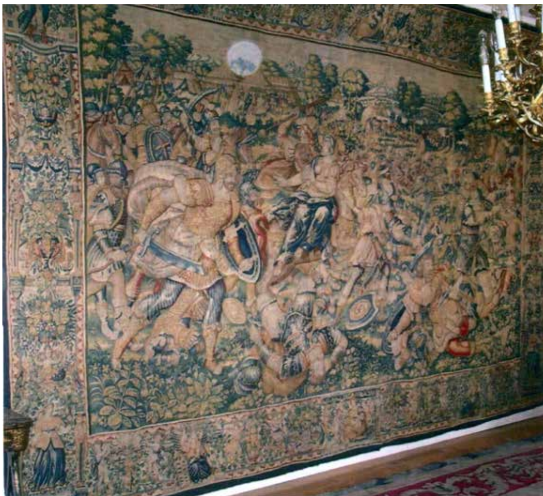
9 Bitka kod Isa / Povijest Aleksandra Velikog , Tournai (?), oko 1590./1610., vuna i svila, 275 × 452 cm Battle of Issus / History of Alexander the Great, Tournai (?), ca. 1590/1610, wool and silk tapestry, 275 × 452 cm

obitelj, opisali su grčki i latinski povjesničari i pisci, Plutarh (46. – 120.), Ruf (druga pol. 1. st.) i Flavije Arijan (86. – 146.). Prema Arijanu: »Darejev tabor bi zauzet odmah kod prvog napadaja. Njegova mati i žena, koja mu bijaše ujedno i sestra, pa sinčić i dvije kćeri (...) dospješe u sužanjstvo«. 53 U gornjem uglu naše tapiserije pred udaljenim su šatorom vidljivi likovi triju žena i malog djeteta okruženi vojnicima. Kako sudeći prema Arijanovu opisu nedostaje jedna od žena, djevojka na konju u prednjem planu mogla bi biti žena Darijeva Stateira I. ili kći Stateira II. koju je poslije, nakon bitke kod Suze 324. godine pr. Kr., Aleksandar oženio. 54 Raskošna odora i kruna na kacigi ukrašenoj perjem ukazuju upravo na njezino visoko podrijetlo. Ruševine grada u pozadini mogle bi stoga predstavljati Isu, grad koji je Darije zauzeo.