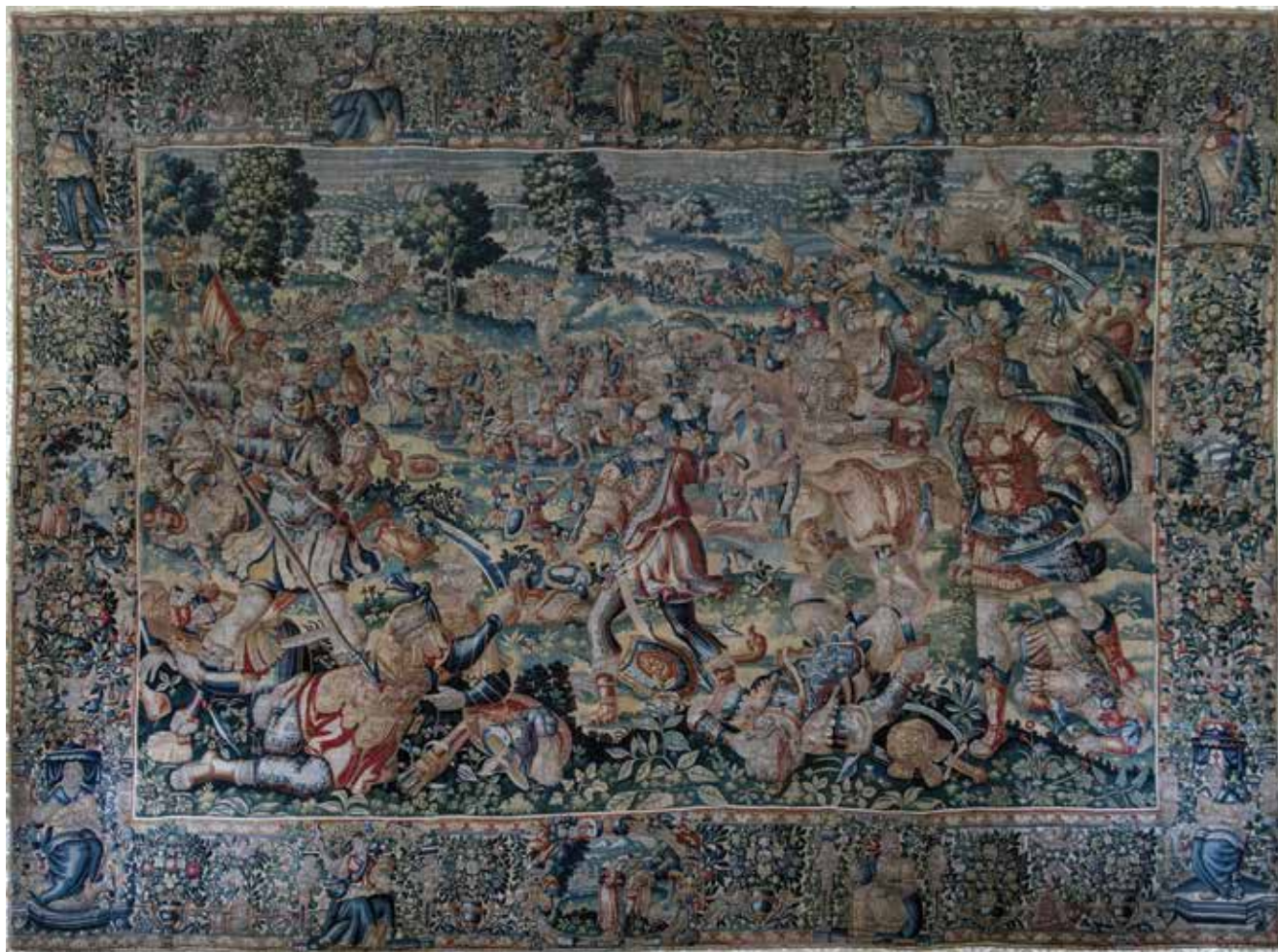
7 Neznani autor, Bitka kod Isa (?) , Bruxelles, oko 1560./1590., vuna i svila, 328,4 × 438 cm, Strossmayerova galerija starih majstora (SG-13) Anonymous author, Battle of Issus (?) , Brussels, ca. 1560/1590, wool and silk tapestry, 328.4 × 438 cm, Strossmayer's Gallery of Old Masters (SG-13)

floralnom pojasu u prednjem dijelu kadra, impostacijama i fizionomijama likova, tretmanu kostima i koncepciji bordure, neosporno je rad bruxelleske radionice iz druge polovice 16. stoljeća. Autor kartona nije poznat. Kada je riječ o radionici, jedina poveznica jest tapiserija iz radionice Fransa Geubelsa Progon Tobita i Ane u Ninivu , iz Rijksmuseuma (sl. 3), s prikazom istovjetnog lika žene sa sklopljenim rukama i muškarca s njezine desne strane. Istom, bordura na Geubelsovoj tapiseriji Trojanski konj posjeduje izvjesne sličnosti s bordurom na našoj tapiseriji. 40 Magdalena Piwocka mišljenja je da postoji dosta analogija glede tematike i bordura na tapiserijama Fransa i Jacoba I. Geubelsa (1565. – 1604.). 41 Duverger navodi dosta primjera na kojima se mogu prepoznati neki elementi s naše tapiserije, od floralnih motiva u prednjem planu, posebice paprati, ženskih nošnji i vojničkih odora, do cvjetnih voluta na borduri te zaprega konja i orlova koji vuku kola s alegorijskim figurama. 42