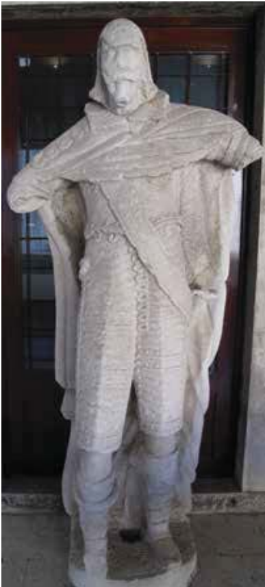
16. Kip Leonarda Foscola, Split, Muzej grada Statue of Leonardo Foscolo, The Split City Museum