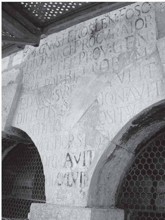
13. Natpis u lođi zvonika crkve sv. Ivana u Šibeniku Inscription in the loggia of the belfry of the church of St John the Baptist, Šibenik