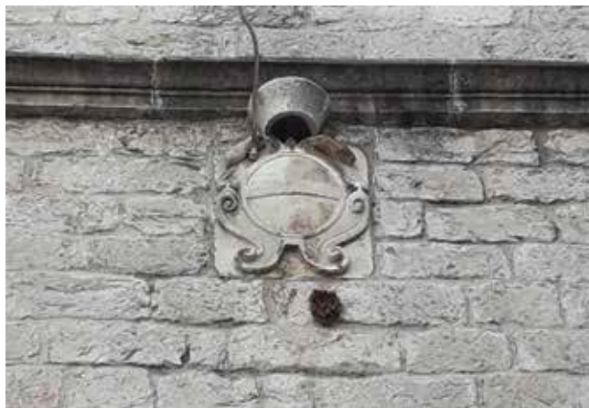
15. Grb Leonarda Foscola na pročelju crkve sv. Nikole u Šibeniku Coat of arms of Leonardo Foscolo on the front façade of St Nicholas' church in Šibenik

Zbog ratnih zasluga i ukupne politike neosporno je da ni jedan drugi vladar i vojskovođa nije stekao toliku popularnost