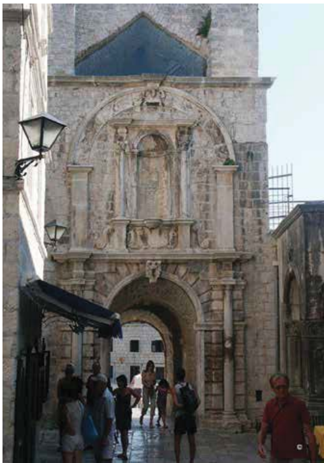
22. Slavoluk Leonardu Foscolu u Korčuli Triumphal arch of Leonardo Foscolo in Korčula

da je monumentalno zamišljen slavoluk realiziran plošnim, pretrpanim arhitektonskim i dekorativnim ukrasima s nišom za providurov kip. Njega već dugo nema u niši (navodno je uklonjen 1691. godine, ali moguće i kasnije, u drugoj polovici 19. stoljeća), ali su u nedavnom čišćenju kule Svih Sveti pronađena tri oštećena kamena kipa: dva poprsja i jedan kip do koljena. Jednom poprsju nedostaje glava, drugom su oštećeni dijelovi lica, dok je treći razbijen u više komada. Kada se na trećem kipu povežu sačuvani ulomci, dobije se kip u paradnoj vojnoj odjeći čije je lice nalik Foscolovim kipovima na grafikama i u kamenim portretima iz Splita. Vjerujem da je upravo taj kip mogao stajati u niši na slavoluku s unutarnje strane južnih gradskih vrata, uz gradsku vijećnicu.