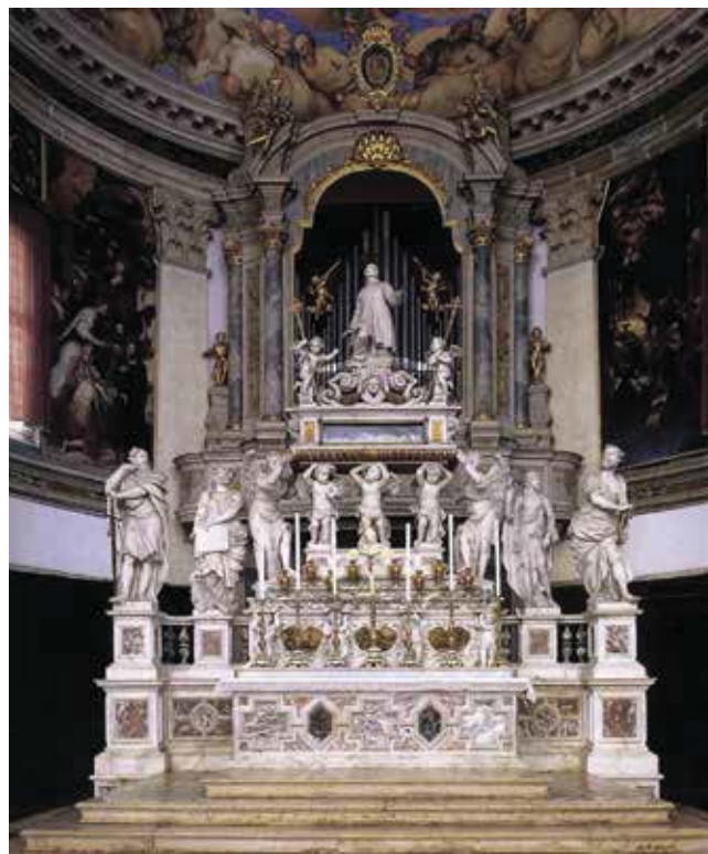
10. Oltar bl. Lorenza Giustinianija, Venecija, San Pietro di Castello Altar of blessed Lorenzo Giustiniani, Venice, San Pietro di Castello

Dokument datiran 1668./1669. godine dodatno potvrđuje Cavriolijevo autorstvo kipova pa i gradnju oltara. U njemu se spominju: Signor Francesco Cavrioli Cittadino i Signor Baldissera Longhena Protto (...) et mistro Lunardo suo giovane tagliapietra condotto da Venezia (...) . Longhena se spominje kao procjenitelj mramora i posla ( marmi et fatture stimate dal