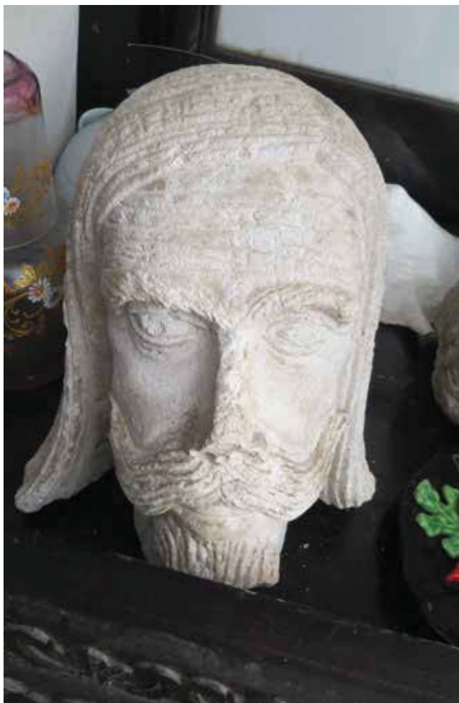
27. Glava Leonarda Foscola koja pripada skulpturi u dvorištu palače Arneri, vlasništvo obitelj Arneri u Korčuli

Head of Leonardo Foscolo from the statue in the courtyard of the Arneri Palace in Korčula, property of the Arneri family