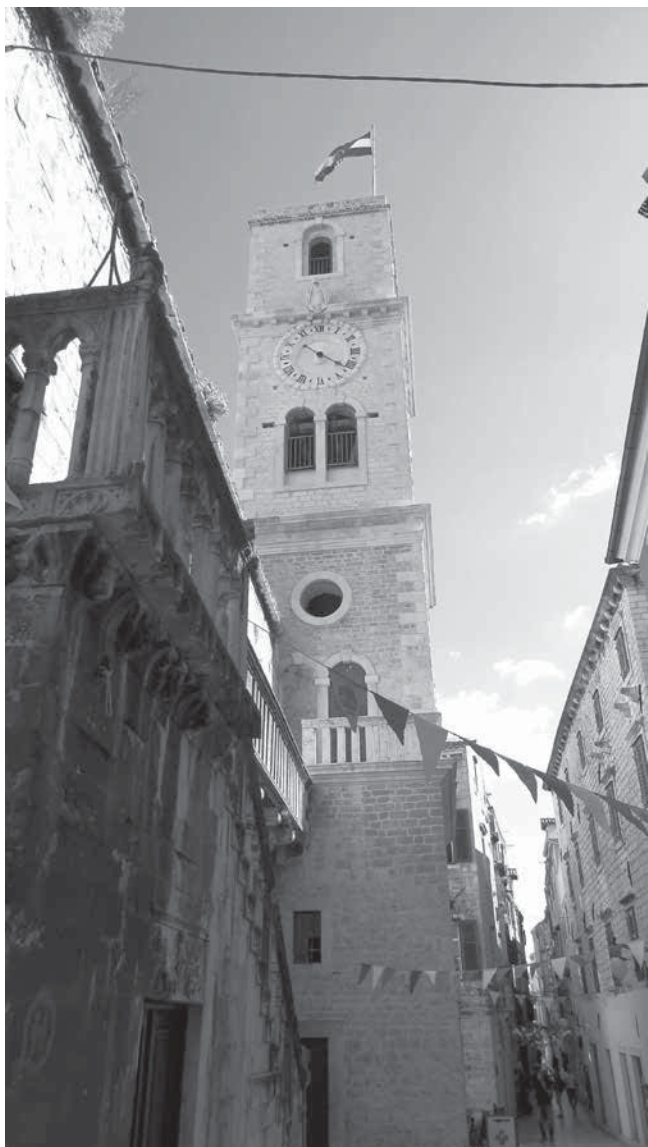
11. Zvonik crkve sv. Ivana Krstitelja, Šibenik Belfry of the church of St John the Baptist, Šibenik