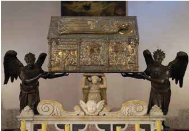
8. Oltar sv. Šimuna, Zadar, crkva sv. Šime Altar of St Simeon, Zadar, St Simeon's church