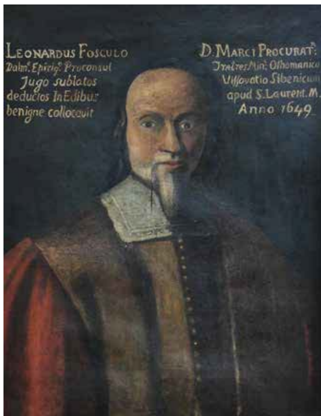
1. Nepoznati slikar, Portret Leonarda Foscola , Šibenik, Samostan sv. Lovre

Anonymous painter, portrait of Leonardo Foscolo, Šibenik, monastery of St Laurence