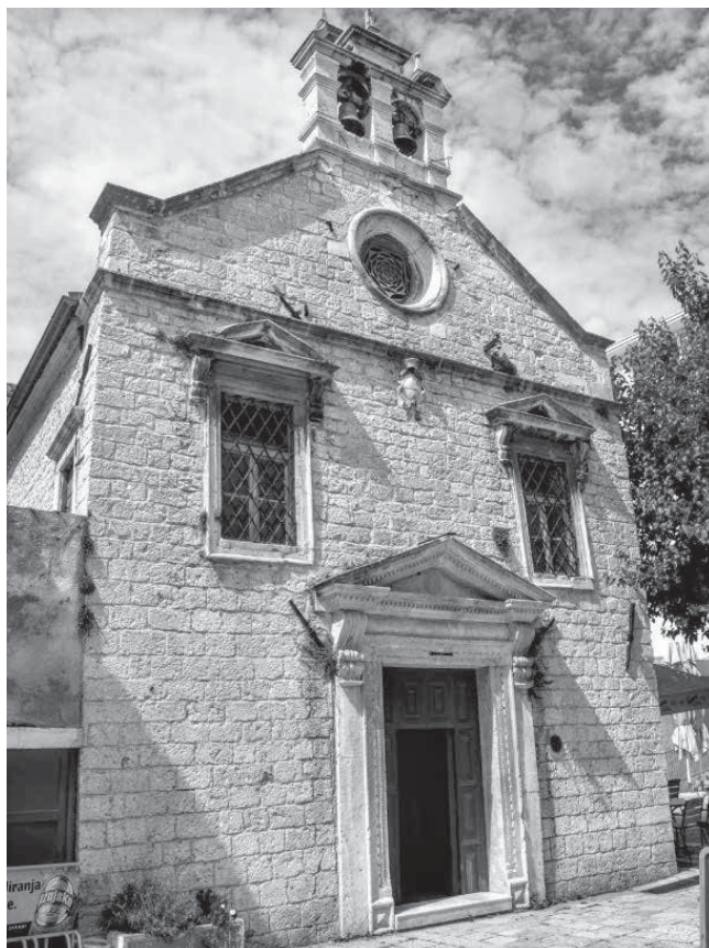
14. Crkva sv. Nikole u Šibeniku St Nicholas' church in Šibenik

zabilježenoj predaji Foscolo je, pri zauzeću Drniša 1648. godine, razrušio brojne građevine dok je s tamošnje sahatkule skinuo sat i ugradio ga na navedeni šibenski zvonik. O tome bi trebao svjedočiti Foscolov grb postavljen uz lođu pri vrhu zvonika te natpis koji se nalazi uklesan u njezinoj unutrašnjosti. Iako nepovratno oštećen, natpis bi zaista mogao upućivati na prijenos satnog mehanizma iz Drniša u Šibenik i njegovo postavljanje na visoki zvonik: 35