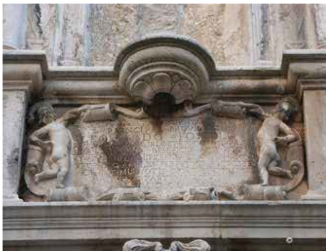
23. Natpis na Foscolovu slavoluku u Korčuli Inscription on Foscolo's triumphal arch in Korčula

I u palači Arneri u Korčuli sačuvan je dopojasni kameni kip generala Foscola izložen u niši polukružnog završetka na sjevernom zidu dvorišta. Providur je u bojnom paradnom oklopu na kojemu je isklesan u plitkom reljefu lav sv. Marka