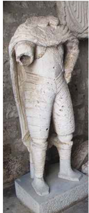
18. Kip Leonarda Foscola, Split, Muzej grada Statue of Leonardo Foscolo, The Split City Museum

bijelog kamena kip providura Leonarda Foscola. Kip je trebao biti postavljen na trgu ispred Gradske lože na kamenom postolju s natpisom koji će veličati njegove zasluge u borbi protiv Turaka i uspješnu obranu Šibenika 1647. godine, kako su sami zahvalni građani tražili. 38 Isti je majstor prema ugovoru sklopljenom 27. listopada 1653. godine trebao izraditi od korčulanskoga kamena, koji će sam odabrati, spomenik providuru Lorenzu Dolfinu (1652.–1654.), a trebao je stajati na glavnome gradskom trgu u Šibeniku. 39 Danas nije sačuvan nikakav materijalni trag navedenih kipova.