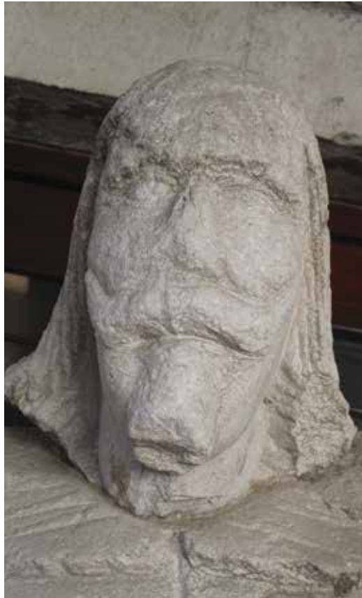
17. Kip Leonarda Foscola, Split, Muzej grada, detalj glave Statue of Leonardo Foscolo, The Split City Museum , detail of the head