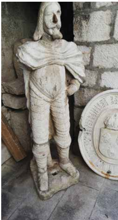
19. Kip Leonarda Foscola, Split, Muzej grada Statue of Leonardo Foscolo, The Split City Museum