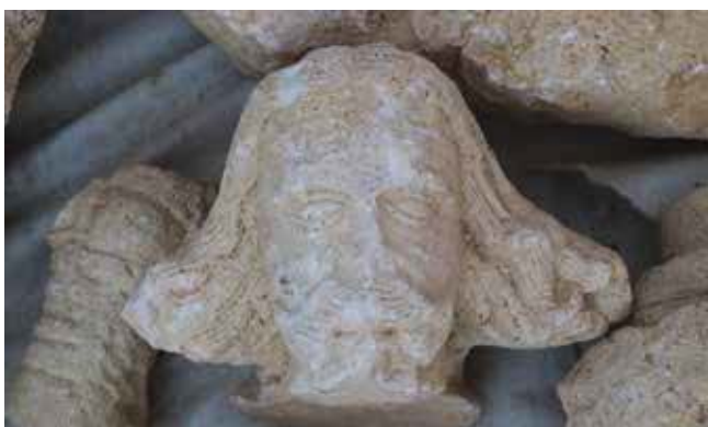
25. Glava Leonarda Foscola, pronađena 2019. Head of Leonardo Foscolo, discovered in 2019

Statue of Leonardo Foscolo, fragments discovered in 2019, formerly in a niche of the triumphal arch in Korčula