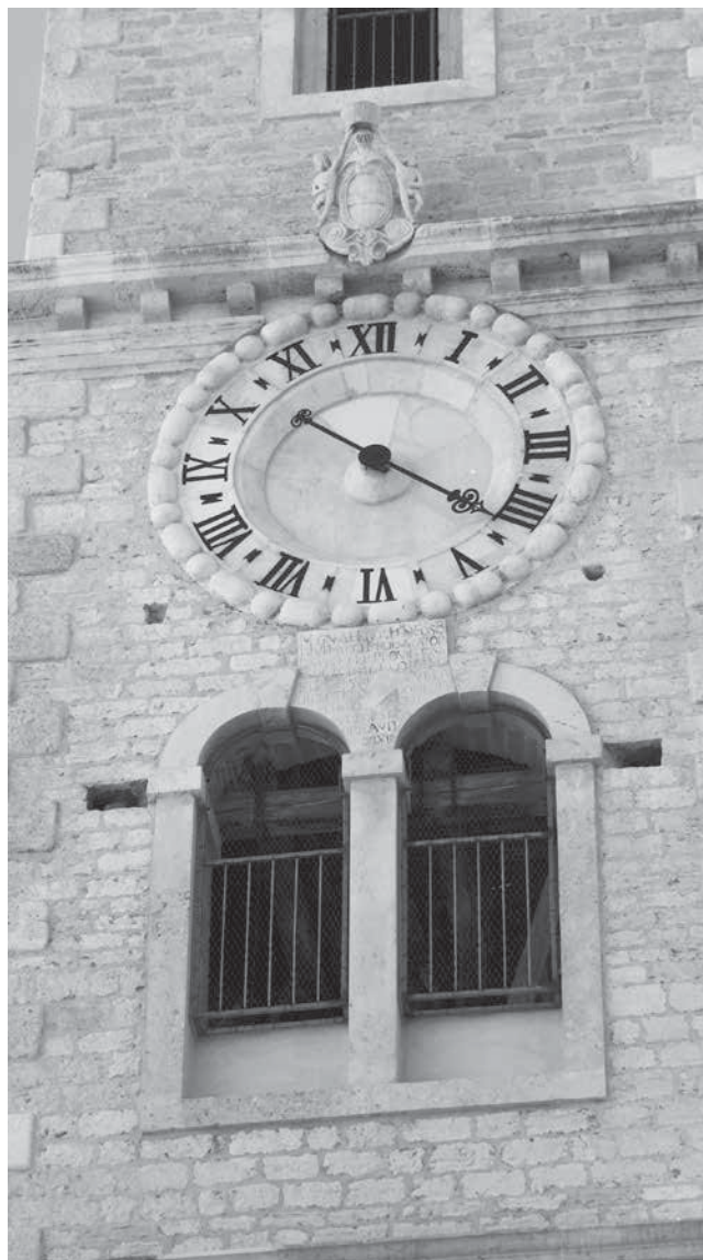
12. Sat i grb Leonarda Foscola na zvoniku crkve sv. Ivana u Šibeniku Clock and the coat of arms of Leonardo Foscolo in the belfry of the church of St John the Baptist, Šibenik

i kamenim kipovima anđela koji pridržavaju srednjovjekovnu raku, podigavši je visoko u zrak u novosagrađenom svetištu i na taj način oblikujući scenografiju crkvenog interijera u novome, baroknom ključu. Forma i sadržaj žrtvenika na neponovljiv način svjedoče nove barokne principe u kojima se povezuje staro i novo, srednjovjekovna srebrna i pozlaćena škrinja sa suvremenim mramorom, kamenom i broncom, oblikujući »teatralnu« kompoziciju i scenografiju koja dominira u crkvenoj unutrašnjosti. Istovremeno se zadovoljavaju temeljni postulati Tridentskoga koncila u kojima se nalaže povratak izvorima ( ad fontes ) i to ne samo univerzalnim svecima nego i lokalnim kultovima koje će u novom rasporedu, na novim oltarima, slikama i kipovima pomoći da se obnovi i osnaži katolička vjera.