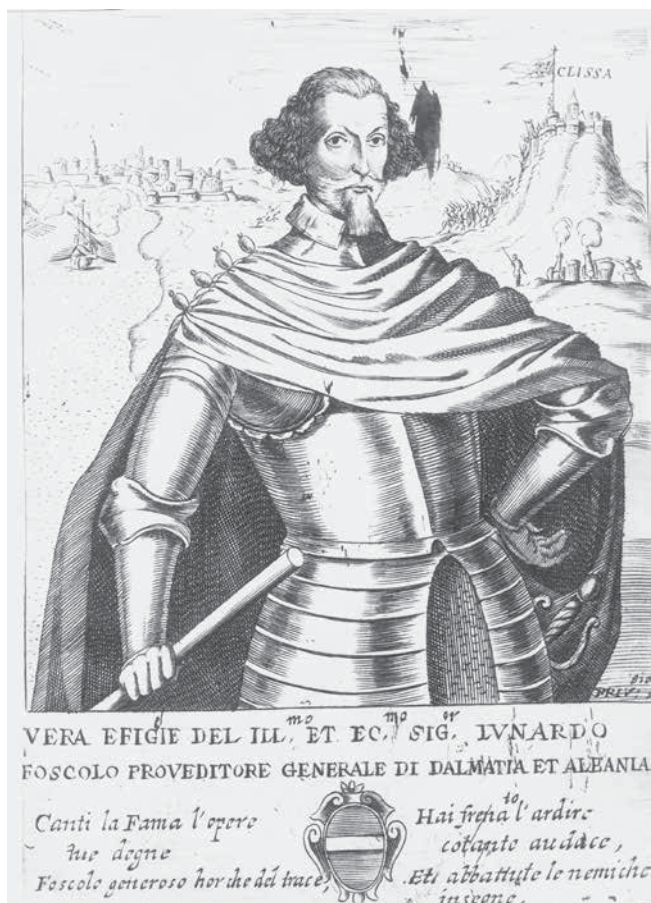
5. Nepoznati autor, Portrait Leonarda Foscola Anonymous author, Portrait of Leonardo Foscolo

providura, senatora, prokuratora Sv. Marka, papa, kardinala, biskupa, patrijarha, kapetana, admirala, vojskovođa, znanstvenika i umjetnika, ponekad izrađeni in memoriam da bi se evocirale prošle slave predaka, izravno naručivani s nakanom da otvoreno i dostojanstveno slave rod i njegove ugledne članove. Nisu naručivane samo slike s portretima nego i grafike te kipovi u mramoru, terakoti, porculanu, vosku i u medaljama. 9 No uz takvu privatnu ikonografiju, portreti su se naručivali i za javne građevine, u prvom redu za njihove unutarnje prostore, jer su se izlagali u palačama rektora, kneževa, kapetana i providura u gradovima na širem području Republike. Riječ je o državnim portretima ( ritratti di stato ; State Portraits ) kakvi se javljaju u svim europskim sredinama, u prvom redu monarhijama. S obzirom da je Venecija bila aristokratska republika, s relativnom disperzijom moći na veći broj porodica, koristi se termin »službeni portret« ( ritratto ufficiale ; ritratto di rappresentanza ; portrait d'apparat ) namijenjen za izlaganje u državnim zgradama, središtima političke moći. 10 Posebnost mletačke likovne kulture jest i činjenica da su se brojni portreti postavljali u unutrašnje prostore crkava te na njihova pročelja što je Martina Gaiera navelo na zaključak da je riječ o sakralnim pročeljima s profanom namjenom, dok Massimo Favilla i Ruggero Rugolo koriste sintagmu crkvena pročelja za privatnu slavu. 11