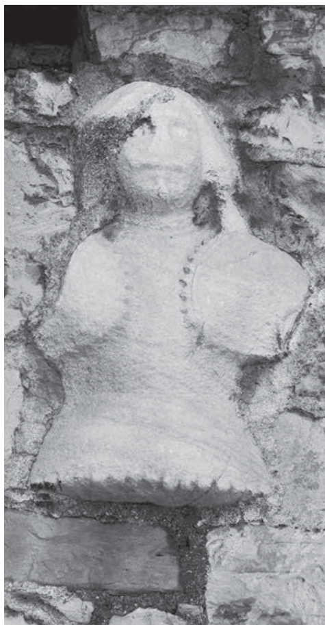
20. Reljefni prikaz Leonarda Foscola (?), Split, Duplančića dvori u Radunici Relief effigy of Leonardo Foscolo (?), Split, Duplančić mansion in Radunica

mentalniji spomenik u cijeloj Dalmaciji. Spomenik u donjem dijelu ima oblik slavoluka kojemu su u sredini gradska vrata s komunalnim grbom u tjemenu lučnog otvora, dok je iznad plitki luk s ratničkim amblemima i simbolima isklesanim u plitkom reljefu. U središnjem dijelu ispod luka visoka je niša za Foscolov kip, a u vrhu lav sv. Marka. Ispod niše dva gola dječčića pridržavaju kartušu s natpisom u kojemu se biranim riječima veličaju Foscolove pobjede nad Turcima: