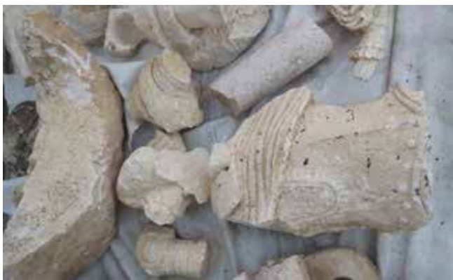
24. Kip Leonarda Foscola, ulomci pronađeni 2019., nekada u niši slavloluka u Korčuli

Statue of Leonardo Foscolo, fragments discovered in 2019, formerly in a niche of the triumphal arch in Korčula