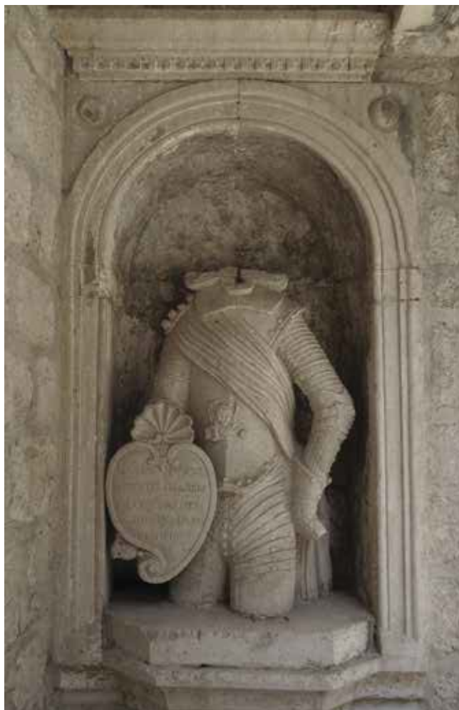
26. Niša s kipom Leonarda Foscola, Korčula, Dvorište Palače Arneri Niche with a statue of Leonardo Foscolo, courtyard of the Arneri Palace, Korčula

našla pred izazovom uvjetovanim povijesnim nasljeđem. Odbacujući kipove mletačkih funkcionara, ti su se Hrvati, gorljivo zastupajući slavenske ideje, obračunavali s rastućim talijanskim nacionalizmom koji je posezao za Dalmacijom kao svojom političkom i povijesnom pokrajinom. Upravo su članovi obitelji Arneri bili među nositeljima narodnjačke politike koja je težila ujedinjenu hrvatskih krajeva, iako je obitelj u doba mletačke vlasti u Dalmaciji pripadala eliti koja je sudjelovala u raspodjeli vlasti pružajući usluge providuru i njegovim suradnicima na otoku i u cijeloj pokrajini. 48