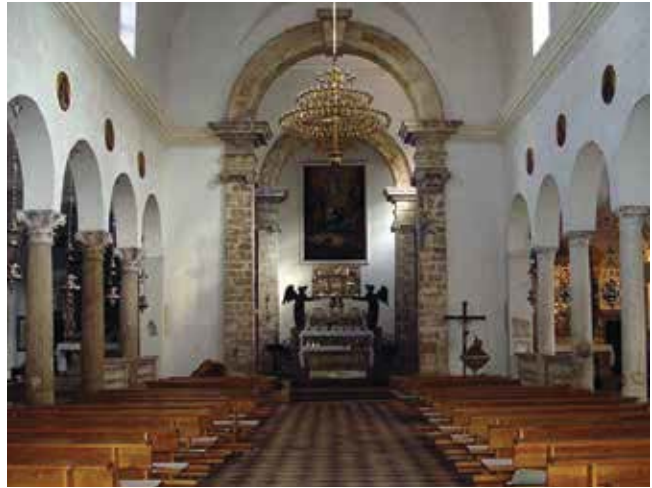
9. Crkva sv. Šime, Zadar St Simeon's church, Zadar