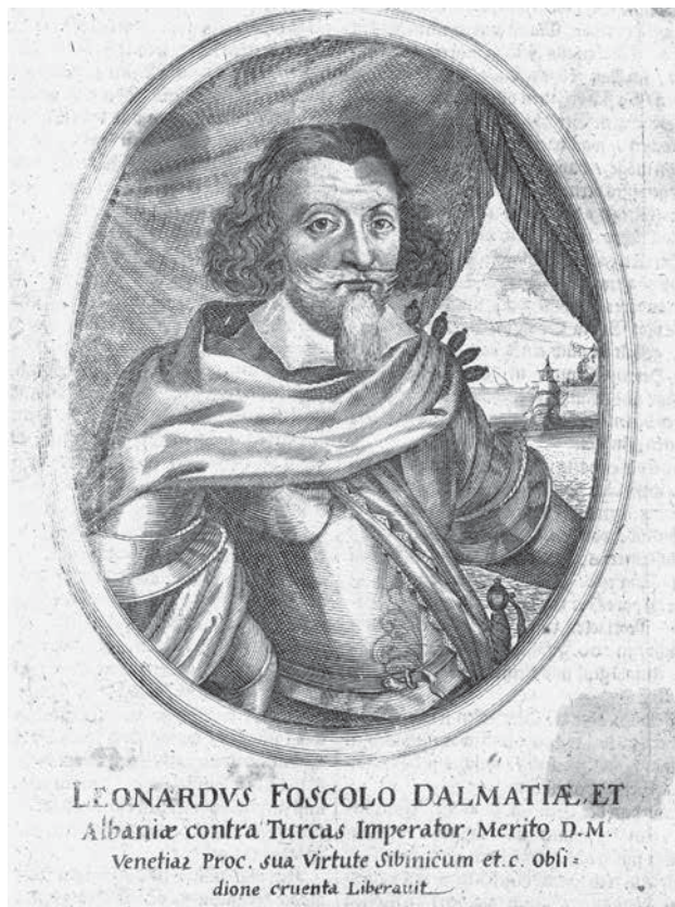
3. Nepoznati autor, Portret Leonarda Foscola Anonymous author, Portrait of Leonardo Foscolo